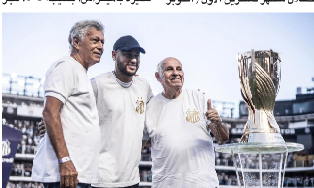
لقطة لنجم نيمار اشرافية في الدوري البرازيلي

نيمار قد انتقل إلى صفوف الهلال السعودي، حيث ان نيمار ابلغ اعضاء الجهاز الفني لسانتوس والعديد من لاعبي الفريق خلال زيارتهم في غرفة تغيير الملابس لدعهمم رغبتهم في العودة إلى النادي البرازيلي في صيف 2025، عقب نهاية عقد مع الهلال. وكان سانتوس البرازيلي، فاز على نظيره باليراس، بنتيجة 0-1، فجر