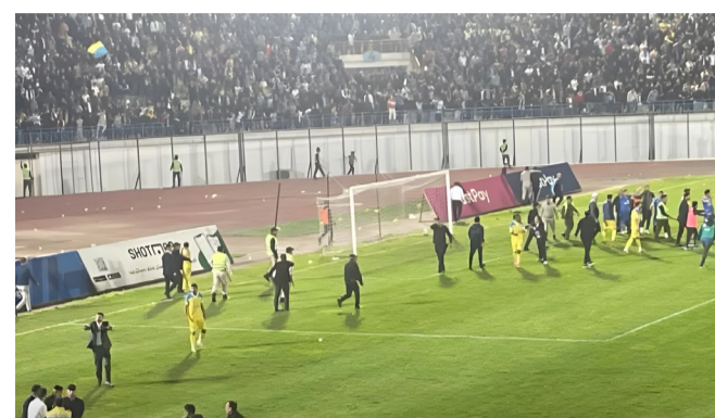
صورة من مباراة كرة قدم بين ناديي الحشد والجوية.

لاعبينا، لأن التعدي كان واضحاً والنية كانت الضرب المتعمد وإبذاء اللاعبين). واضاف، ان (فريقنا عاش في آخر 20 دقيقة من المباراة تحت أجواء من الخوف والتعرق والقلق) مبيّنا أن (وقد نادينا بأن يفكر فقط بالخروج من الملعب، قبل التفكير بالنتيجة التي لا تتساوى شيئاً بكل تأكيد أمام حياة اللاعبين). وبين، ان (فريقنا دفع ثمن غياب الأمن في مباراة دهوك، وهنا نستغرب كيف شرف المباراة وحكمها الغائب عن المشهد،