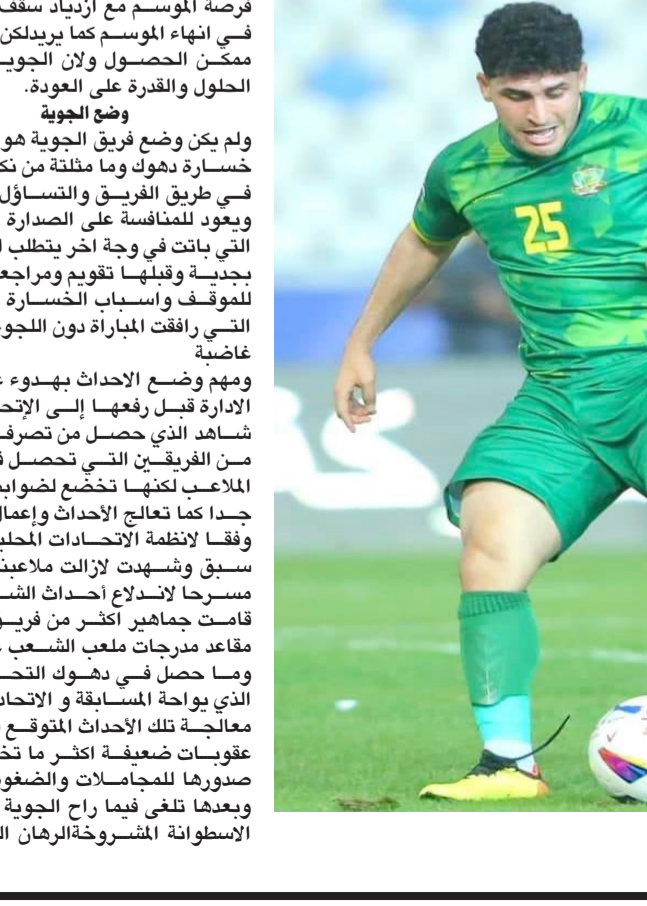
صدارة - فريق الشرطة يحتل صدارة الترتيب بعد فوزه على الحدود