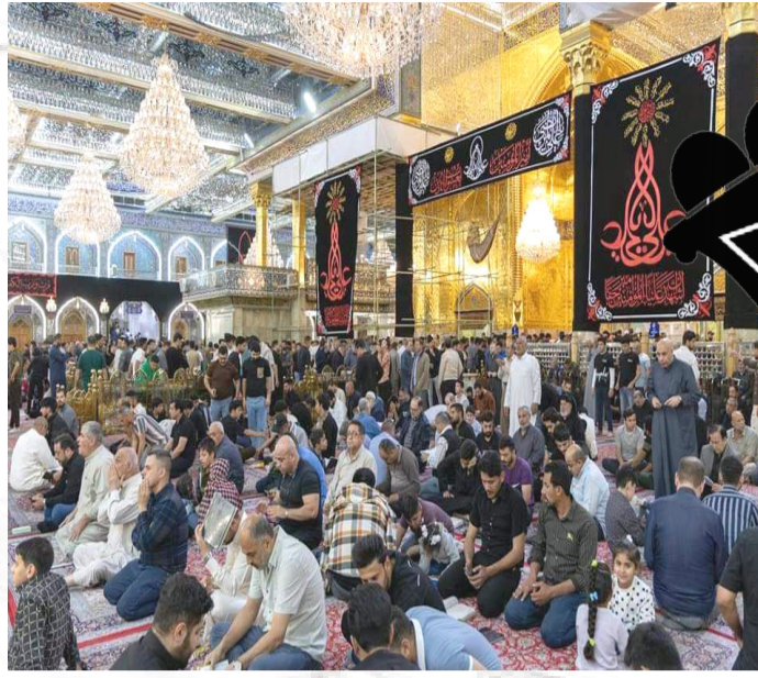
مؤمنون يحيون ليلة القدر الأولى في العتبة العباسية عند مرقد أبي الفضل العباس (عليه السلام)