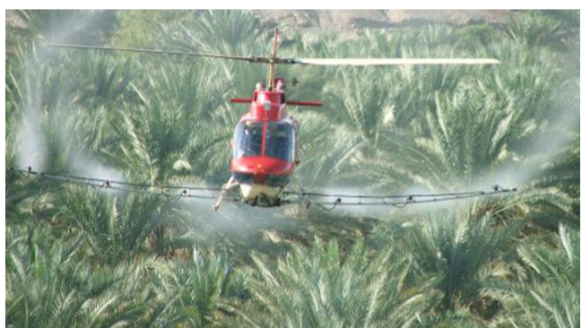
مكافحة : الطيران الزراعي يكافح الحشرات

وبادرت الوزارة، بتوزيع مساعدات غذائية وعينية بين العائلات النازحة والمتعففة. إغاثة العوائل وقال البيان أن (المبادرة شملت توزيع 2500 سلة غذائية إلى الأسر في مخيمات النازحين بمناطق اطراف بغداد والأحزاب، وستستمر حتى نهاية شهر رمضان وأيام العيد في كل مناهضا التسويقية)، ودعت الوزارة الأسر إلى (زيارة المتفكفة خلال رمضان، للاستفادة من الدعم الذي تقدمه في تلك المنافذ، وبأسعار مخفضة بنسبة 50 بالمئة عن السوق).