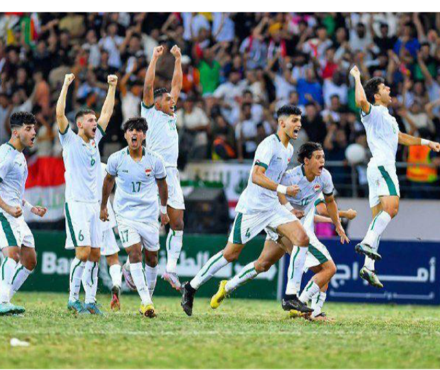
كرة: المنتخب الاولبي بكرة القدم