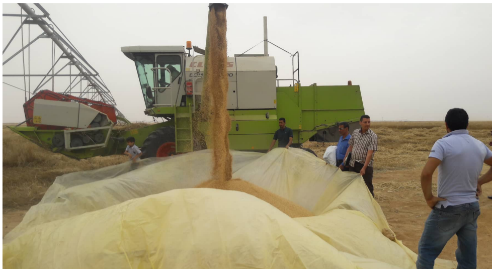
حنطة : استعدادات لنقل محصول الحنطة الى الساليو

بلغت أكثر من 47 بالمئة من إجمالي الصادرات، كما بلغت قيمة صادرات 2022 نحو 10.3 مليار دولاراً، وهي أعلى كمية صادرات من إيران للعراق خلال عقد، محققة نمواً بنسبة 15.5 بالمئة مقارنة بعام (2021)، وحسب المهريين والمتلاعبين بكميات الحنطة المسوقة، وتشديد الرقابة من قبل الأجهزة الأمنية خلال موسم الحصاد للحيلولة دون تهريب الحنطة. انخفاض الصادرات على صعيد متصل، انخفضت قيمة الصادرات الإيرانية غير النفطية، إلى العراق خلال العام الماضي إلى 13 بالمئة، مقارنة بالعام الذي سبقه، وأشارت إحصائية إيرانية، إلى تصدير إيران نحو 113 مليون طن من السلع غير النفطية، بمبيبة أن قيمة تلك الصادرات بلغت 40.5 مليار دولار خلال العام المنصرم حتى 21 كانون الثاني من العام الجاري، وأوضحت الإحصائية أن الصادرات سجلت ارتفاعاً بنسبة 9 بالمئة في الوزن وانخفاضاً بنسبة 11 بالمئة في القيمة مقارنة بنفس المدة من العام الماضي، وتابعت أن (الصادرات الإيرانية غير النفطية إلى العراق، بجانب الصين،