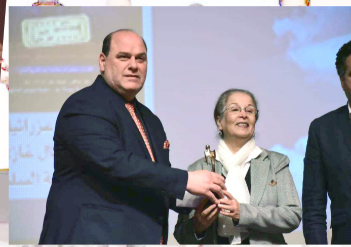
فعاليات : لقطات من فعاليات أيام مسرحية عراقية وعرض (لجنة بيضاء)