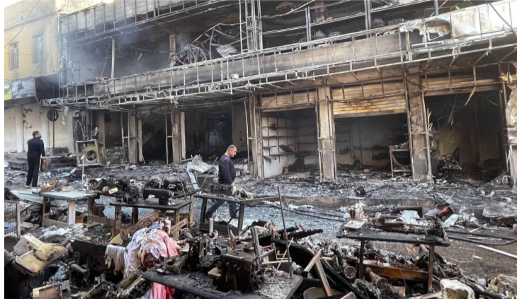
حريق : اثار الحريق الذي التهم سوقاً شعبياً في دهوك

التركان يناشدون الحماية عقب إغتيال رئيس عشيرة البيات