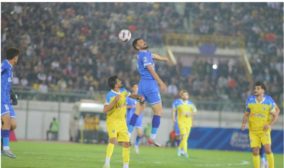
خسارة: تعرض فريق القوة الجوية الى خسارة امام دهوك بالدوري