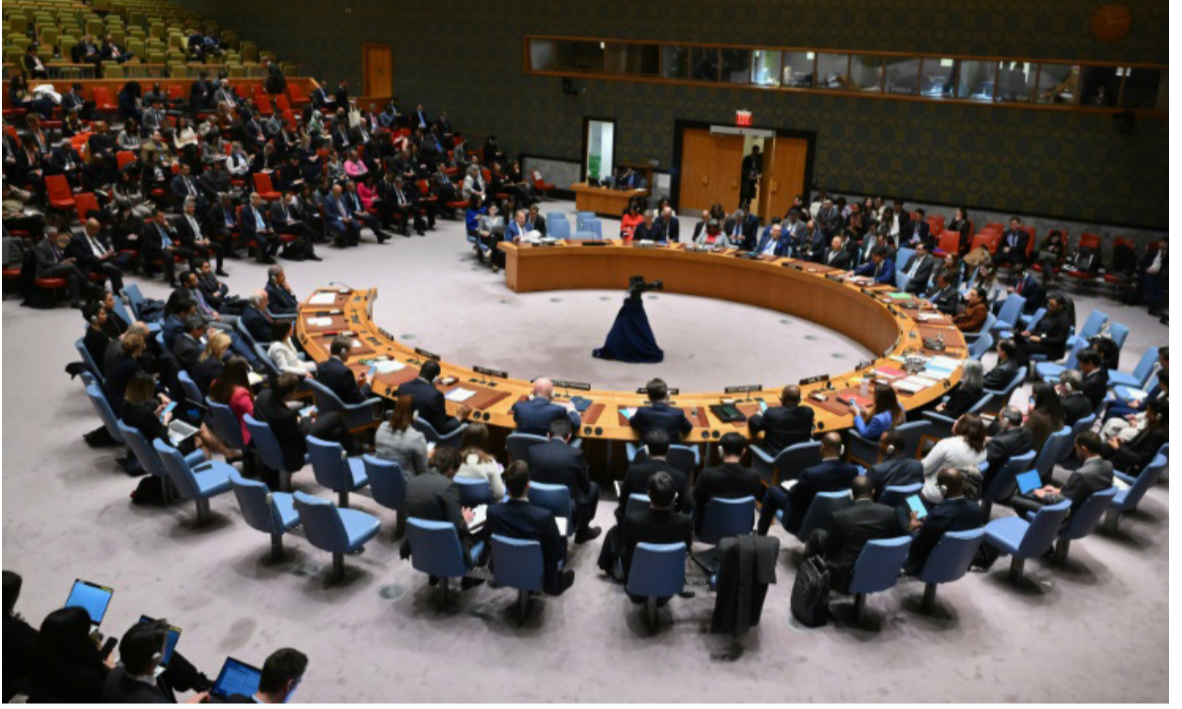
جلسة : جانب من جلسة مجلس الامن الدولي التي شهدت قرار وقف النار في غزة

المجتمع الدولي من مخاطرها على المدنيين الفلسطينيين المكثسين فيها وودت امس صافرات الإنذار في بلدات إسرائيليه قريبة من قطاع غزة، وكذلك أيضا في شمال الدولة العبرية، بحسب ما أعلن الجيش الإسرائيلي. فيما حذر وزير الخارجية الأمريكي أنتوني بلينكن، وزير الدفاع الإسرائيلي يوزاف غالانت خلال اجتماع في واشنطن من (مخاطر اجتياح رفح)، مجددا التأكيد على (رفض الولايات المتحدة لمثل هكذا عملية عسكرية واسعة النطاق)، وعقد الاجتماع بين بلينكن و غالانت في مقر وزارة الخارجية في واشنطن بعيد ساعات من إلغاء إسرائيل زيارة كان مقرا أن يقوم بها وفد رفيع المستوى