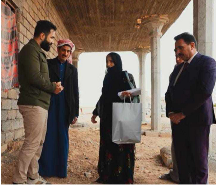
زيارة : فريق قناة (الشرقية) خلال زيارته عائلة في النمرود