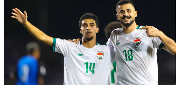
افراح : معالم الفرحة ترسم على محيا لاعبي منتخب العراق

حقق المنتخب الوطني بكرة القدم امس، فوزا كبيرا على مضيفه المنتخب الفلبيني بنتيجة خمسة اهداف من دون