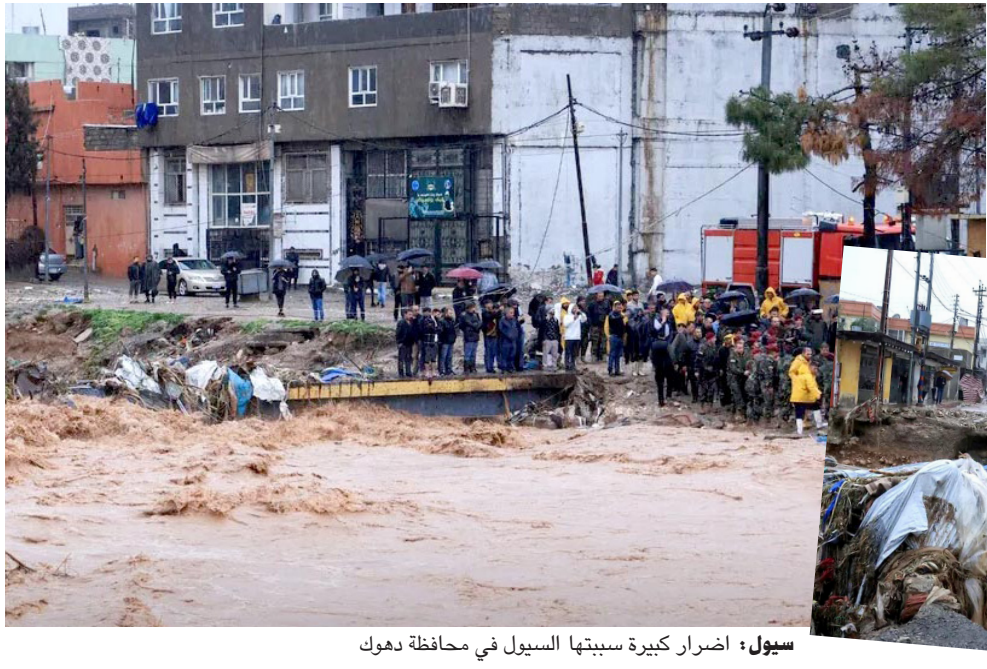
سيول: اضرار كبيرة سببتها السيول في محافظة دهوك