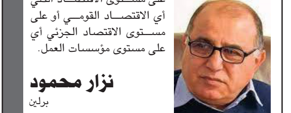
نزار محمود برلين

□ (أندين بلجيكا) أف ب - (على مساحة من العشب الأخضر قرب إحدى الغابات، ينهمك أطفال جيلسون الفرصاء في تكوين أشكال هندسية، وبالأصغر التي جعلوها قبل ذلك بقليل من تحت الأشجار، لا بالقلم والمسطرة، يرسمون مستطيلات وخماسية ومسدسات. في هذا المرح الكبير الواقع على بعد عشر دقائق مشياً من مدرسة بلدة فيزان ضمن نطاق مدينة أندين بوسط بلجيكا، كان أعمارهم بين 11 و12 عاماً. وطلب المعلم من التلاميذ تشكيل حلقة جلوساً لكي يتسنى له الاستماع إليهم وهم يعرضون عن أنفسهم ويتكلمون عن تسجيل "توقعات مختلفة".