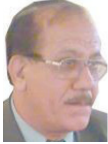
حاكم محسن الربيعي