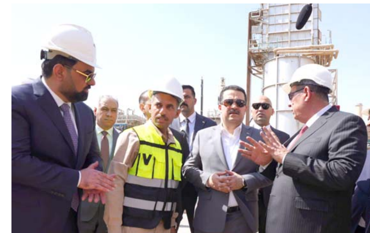
تفقد: رئيس الوزراء يتفقد موقع مصنع بيجي