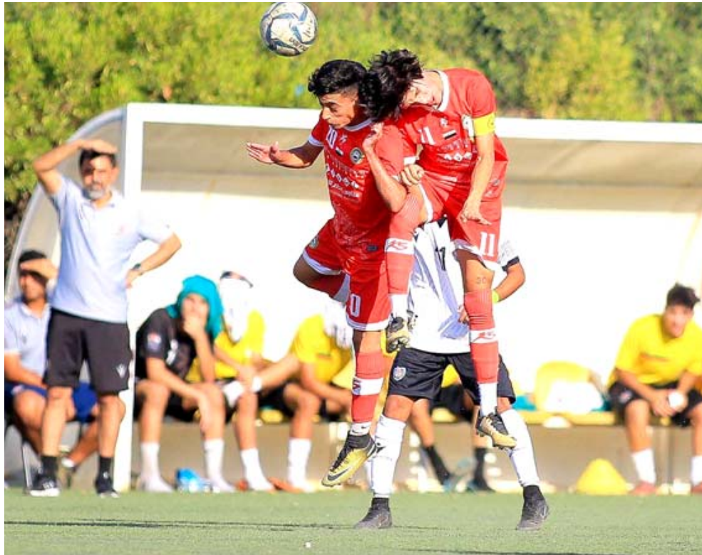
فوز: حقق شباب نطق البصرة فوزه الثاني ويبلغ الدور الثاني

وتمكن الامانة من رفع حظوظه في المنافسات والتطلع الى التأهل بعد تغلبه على الزراء بعدما تصدر مجموعته في الختام من الجولة الثانية بالخروج بنتيجة ايجابية بعد السقوط امام نقط البصرة وتأخيراتها العالية جدا كما سيخوض الفريق لقاء حاسما امام الناصرية وللعجب ورغبة الفوز وهي النتيجة التي من شأنها ان تمنحه تحديد طريق التأهل للدور نصف النهائي لكنها تبدو مهمة صعبة لرغبة المنافس في اللعب بشعار يجب الفوز للاطلاع على امالة في المنافسة، الناصرية بثلاث نقاط من الفوز على الزراء وبرصيد خمسة اهداف وعليه ثلاثة اليوم الخميس في مواجهة الزوراء من جانبه تعتبر الناصرية في الخطوة الامم