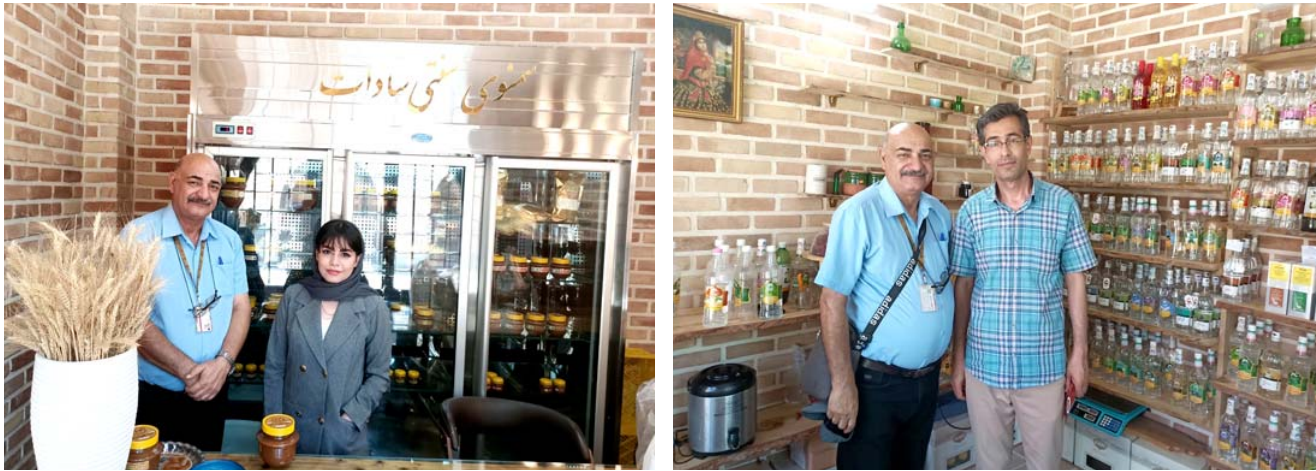
مطعم: الكاتب داخل مطعم حسين التراثي بطهران

طهران - حمدي العطار انتهت رحلتنا الى طهران اليوم ليلا نعود إلى الحبيبة بغداد. كان علينا زيارة اكبر برج في إيران هو برج ميلاد الذي يبلغ طوله 435 مترا. وقد افتتح عام 2008 لأغراض تقوية البث الإذاعي والتلفزيوني وتحسين خدمتي الاتصالات والانترنت.