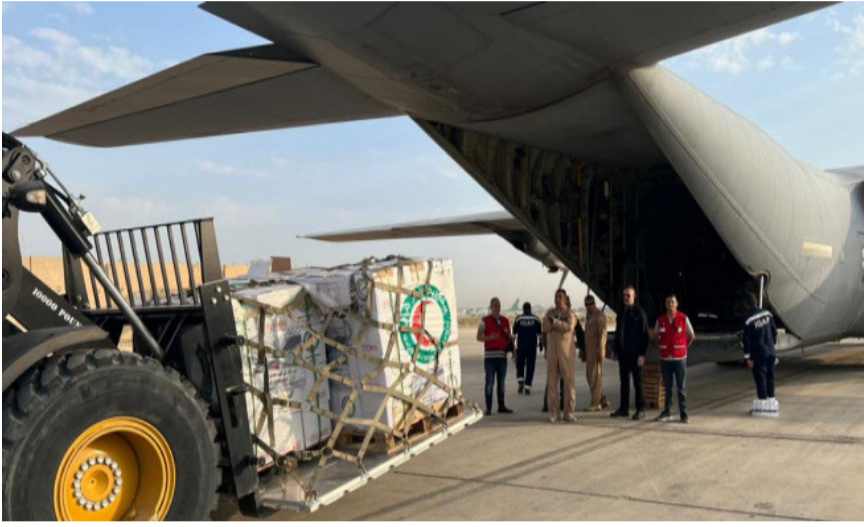
مساعداات : طائرة مساعدات عراقية تصل الى الأردن ليصالها الى اهالي غزة

من المساعدات الإنسانية إلى غارة اسرائيلية استهدفت مركبة بمنطقة صور في جنوب لبنان وافاد بيان امس بدسقوط شهيد وثلاثة جرحى جراء الغارة المعادية التي نفذتها مسيرة من دون اي تفاصيل اخرى عن هوية الشخص المستهدف.