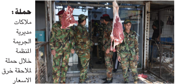
حملة : ملكات مديرية الجريمة المنظمة خلال حملة للالحقة خرق الاسعار

اللحوم، وأكد ان (العالم بأسره يشهد ارتفاع الأسعار)، وقال العياوي، في تصريح امس ان (ارتفاع أسعار اللحوم عالمياً، أثر في كل دول المنطقة ومنها