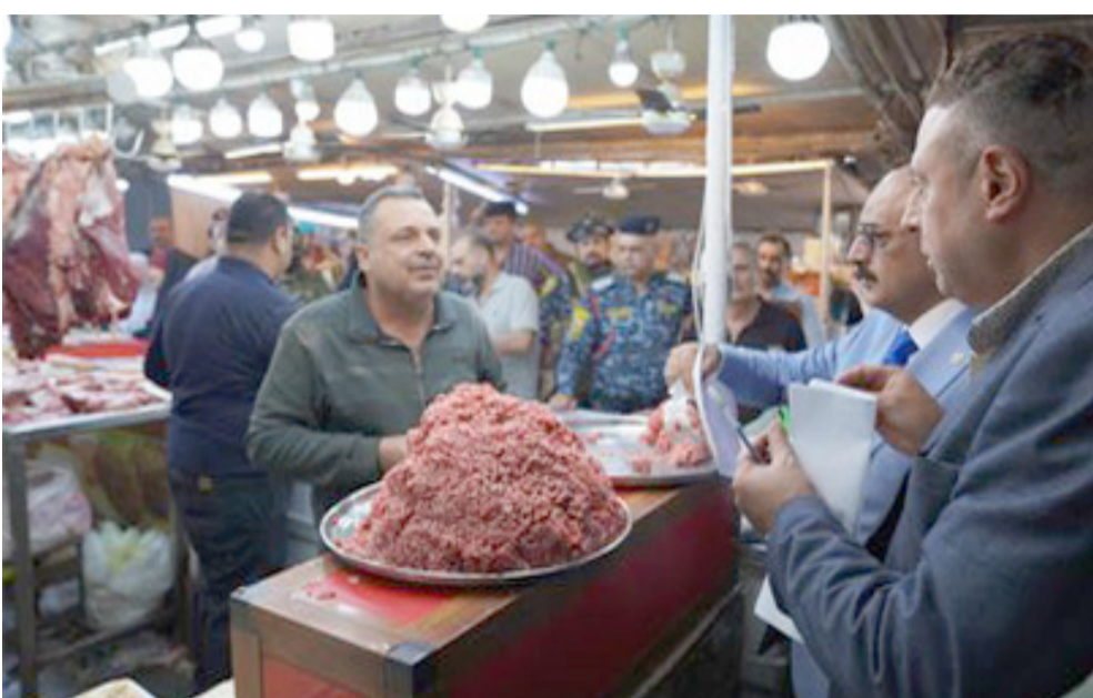
اسواق: جانب من حملة رقابية في سوق بغداد

مؤكداً ان الحملة انضمت عن رصد بعض المتلاعبين بأسعار اللحوم والأسماك، وتم اتخاذ الإجراءات القانونية بحقهم، وتابع ان (الحملة ستستمر من اجل القضاء على هذه الظاهرة). اسواق محلية على صعيد متصل، اطلق وزير التجارة اثير الفريري حملة رقابية واسعة لمراقبة أسعار المواد الغذائية بالمحلية، ومراقبة نشاط الولاء وتوزيع المواد الغذائية بأسعار مدعومة لجميع المواطنين، وحدت الوزارة، أسعار اللحوم التنافسية المتاحة في منافذها لدعم المواطنين خلال رمضان، وبين الموسوي، ان المنظمة، نفذت حملة رقابية واسعة شملت العديد من الاسواق المحلية، ومحال الجملة والمفرد في بغداد والمحافظات، التي جانب متابعة وعمل ولاء المواد التموينية لمعالجة التلاعب، واستغلال شهر رمضان برفع الأسعار واستغلال قوت المواطن، منوها الى (سعي الوزارة لتدقيق أسعار السوق المحلية ومتابعة صلاحية المواد الغذائية، ومراقبة نشاط الولاء وتوزيع المواد الغذائية بأسعار مدعومة لجميع المواطنين)، وحدت الوزارة، أسعار اللحوم التنافسية المتاحة في منافذها لدعم المواطنين خلال رمضان، وبين الموسوي، ان