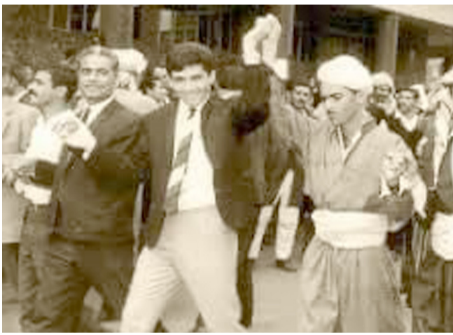
فرج عراقيون فرحون بإتفاقية 11 آذار

بغداد - احمد صابر اتفاقية 11 مارس 1970 كانت تاريخية بين الحكومة العراقية وشورة ايلول الخالدة بقيادة مصطفى البارزاني، تمثل الاتفاقية حجر الأساس للحقوق القومية للشعب الكردي في إقليم كردستان العراق، وقد كانت مرجعاً قانونياً لكل القوانين والأنظمة اللاحقة المتعلقة بالشعب الكردي وتؤكد مكانة الكرد ضمن الدولة العراقية وكانت تهدف إلى حل النزاعات الطويلة الأمد بين