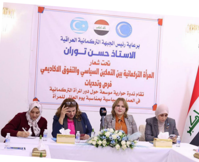
جلسة: ندوة حوارية عن المرأة التركمانية

عقد الجبهة التركمانية المزيد من الندوات والمؤتمرات الثقافية، وتشكيل فرق رصد للحالات المتعلقة بحياة النساء، وكذلك وضع دراسة موسعة عن الحالات غير الصحية للمرأة والمجتمع، بغية معالجةها، واستناد الصحيح، وتفعيل دور المئات من الضابطات بالجيش والشرطة ومناصب مهمة بالوزارات، وتسند مناصب مهمة المدرء العامسين والقاضيات، والاكاديميات والمستشارات)، منوهة الى (اهميتها في تنفيذ التوصيات ليتم العمل عليها، وتنفيذ المهمات، لصناعة الجيل القادم من الشباب والنشطين الناشجين ليكونوا نواة الشعب من كل القوميات والإطياف)، وركز حوار الجلسة على (إعداد مسودة تشريعات حديثة تعزز دور المرأة في المجتمع فكرياً وثقافياً، ترسيخ الاحترام بين القوميات والاديان في العراق، والتركيز على دور الإعلام في معالجة ما حصل للنساء بمرحلة ما بعد ارضاء داعش، فضلاً عن أهمية