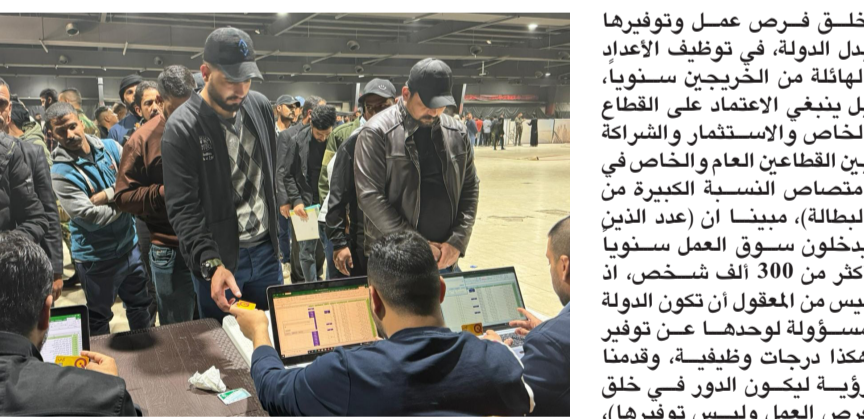
استلام : عناصر الحشد الشعبي يتسلمون بطاقة الرواتب الذكية

وتابع ان (يوم السبت المقبل سيخصص لعملية التوظيف لخريجي الدورات 36 و 38 و 40 و 41، وفق إجراءات تنظيمية دقيقة وسريعة لجميع العائدين للخدمة في صفوف الحشد الشعبي). الى ذلك أعلن محافظ ذي قار، مرتضى عود الإبراهيمي، عن نتائج الفرز الأولى لأسماء المقبولين من المتقدمين للعمل بصفة عقد على مراك مديرية تربية المحافظة. وذكر بيان تلقته (الزمان) امس ان (ذي قار، أظهرت بصرعة عقد على الفائزين للمتقدمين بصفة عقد ضمن مراك المديرية العامة لتربية المحافظة، والتي جاءت حسب النسب المخصصة لكل قسم، والوابط الوزارية لدرجات المفاضلة)، مشيراً الى (توزيع الدرجات الوظيفية حسب النسب السكانية وحاجة كل وحدة ادارية للاختصاصات الملغنة)، وأوضح انه (بإمكان جميع المتقدمين من غير المقبولين تقديم اعتراضاتهم على نتائج القرعة، حسب الآلية التي وضعتها المديرية بمدة اقصاها نصف شهر، ويواصل الإبراهيمي، جولته الليلية في شوارع مدينة الناصرية، للاطلاع على كيفية سير العمل في مكاتبه، وقال البيان انه (جرى خلال الجولة لقاء المحافظ بـ 30 من رواد ومثقي المحافظة في مكتبه الإداري، وتبادل الحديث معهم، مقدماً التهناني للجميع بمناسبة شهر رمضان)، في غضون ذلك، أطلقت رابطة خريجي كلية بغداد، حملة تنظيف ومأهبل شاملة لبعض مرافق هذا الصرح العلمي الذي خرج مئات من النخب المتميزة، وأكدت الرابطة في بيان لها (الحرص الدائم على المؤسسات التعليمية، والحفاظ على صورتها المشرفة)، وأوضح البيان ان (مجموعة من الطلبة شرعوا بإعادة التأهيل والتنظيف، بهدف توجيه رسالة للجيل الجديد بان العراق باق، من أجل الارتفاع بالمستوى الثقافي والتعليمي للطلبة).