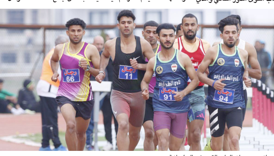
سباق: جانب من سباق ألعاب القوى في السلیمانية

عراقية في فعالية السباعي ورمي المطرقة. واحتل نادي الجيش المركز الأول بعد ان جمع 276 نقطة، وحل نادي اختتمت منافساتها في مدينة السلیمانية بمشاركة 550 رياضياً يعطون 77 نادياً ولكلا الجنسين، وشهد تحطيم 3 ارقام قياسية بغداد- رافه البديري توج نادي الجيش لفئة الرجال بطولة اندية ومؤسسات العراق بألعاب القوى الدور الثاني والذي عراقية في فعالية السباعي ورمي المطرقة. واحتل نادي الجيش المركز الأول بعد ان جمع 276 نقطة، وحل نادي اختتمت منافساتها في مدينة السلیمانية بمشاركة 550 رياضياً يعطون 77 نادياً ولكلا الجنسين، وشهد تحطيم 3 ارقام قياسية