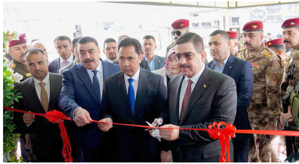
افتتاح: محافظ نيونى يفتتح مشروعاً

من 19 مخزناً، بمساحة الف متر مربع لكل مخزن، وبين أن (هناك خطة مستقبلية يجري اعدادها بالتعاون مع المحافظة، ومن المؤمل إنجازها خلال العام الجاري)، بدوره، اطع فريق الجهد الحكومي، على الأعمال المنفذة في مشاريع محافظة ميسان ونسب الإنجاز، لافتاً إلى بقاء البنية التحتية الجديدة للمشاريع المستقبلية للعام الجاري، وقال مسؤول الفريق الخدمي في ميسان،