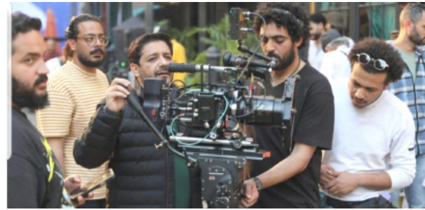
برنامج : لقطات من كواليس تصوير حلقات البرنامج الاستعراضي (مراجيح)