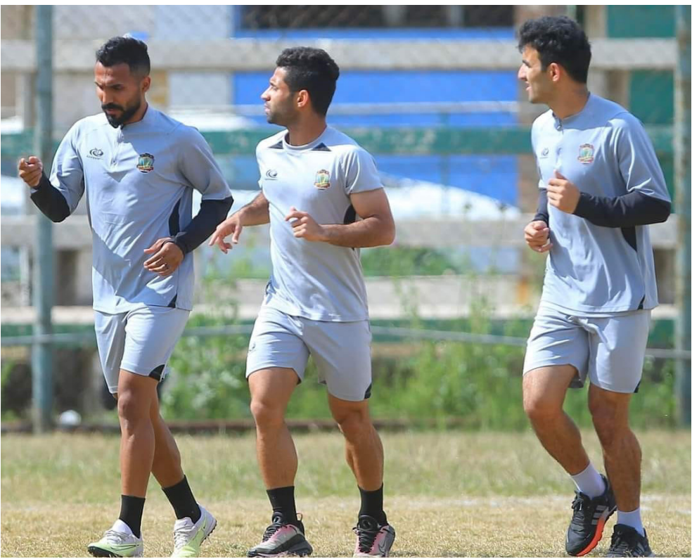
تدريبات فريق الشرطة يستعد عبر وحداته التدريبية لمواجهة المقبلة في الدوري