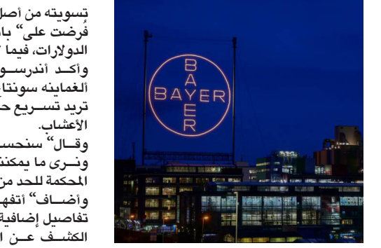
تطوير بديل للمبيد الحشري المثير للجدل غليفوسات، على ما قال رئيس المجموعة الألمانية للمنتجات الكيميائية والصيدلانية ميل أندرسون في مقابلة نشرتها الأحد "صحيفة فرانكفورتر الغمائية" سوتناغ تسابوتونغ الألمانية.

برلين (أ ف ب) - تعمل "باير" على تطوير بديل للمبيد الحشري المثير للجدل غليفوسات، على ما قال رئيس المجموعة الألمانية للمنتجات الكيميائية والصيدلانية ميل أندرسون في مقابلة نشرتها الأحد "صحيفة فرانكفورتر الغمائية" سوتناغ تسابوتونغ الألمانية. وقال أندرسون لصحيفة "الغمانية" نختبر هذه المادة الجديدة على نباتات حقيقية. وهذا أول ابتكار ثوري في هذا المجال منذ