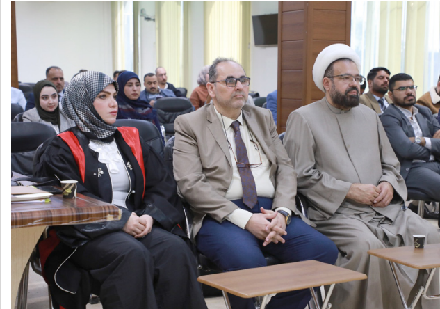
حضور: عميد المعهد والحضور