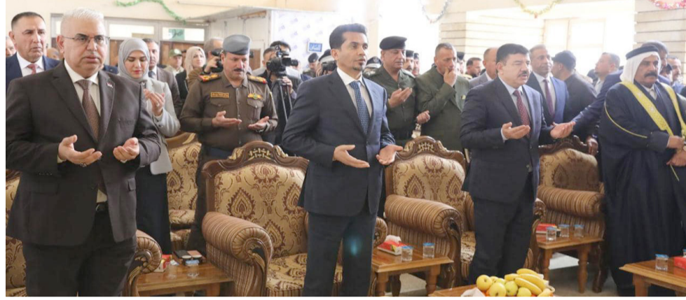
افتتاح: وزير النقل خلال مؤتمر افتتاح خط بغداد يجي

بالحظ الجديد عند المحطات، كما تضمن المشروع إنجاز صب معبر الديوم عب تكسير ورفع التلبيط لشوارع المنطقة، وإنشاء معبر تقاطع مع الشارع الرئيسي).