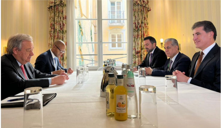
لقاء : رئيس إقليم كردستان يلتقي في ميونخ الامين المتحد

رئيس إقليم كردستان يلتقي في ميونخ الامين المتحد