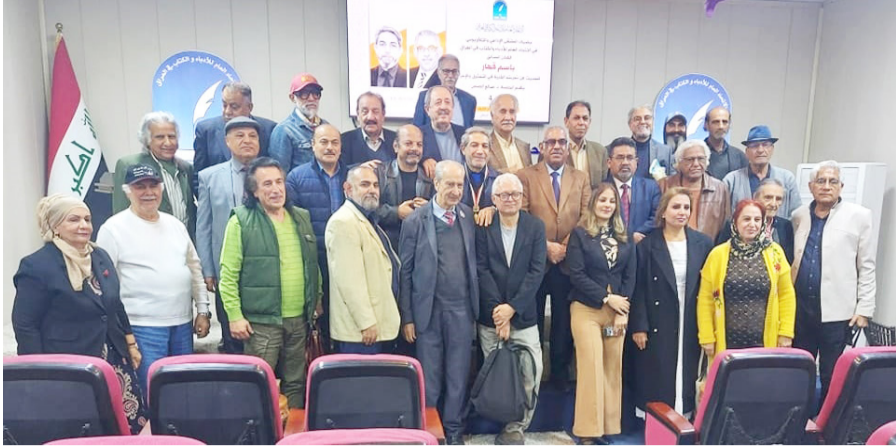
احتفاء: لقطات من جلسة احتفاء الملتقى الاداعي والتلفزيوني باسم قهار