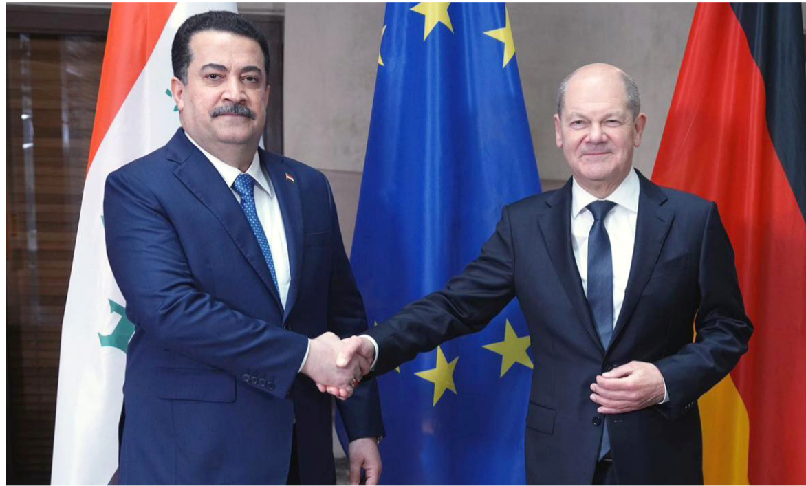
مصافحة: رئيس الوزراء العراقي يصافح المستشار الألماني قبل عودته الى بغداد

مجالات عديدة، أبرزها التعاون في مجال تكنولوجيا المعلومات والذكاء الاصطناعي وتوظيفها في تطوير القطاع الزراعي، وكذلك في مجال الحكومة الإلكترونية، التي تمتلك إمكانية تجارب وخبرات متقدمة فيها، حيث تم الاتفاق على إرسال وفد فني عراقي إلى استونيا لبحث هذا الملف المهم ومناقشة الباتية.