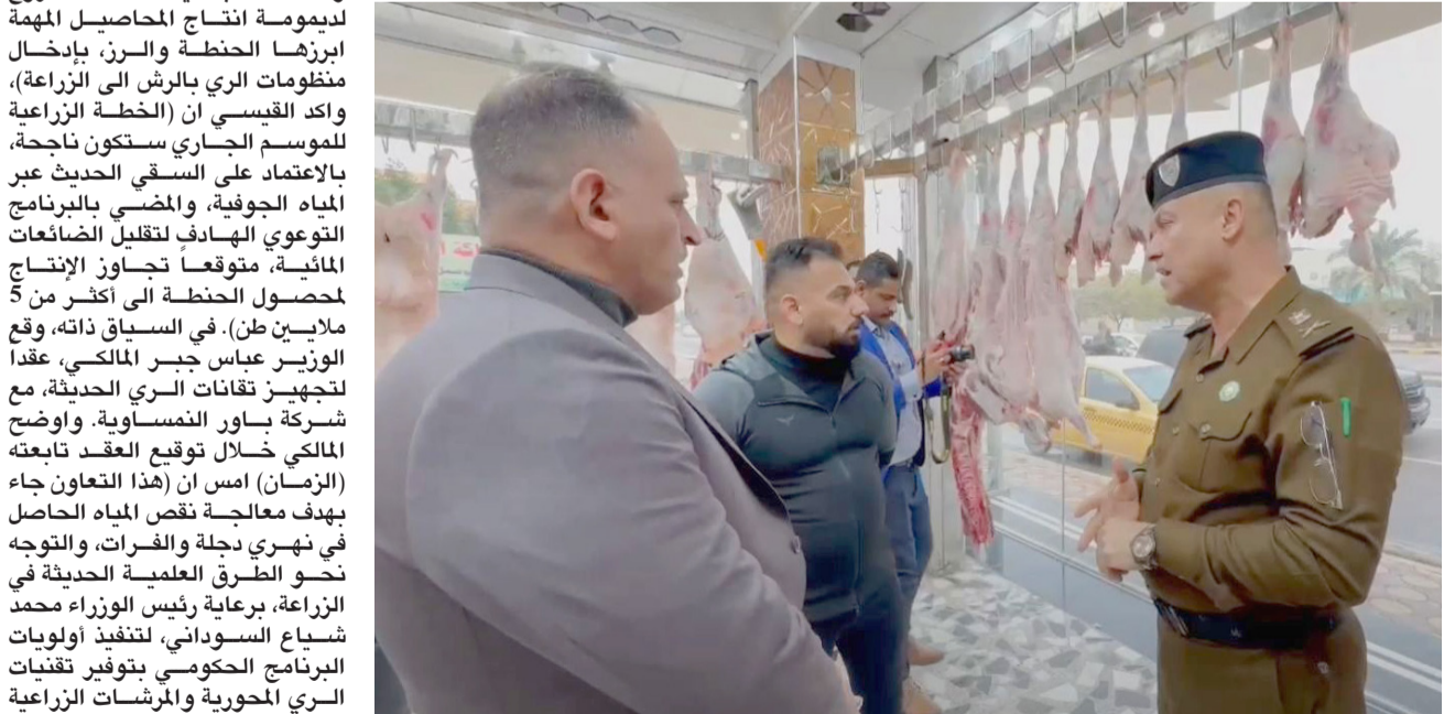
رقابة: فرق رقابية تتابع محال اللحوم في النجف

بغداد - ابتهاج العربي تضمن إعادة تأهيل الطرق الرئيسية في سابلو كركوك الرئيس والهيئتين الأولى والثانية في سابلو الرياض، فضلا عن إنشاء مخازن تعبئة في سابلو تازة هذا العام لتوسيع التخزينية إلى أكثر من 165 ألف طن من الحنطة، بعد أن كانت 130 ألف طن، لافتا إلى ان (مراحل التأهيل