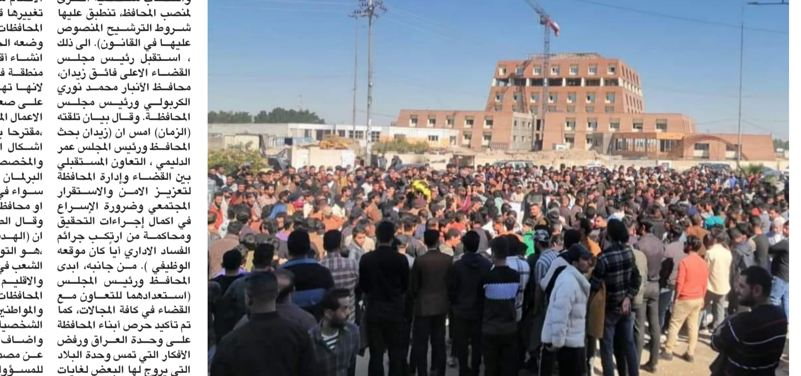
تعيين : مظاهرون يحتجون امام مبنى محافظة ذي قار للمطالبة بالتعيينات

على تسلم المحافظ الجديد ، فضلا عن وجود جنائية بحقه في وزارة الداخلية، وأضافت ان الرئيس عتذ عليه إصدار مرسوم جمهوري بتعيين الجبوري محافظا لصلاح الدين)، مؤكدا ان (الانتخابه جاء مخالفا لقانون الانتخابات مجلس المحافظات والأقضية وقانون المحافظات الخاصة بتنظيم الأقاليم الا ان ظروف صياغة الدستور في حينه تغيرت الان ومعظم من كانت لديه القناعة بهذه الاحكام مقتنع الان بضرورة تغييرها قدر تعلق الامر ببقية المحافظات عدا كردستان بحكم وضعه الخاص، لذا فإن فكرة انشاء اقاليم أخرى في أي منطقة في العراق مرفوضة لانها تهدد وحدة العراق)، على صعيد متصل ، قدم رجل الأعمال المعروف ميرش الطيار مقترحا يقضي بحجب كافة اشكال الامتيازات والرواتب والمخصصات من كافة اعضاء البرلمان ومجالس المحافظات سواء في العراق بشكل عام او محافظات اقليم كردستان. وقال الطيار في بيان امس ان (الهدف من ذلك المقترح هو التوجيه الحقيقي لممثلي الشعب في البرلمان الاتحادي والاقليم وفي مجالس المحافظات كافة لخدمة الشعب والمواطن، بعيدا عن المصالح الشخصية)، وأضاف ان (ذلك سيكشف عن مصداقية من سيتصدى للمسؤولية في البرلمان او مجلس المحافظة وخدمة الشعب بلا مصالح).