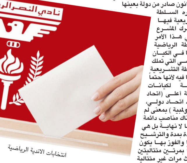
انتخابات الأندية الرياضية

بحسب القانون واللائحة المعنية فهناك من يمنح الفوز بالمنصب لأكثر من دورتين سواء كانتا متتاليتين او متقطعتين، وبالتالي صارت تنظيم هذه الممارسة خاضعا للوصفة الرشيدي التي اوجبهت اللجنة الأوبلية الدولية (IOC) بدءا من مناقشة الأولى مرورا بلوائحها الإزامية وصولا للوائح المنظمة للانتخابات، لأننا نتحدث عن أعلى هرم رياضي بالعالم منه يتم إدارة كل نشاط وكيان رياضي بالعالم، ومنها اي اللجنة الأوبلية الدولية يتم المصادقة على النشاط الرياضي