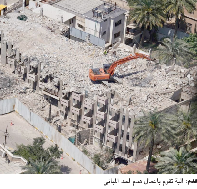
العملية تقوم بإعمال هدم أحد المباني

الثاني للعام الماضي عن مناقصة التأهيل المسبق لأعمال مقاولات البنى التحتية للمشروع، وأغلقت يوم الخامس من كانون الثاني (الماضي)، مشيراً الى (تشكيل لجنة عليا من امانة بغداد ووزارتي التخطيط والإعمار والإسكان، لإخضاع الشركات للمعايير الخاصة بالتأهيل المسبق، والتأكد من كفاءتها، وجرى اختيار خمس شركات عالمية مصنفة اجازات مرحلة التأهيل المسبق)، ودعت الامانة الى تقديم العروض من قبل هذه الشركات لمدة شهر واختيار