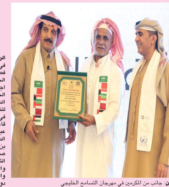
مهرجان: جانب من المكرمين في مهرجان التسامح الخليجي