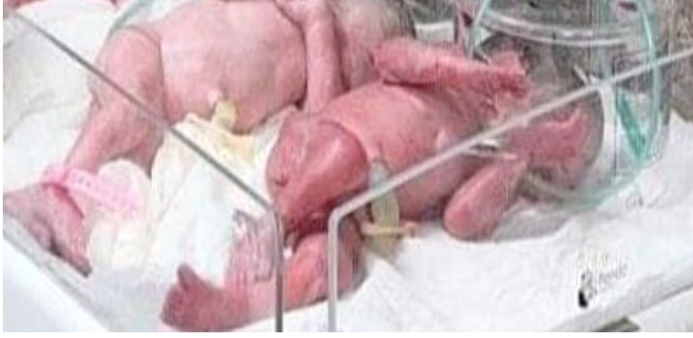
توائم؛ ثلاثة توائم في حاضنة بكربلاء

طفل رضيع عراقي يبلغ من عاما و9 أشهر ويزن 8 كيلوغرامات قدم للمملكة مع أسرته في زيارة سياحية، وذكر سلطان لطب وجراحة القلب بالقصيم عضة تجمع القصيم الصحي معاناة