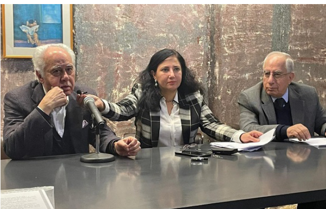
امسية : جانب من امسية الاحتفاء بشعبان بكلمة قصيرة على دور شعبان الذي يمثل مكتبة متحركة وقرر ان ينشر

مجلس الوزراء، بعد ان تم سحب العمل من دور مركز مجلس الوزراء، ويعمل بطاقة تصميمية 6 الف متر مكعب بالساعة)، لافتاً الى انه (مشيد على مساحة 40 دونم ويخدم اهالي مركز قضاء المسيب، ناحية الاسكندرية، الحصرة، جرف النصر). ويشان مشروع مترو بغداد، اكدت وزارة الموارد المائية، ان مشروع مترو بغداد لن يواجه مشكلة بالمياه الجوفية. وقال المتحدث باسم الوزارة خالد شمال، في تصريح امس ان (المياه الجوفية لا تعيق المشروع، وهناك اجراءات بسيطة تتخذها الوزارة بهذا الصدد وفق حسابات هندسية، الى جانب بناء الأنفاق بالكوتكريت لمعالجة الوضع). وتوجه الوزارة لدراج مواقع جديدة ضمن اتفاقية رامسر، مؤكدة