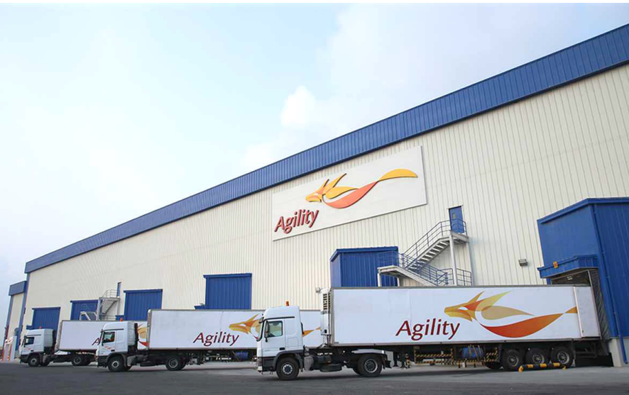
شركة : ال واجهة الشركة الكويتية

مضيفا (إلا ان قرار صادر عن هيئة الإعلام والاتصالات، التي بموجبها هذا الاستثمار عام 2014، وادعت الشركة الكويتية حينها ان العراق حرما من إمكانية الطعن في القرار الصادر ضدها، لذلك لجأت عام 2017 إلى المركز الدولي لتسوية منازعات الاستثمار على أساس صنادير العراق لحقها في الاستثمار بصورة غير مباشرة بما يتشكل مخالفة للاتفاقية الدولية المبرمة بين البلدين)، وأشار