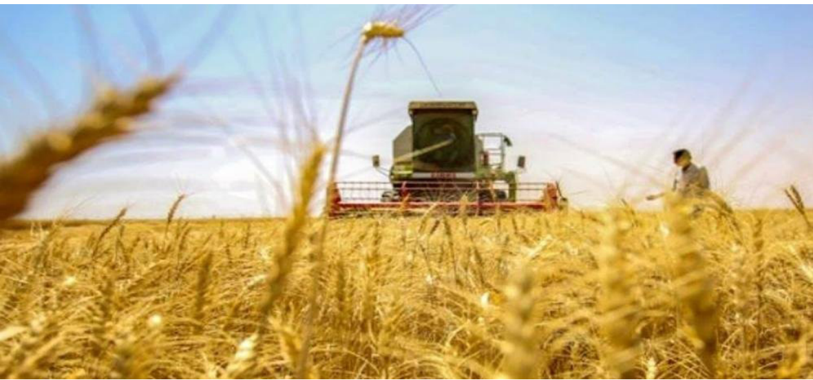
حصده : ايات زراعية تحصد محصول الحنطة

اهمية دور الأراضي الرطبة في تخفيف آثار التغيرات المناخية. وأوضح مدير عام مركز إنعاش الأهوار والأراضي الرطبة، حسين علي حسين، خلال فعالية اليوم العالمي للأراضي الرطبة وانضمام العراق الى اتفاقية رامسر، تابعته (الزمان) امس ان المركز كرس جهده السنوي لتحقيق إنجازات ونشاطات. اراض رطبة كما سلط الضوء على دور الأراضي الرطبة في حل المشكلات البيئية بما تقدمه من خدمات اقتصادية وتكنولوجية المتعمدة بتخزين وتنقية المياه وتوفير الغذاء والماوى لاربعين بالمئة من الكائنات الحية، والحماية من الفيضانات والعواصف