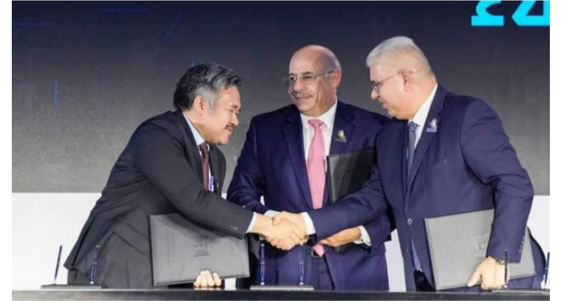
حفل : جانب من حفل توقيع عقد بين وزارة النقل وتحالف شركتي CHSS و HSS

وقال في تصريح امس ان (مشروعى مترو بغداد وقطار كربلاء النجف السريع، طرحا الى الاستثمار، وسوف يقدم كل مستثمر خدماته، ثم سيجري الاعلان عن الشركة