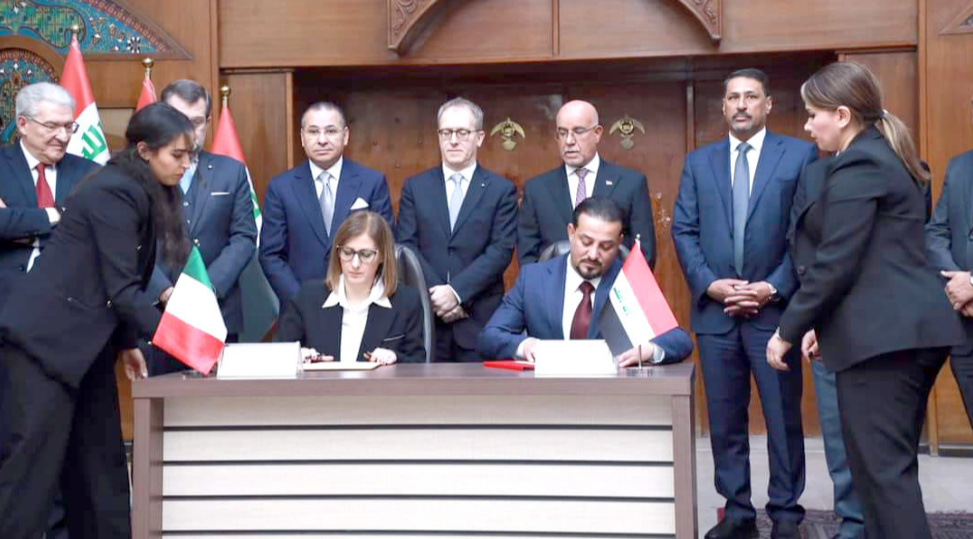
توقيع: وزارة الصحة توقع عقدا مع شركة إيطالية لصيانة وتشغيل مستشفى النجف التعليمي

النجف - سعدون الجابري بغداد - قصي منذر طالب مواطنون، وزارة الصحة، بوضع معالجات جديدة لتجنيب انتشار مرض السرطان بين المدن، مشددين على توفير العلاجات اللازمة، والسماح بالسفر للخارج لتلقي العلاج على نفقة الوزارة، في وقت كشفت فيه الوزارة، عن اعداد مخيفة للمصابين بالسرطان في البلاد، تتجاوز المعدل العالمي، بتسجيل نوعين حسب قولها.