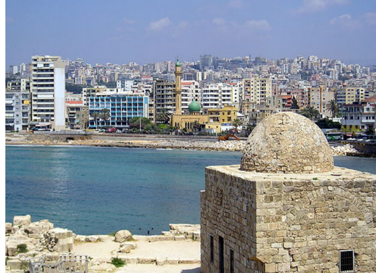
قلعة : صيدا الواقعة على البحر وقلعتها الاثرية