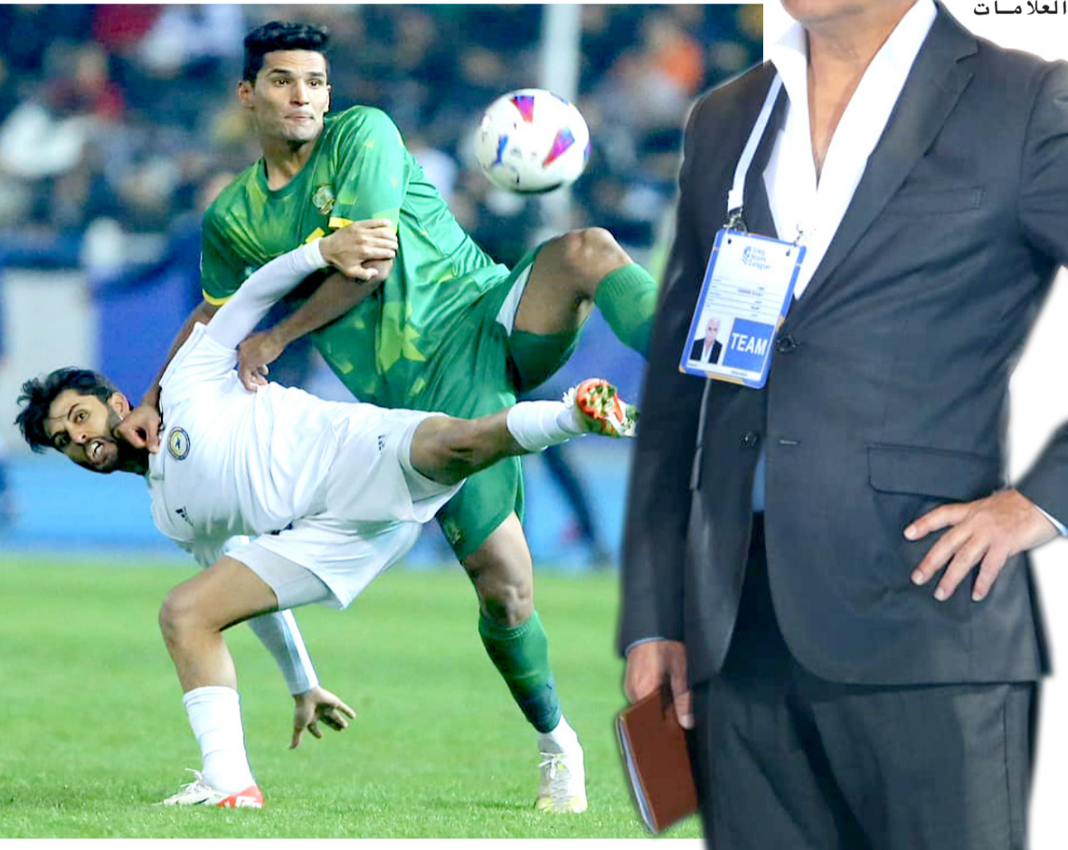
دوري: جانب من مباراة فريق الزوراء والشرطة ضمن دور المحترفين العراقي