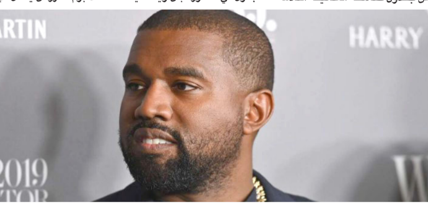
تيم حسن يستعرض عضلاته

□ لوس انجلوس - وكالات - اشار المغني العالمي «كاني ويست»، ضجة كبيرة عبر مواقع التواصل الاجتماعي خاصة بين الجمهور العربي وذلك بعد ان أعلن عن حفله القادم والذي سيكون في مصر. ويشترك في حفله الغرباء معها عبر حسابه في «انستغرام»، كتلفته عن جدول حفلاته الغنائية القادمة