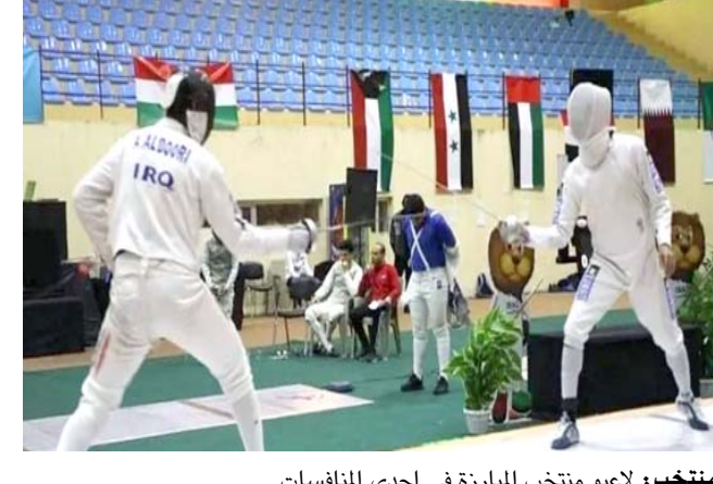
منتخب لاعبو منتخب المبارزة في احدى المنافسات