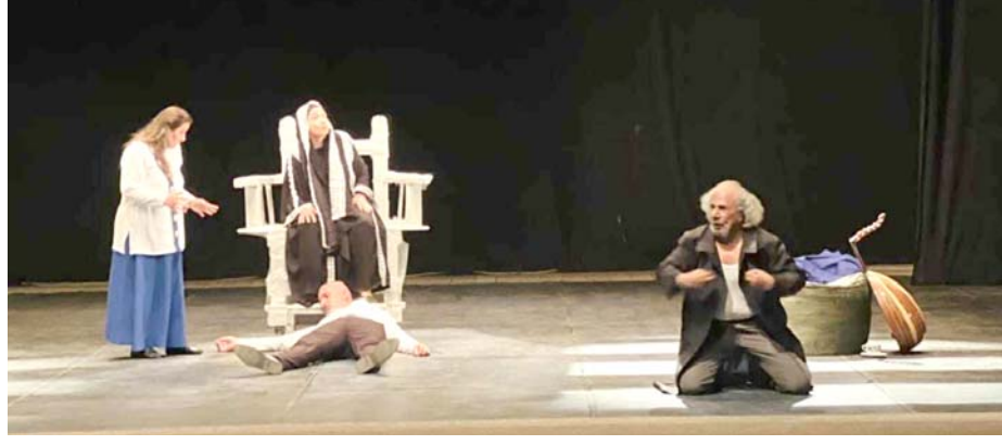
مسرحية: لقطات من مسرحية (جنون الحمامات) على مسرح الرشيد