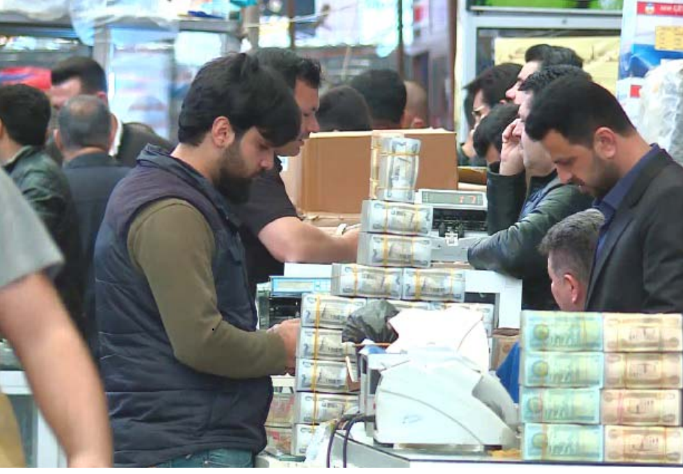
ارتفاع مفاجى أسعار الدولار يتسبب بركود حاد في السوق

من جانبها، نفت وزارة المالية، إيقاف عمليات صرف رواتب الموظفين، وقالت في بيان تلقته (الزمان) اسن ان (الإجراءات) التي تروج لها في بعض مواقع التواصل الاجتماعي من قبل المالسة، (لاصحة لها)، وأضاف ان (الإجراءات) المتخذة الإلكترونية الخاصة بالرواتب في المصرف وهي المسؤولة عليها، ولم تتخذ الوزارة هي ساساي أي توجيه من شأنه التسبب بتأخير صرف الرواتب، والذي تدخلته الشركة لتعاونه قانونيا وبدأت الوقت تعبر الوزارة عن حرصها الشديد ضمان الحقوق المالية لكافة الشرائح من المجتمع، وهي لا تدخر جهدا في مسار تحسين الواقع المعيشي للمواطنين والموظفين على حد سواء، داعيا وسائل الإعلام إلى (عدم اعتماد التصريحات غير المسؤولة، والرجوع إلى المصادر الرسمية الموثوقة للوزارة بخصوص التأكيد من الحقائق والمعلومات الدقيقة وسلامتها). واصلت مصرف الرافدين، ان عدم الحسابات المفتوحة للمواطنين وفئات أخرى في فروعه ببغداد والمحافظات في شهر