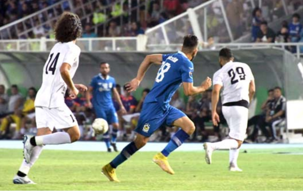
مواجهة : إحدى مواجهات الزوراء والجوية في الكأس

ان يدعمه عبر الحضور الجماهيري بدخول السلقاء محاننا ومحاوله انتهاز الفرصة عبر التركيز على المباراة المهمة وتحسين الفوز والتقدم خطوة نحو النصف النهائي وهذا بعد ذاته بعد انجاز وافضل مرتدية قد يحصل عليها الفريق منذ شارك في الممتاز لكنه ينظر إلى ابعده من ذلك في الانتقال لنهاية البطولة لتحقيق حلم اللقب الاول للفريق والاحتفال به من جانبه سيخوض الحدود لمواجهة بنفس طموحات اهل الارض وبريد تحديد طريق الفوز الجوية لاتوازية نتيجة اخرى تحت عنوان اي بطولة كانت ولانه اعاد تحقيق الاسبقية في هذه البطولة والمواجهة التي يتابعها الانصار على اعصابهم وتخيّلوا كيف سيكون مشهد الاحتفال بالفوز للفريقين سواء .