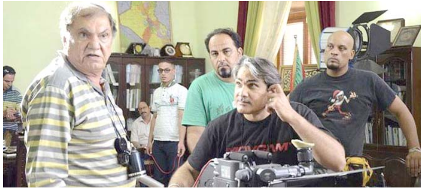
مهرجان: السبعة الأولى من مهرجان بغداد تحمل اسم محمد شكري جميل

العرب وان المهرجان سيعلم خلال الأيام المقبلة، شروط المشاركة في مسابقات المهرجان الرسمية للأفلام الروائية الطويلة والأفلام القصيرة، إضافة إلى البرامج والأنشطة والفعاليات النوعية (المصاحبة).