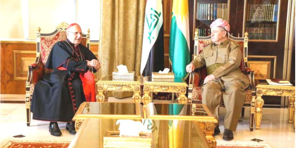
لقاء : بارزاني يلتقي ساكو في اربيل

بإستقبال رئيس الحزب الديمقراطي الكردستاني مسعود البارزاني، في صلاح الدين، الكارديتال لويس ساكوريس الكنيسة الكلدانية في العراق والعالم والوفد المرافق له الذي يتكون من عدد من المطارنة والأساقفة رؤساء الإبرشيات. وقال بيان اسن ان (ساكو) شكر واحترام وتقدير إقليم كردستان للرموز والشخصيات من مختلف الأديان. كما عبر عن شكره لثقافة التعايش في كردستان والتي ساهمت في الحفاظ على المكونات وتاريخها ووفقاتها).