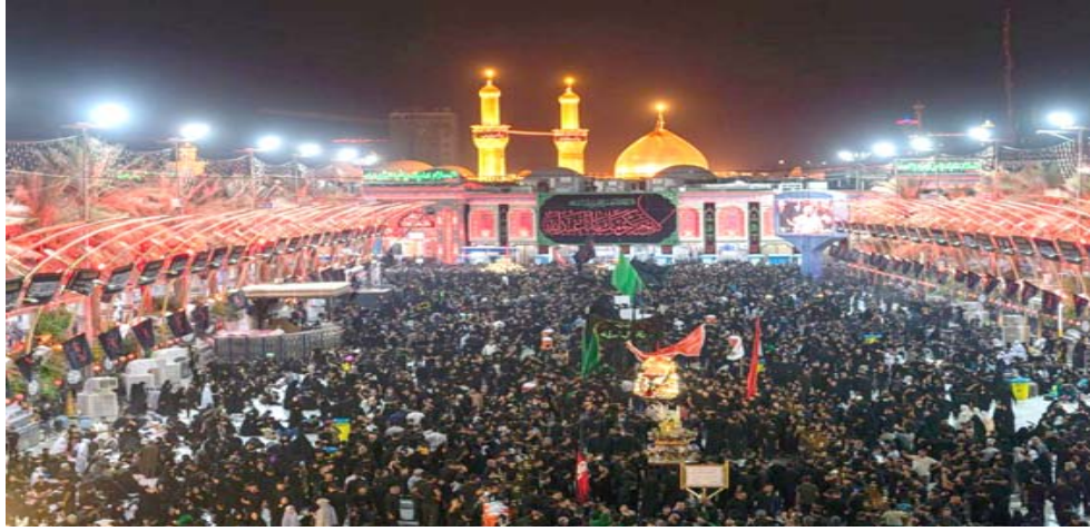
زيارة : ملايين الزوار في كربلاء (ارشييف)