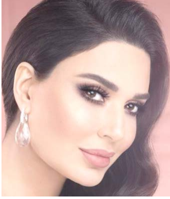
سيرين عبد النور

محببة كبيرة لهذا الجهد النبيل المبذول على خشبة مسرح الرشيد الذي غادرتنا عروضه الصاعدة منذ زمن طويل. صغيرة بتواضع جم، وحكي الكثير من (حمامات الجنون)