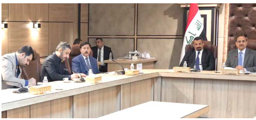
تضييف: محافظ البنك المركزي خلال تضييفه في البرلمان اس

مجددا (استعادته للتعاون في سبيل الخروج من الأزمة)، محمد شيباع السوداني، المركزي بمبدل جهود أكبر لتسيب الإجراءات أمام المواطنين، وقال بيان تلحقته (الزمن) أمس أن (السوداني اجتمع بالعلاء، بحضور المستشارين ومدير عام الاستثمار في البنك، لبحث الإجراءات المتخذة في ما يتعلق باستقرار العملة في السوق، وبرز الخطط المعده لإصلاح القطاع المصرفي وتطويره وتمكينه ليأخذ دوره في تحقيق التنمية المستدامة ومواجهة التحديات، وأشار إلى أن (السوداني استمع إلى أهم التسهيلات المقدمة من قبل البنك، التي تتضمن السماح لصغار