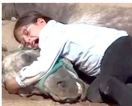
نفوق: طفلة عراقية تبكي حسانها بعد نفوق

شديدة على نفوق حصانها والذي اهداها إياه والدها منذ كانت في سن الخامسة. وقالت الفارسة الصغيرة بان (حصانها الوحيد كان مريضاً في المدة الأخيرة، وحاولت قدر استطاعت مساعدته والدخول