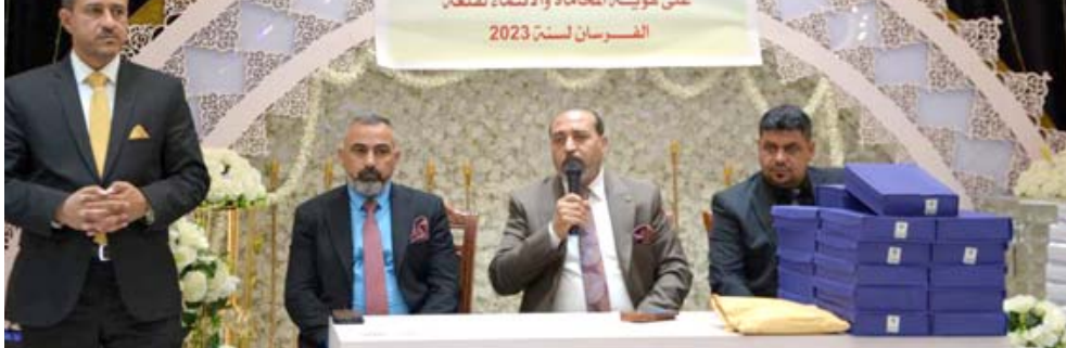
افتتاح : جلسة للاحتفاء بالحامين المتمن حديثاً الي النقابة