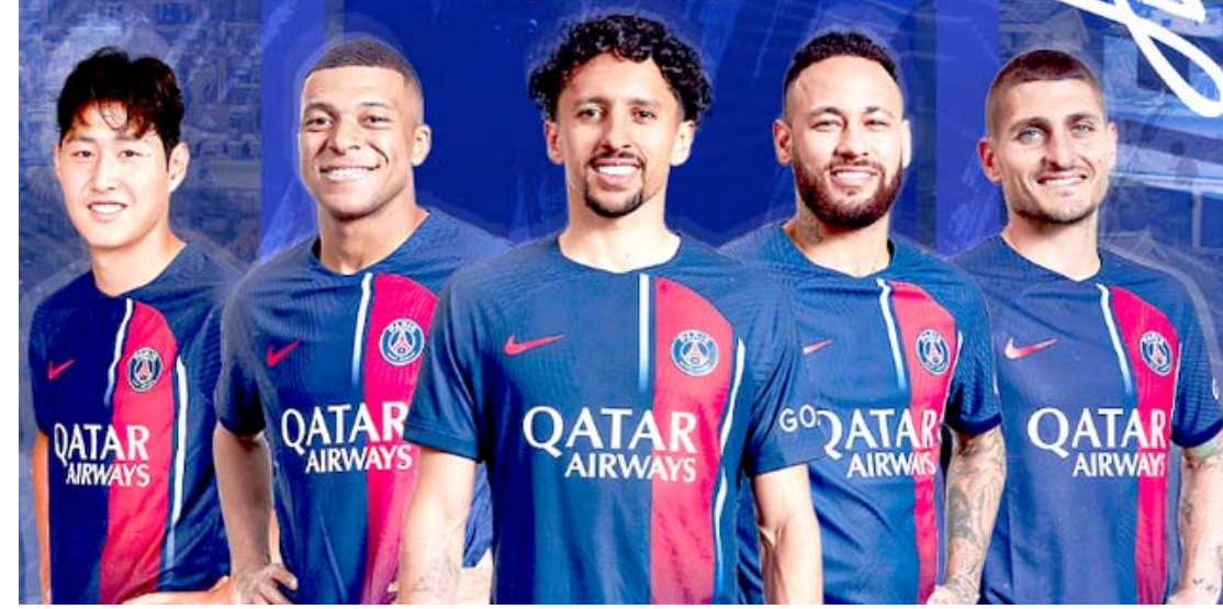
جولة : اعلان الترويجي لنادي باريس سان جيرمان لجولته في اسيا