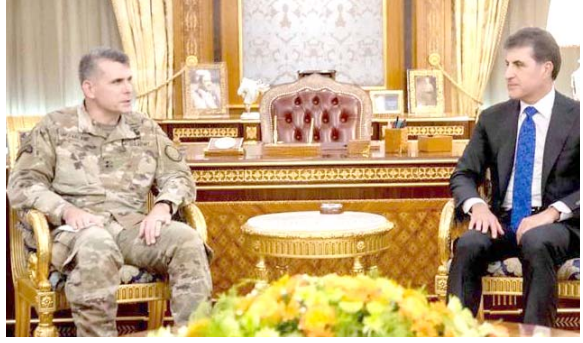
اربييل - فريد حسن

ناقش رئيس إقليم كردستان نجيب فرغان البارزاني، مع قائد التحالف الدولي في العراق وسوريا الجنرال ماثيو مكارلين، الإصلاحات في وزارة البيشمركة. وقال بيان تلقته (الزمان) أمس إن الجانبين بحثا خلال اللقاء عملية الإصلاحات في وزارة شؤون البيشمركة وتوحيد وإعادة تنظيم قوات البيشمركة والمشاكل والعقبات التي تعترض سير العملية وتبادل الآراء وجهات النظر بشأن سبل حل هذه المشاكل والتغلب على العقبات، واتفق الجانبان على العمل على توحيد وتنظيم قوات البيشمركة والإصلاح في وزارة شؤون البيشمركة لم تجر بالشكل المطلوب، ناقشا ملاحظات المصنفين بهذا الموضوع، وكان اجتماعاً مع وزير الجيوش الفرنسي سياسيان ليكورنو، وأكد أن زيارته رسالة مهمة تدل على استمرار دعم وصداقة