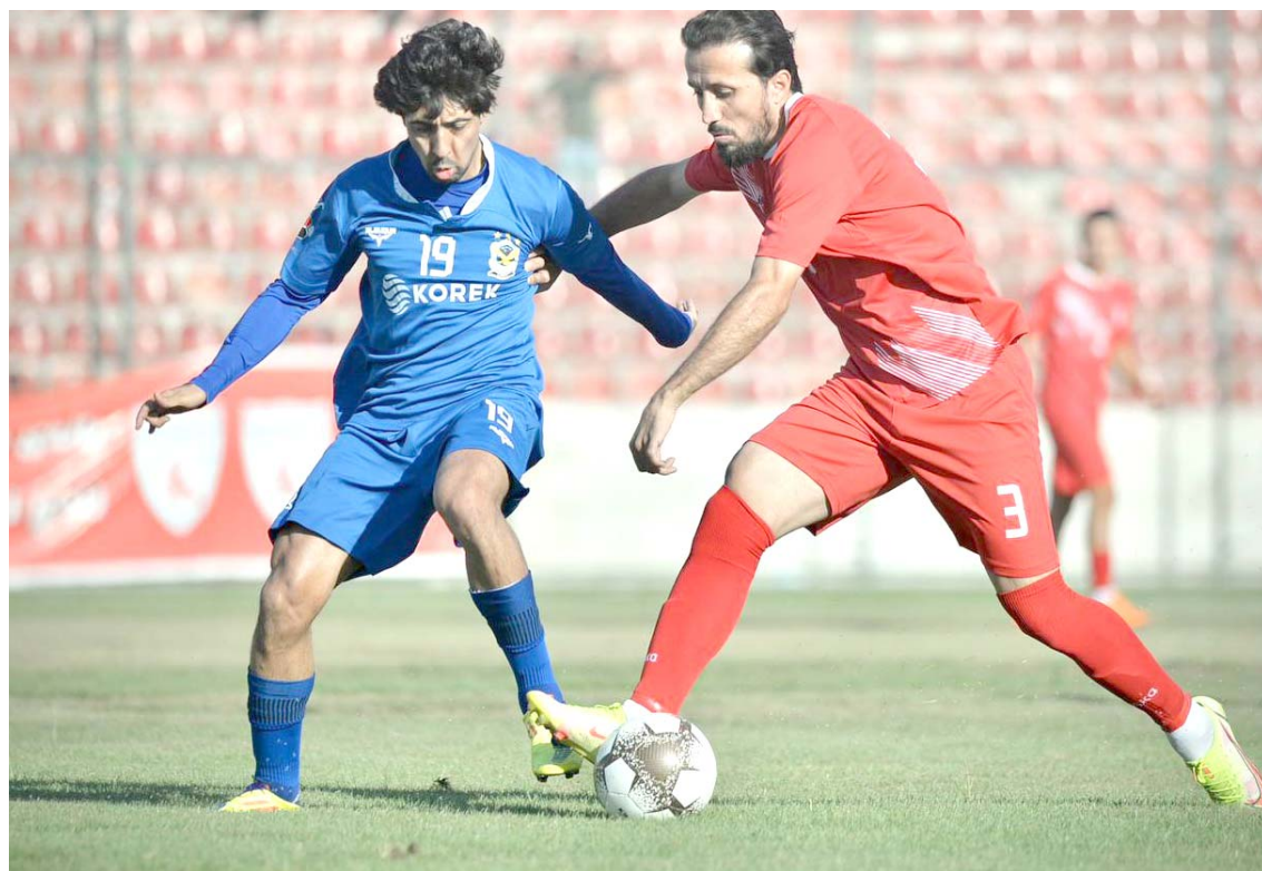
فوز فريق القوة الجوية يحقق الفوز على نوروز في الدوري الممتاز

ملعب الجيران بعداماتمن من تحقيق اكثر من نتيجة مهمة خارج الديار واختتمها بالفوز امس الاول وهذا يعني ان الفريق توازن كثيرا مع مرور الوقت بعد العودة الموسم الحالي لكن الادارة جانبية تعجز الوسط كشيئا بخسارة 2مواجهة واكثر الفرق تعادلا مرقوم بتمت من تحقيق الفوز 22الخمسة مرات واقل حتى من الصناعة الهابط فقط تقدم على الديوانية الذي حقق الفوز مرتين وعانى الوسط اكثر من المخوف لكن الحظ وقف معة في البقاء بمقدد بعد تقلص عدد الفرق الهابطة الى فريقين حيث الموقع الذي انهى به الموسم ولا يحتاج إلى تعليق والاهم ان تتعلم ادارة النادي الدرس بعد مشاركة مغلطة.