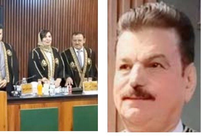
مناقشة: لجنة مناقشة اطروحة الدكتوراه