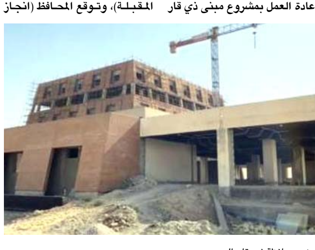
مبنى محافظة ذي قار الجديد

المشروع خلال ستة اشهر). واوعز الغزّي، الى قسم الهندسة في المحافظة (بإجراء الحلول الهندسية مستشفى سوق الشيوخ، لحين تنفيذ مستشفين جديدين في القضاء قيد الادرار احدهما يندرج على الاتفاقية الصينية والاخر ضمن مشاريع المحافظة). من جانب اخر، واصلت مكاتب الصيرفة في ذي قار، لليوم الثاني على التوالي اضرابها، وتجديد مطابقتها بحصر المحرك في الداخلي عن طريق منصة حكومية.