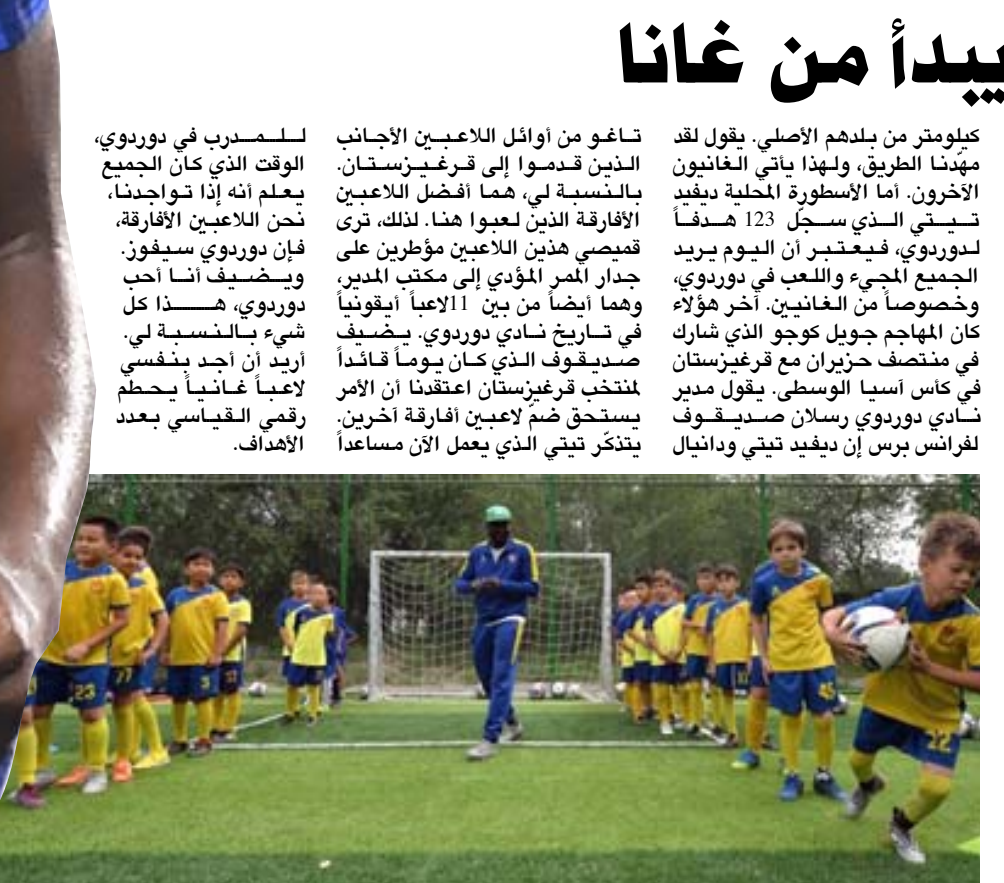
تدريب: موهوبون من قرغيزستان في وحدة تدريبية

برازيليا - وكالات: كشف باولو كاليفي نائب رئيس جريميو البرازيلي، حقيقة الأنباء المنتشرة حول احتمالية إعتزال الدولي الأوروغواي لويس سواريز بسبب إصابة في الركبة اليمنى يعاني منها منذ سنوات. وقال كاليفي في مؤتمر صحفي، ما يمكنني تأكيد هو أن ما يقال عن أن سواريز سقى للاجتماع مع إدارة جريميو لإبلاغها بأنه سيعتزل ليس صحيحاً على البرتو جيرا، وأضاف باولو كاليفي: جريميو عقد غداً مع لويس سواريز، ولا يمكن لأحد أن يتحدث عما سيحدث في المستقبل، ولعب سواريز أساسياً في مواجهة فريقه أمام أمريكا، أمس الخميس في الدوري البرازيلي، والتي انتصر فيها جريميو 1-0. وسجل اللاعب الأوروغواي أحد الأهداف الثلاثة، وذلك وسط شائعات حول احتمالية إعتزاله بسبب إصابة يركته. وكان رئيس جريميو، البرتو جيرا، قد كشف أن سواريز قد يضطر للخضوع لعملية زراعة طرف صناعي بسبب الإصابة التي يعاني منها في الركبة اليمنى. وأوضح جيرا في تعليقه مع مشجعي جريميو أن حالة سواريز خطيرة وقد تستلزم زراعة طرف صناعي في الركبة. وانتقل سواريز إلى جريميو مطلع العام الجاري وتلق كاند أفضل مهاجمي الفرق إذ سجل 14 هدفاً وسجل 8 في 26 مباراة. وكان اللاعب، الذي تألق سلفاً في أندية مثل أياكس ولينغبول وبرشلونة وأتلتيكو مدريد، قد وقع مع جريميو عقداً يستمر حتى كانون أول 2024.