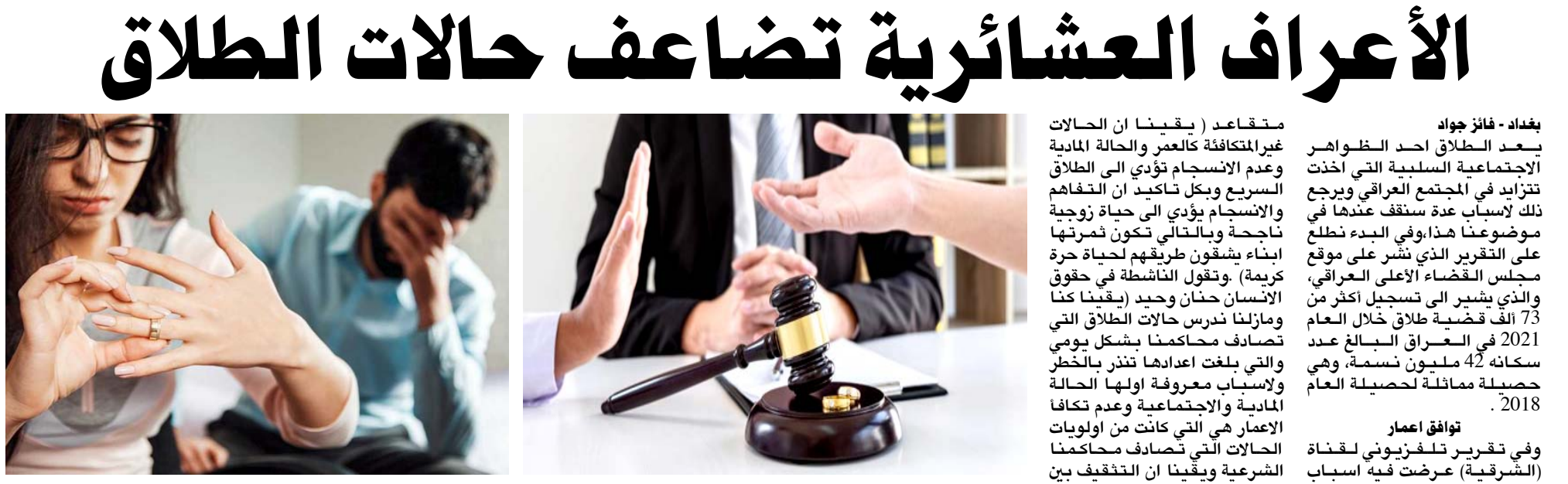
طلاق : المحاكم تُشرّح تزايد حالات الطلاق

وتزعج زوجها باهتماماتها المريضة، والزوج المسترجلة، التي تسعى في تفاعلها للسيطرة على زوجها، فتظهر عيوبه، وتتفقد كل عمل يقوم به. ولهذا احذري الكذب: كد واهتماماته. وكووني زميلة زوجك، وايضا كوني كريمة بمشاركة زوجك، ومشاعرك وعطائك، واعدي امك عن التدخل في حياتك الزوجية، وكوني صادقة دائماً واحذري ان تكوني: الزوجة المسترجلة: اي كشيخة الشكوى من سوء صحتها، والتي تبحث عن علاج لأمراض متوهمة،