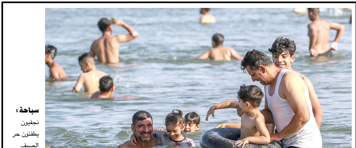
سباحة: يطفئون حر الصيف بالسباحة في نهر الكوفة

دول مجلس التعاون الخليجي الرئيس بايند إلى الشرق الأوسط العام الماضي، ويتم تحقيقها الآن بتيسير ودعم نشطين من الولايات المتحدة)، وتابع (نرحب بالدعم القطري الفعال ورئيس الوزراء وقادة آخرين في المنطقة للشعب العراقي كما نرحب بمشاركة رئيس إقليم كردستان نيجيرفان البارزاني في هذه المناقشات لزيادة تعزيز التنسيق بين بغداد واربيل). (تفاصيل ص. (2) على صعيد متصل، أكد السوداني، توقيع عقود مهمة من أجل استثمار الغاز الطبيعي والمصاحب. وقال خلال احتفالية الذكرى 63 لتأسيس أوبك المنعقدة في بغداد إن (العراق يعتمد منذ سنوات على النفط كمورد أساس للاقتصاد، وجرى إجمال الغاز الطبيعي والمصاحب، ما أبقينا الكثير من فرص التنمية، فضلاً عن التناثرات النفطية المرافقة للصناعة النفطية)، وأشار إلى (انه سيتم قريباً التوقيع على الجولة السادسة التي تستهدف رقماً مهمة لحقوق الغاز الطبيعي) بدوره، أكد وزير الكهرباء زياد فاضل، تحويل جميع المسالغ التي تستحقها إيران الخاصة بالغاز المورد إلى العراق.