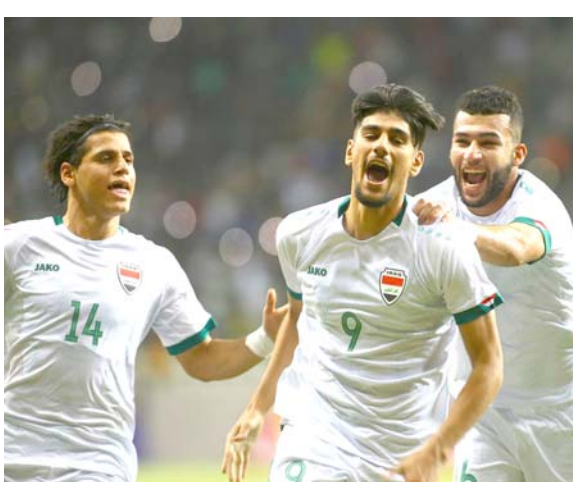
فوز: لاعبو الأولبي العراقي فزحون بتسجيل اهدافهم على الامارات

بلغ المنتخب الأولبي العراقي الدور نصف النهائي من بطولة غرب آسيا للمنتخبين الأولمبية دون 23 عاماً. بعد الفوز الكبير الذي تحقق على نظيره الإماراتي بثلاثة نظيفة في الجولة الثالثة والأخيرة في الجولة الثالثة والأخيرة العسرة والمعسرة العامة في داعش). إلى ذلك، أبلغ وزير الداخلية عبد الأمير الشمري، المحاكم بطرد أي ضابط شرطة تشتت إدانته بجريمة الرشا وأشار بيان أمس إلى ان (الشمري شارك في المحاضرة التوعوية التي نظمتها الدائرة القانونية في مقر الوزارة، التي القاها رئيس محكمة تمييز قوى الأمن الداخلي، لزيادة الثقافة القانونية لجميع العاملين مع الداخلية وكيفية التعامل مع المواد القانونية والحقوق الواجبات)، وجدد الشمري (سعيه في ملاحقة أي مرتش وسارق في الوزارة). مؤكداً انه (أبلغ المحاكم بطرد أي ضابط شرطة تشتت إدانته بجريمة الرشا، وإن الوزارة قادرة على النهوض بعملها من دون هؤلاء المرتشين الفاسدين لأن بقاعهم مضر بالعمل الأمني).