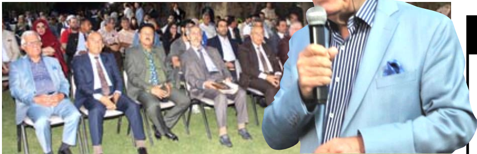
مهرجان : لقطات من مهرجان جيهان الأول للثقافة والفنون