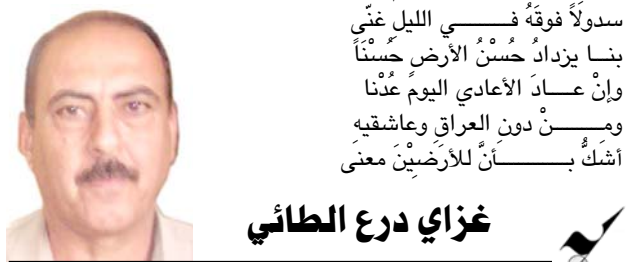
غزاي درع الطائي

وَقَعْنَا وَاَقْفِينِ وَمَا سَقَطْنَا أَلَا فَلْتَسَالُوا الْأَشْرَارَ عَنَّا إِذَا قَلَبْتُمْ لَنَا الْأَيَّامَ أَعْرَابًا قَلْبًا ظَاهِرَ الْأَيَّامِ ظَنًّا لِتَاتِ الْعَادِيَاتُ مَتَى أَرَادَتْ فَأَنَّا لَمَّا لَقِيمُ لِهِنَّ رَوْثًا فَوَاحِدُنَا إِذَا مَا لِهْمُ أَرَى سَدُولًا فَوْقَهُ فَيَسِي اللَّيْلِ غَنِي بِنَا يَزْدَادُ حَسْنَ الْأَرْضِ حَسْنَا وَأَنْ عَادَ الْأَعَادِي الْيَوْمَ عَدَا وَمِمَّنْ دُونَ الْعِرَاقِ وَعَاشِقِيهِ أَشَكُّ بِسَانٍ لِلْأَرْضِيْنَ مَعْنَى