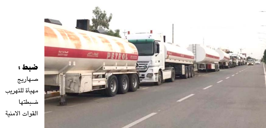
ضبط : صهاريج مهيئة للتهريب ضبطتها القوات الامنية

اسلاك نحاس و محضرات سمنت، فضلاً عن ذرة صفراء و اثنائية مختلفة و هياكل حديد ، ومشروبات تاكس، الى الجهات المختصة لاتخاذ الاجراءات اللازمة). على صعيد متصل، كشفت هيئة المنافذ الحدودية، عن ضبط 1417 مخالفة خلال شهر ايار الماضي. وذكر بيان تلحقته (الزمان) امس ان (مديرية) المنافذ تمكنت خلال المدة المذكورة من ضبط مخالفات الدعوى الكمركية الحالية من قبل الهيئة الى القضاء بلغت 294 دعوى متضمنة تغيير وصف البضاعة و تهريب عجلات وتزوير و فرق رسم و معاملات غير مكتملة قانونياً). وتابع ان (عدد المخالفات المضبوطة بلغت 79 مخالفة، فضلاً عن القبض على 15 متهماً من المطلوبين للقضاء، وإحباط 12 محاولة لتهريب الاصول، والبواد الخدرة). مؤكداً (إحباط 31 محاولة