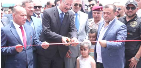
افتتاح : وزير النفط مفتتحا مشروع جسر الزبير

افتتح نائب رئيس الوزراء لشؤون الطاقة وزير النفط حيان عبد الغني مشروع جسر الزبير الجديد في محافظة البصرة ونقل المكتب الاعلامي لوزارة النفط عن عبد الغني قوله خلال حفل الافتتاح الذي حضره محافظ البصرة اسعد العميداني ومسؤولون في المحافظة. ان (مشروع جسر الزبير الجديد) الذي تنفذها وزارة النفط للتخفيف من معاناة ابناء محافظة البصرة، مشيراً الى انه (يعد من المشاريع الحيوية في المحافظة ويسهم بحل الإختناقات المرورية، ويربط مركز المدينة بقضاء الزبير والمناطق الصناعية والنقلية).