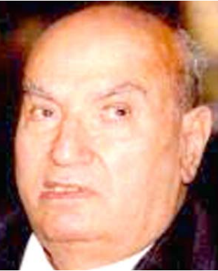
عبد الرحمن بدوي