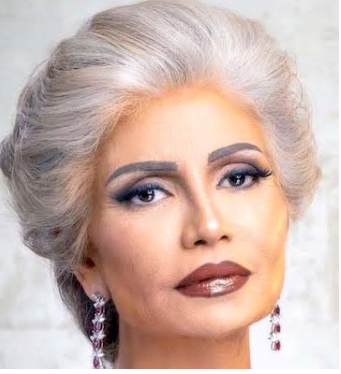
سوسن بدر باطلة جديدة

القاهرة - الزمان فاجأت الفنانة الكبيرة سوسن بدر متابعيها من خلال أحدث ظهور لها، حيث ظهرت باطلة شبابية وبشكل جديد، متخلية عن الشعر الأبيض القصير، الذي اعتاد أن يشاهدها جمهورها به منذ سنوات ونشرت بدر مقطع فيديو عبر حسابها بإنستغرام ظهرت خلاله باطلة شبابية مميزة إذ ارتدت باروكة باللون البني والتي غيرت ملامحها تماماً، مما أثار تفاعل كبيراً من معجبيها ومتابعيها وعلقت على مقطع الفيديو الذي نشرته قائلة بأن ارتداء الباروكة، السبب في تغير ملامحها، وكتبت: البواركة خطيرة... شعر طبيعي تحفة، وكانت بدر قد شاركت في موسم دراما رمضان الماضي بمسلسل بابا الجبال أمام الفنان مصطفى شعبان، رياض الخولي، باسم سمرة وجومانا مراد، وجاء المسلسل من تأليف محمد الشواف، ومن إخراج أحمد خالد موسى، كما شاركت أيضاً خلال موسم عيد الفطر بالفيلم السينمائي ساعة إجابة والذي جاء من بطولة الطفل سليم مصطفى والذي كان حقق نجاحاً كبيراً من خلال مسلسل له لا، ويشاركه في بطولة الفيلم عدد كبير من الفنانين منهم غادة عادل، شريف سلامة، آيتن عامر، نجلاء بدر، انتصار، محمد ثروت، بدرية طلبة، فيدرا، فراس سعيد، أحمد فتحي، أحمد طلعت، لطيفة فهيم، مجدي البحيري.