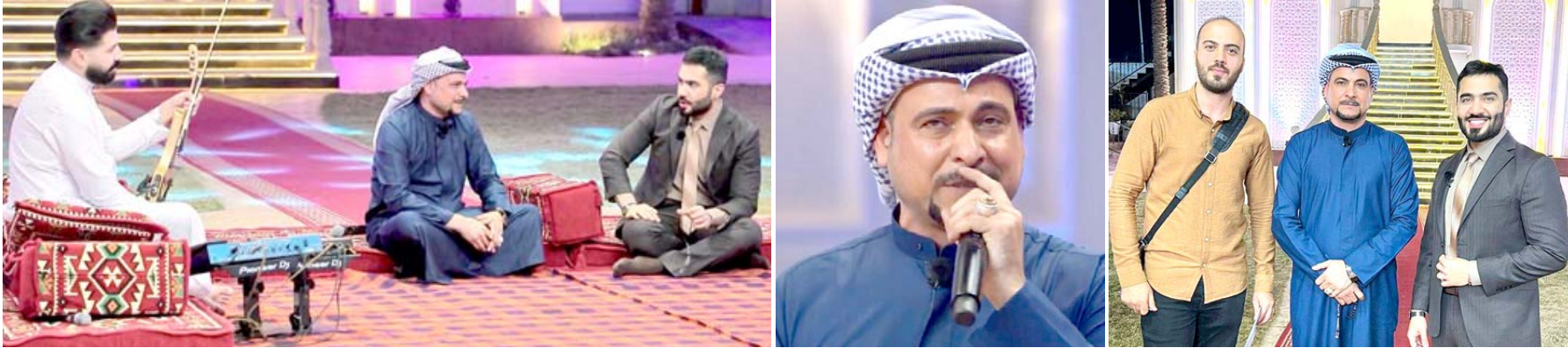
برنامج : لقطات من حلقة برنامج (كلام الناس) عن فرقة الجوبي الدليمية.