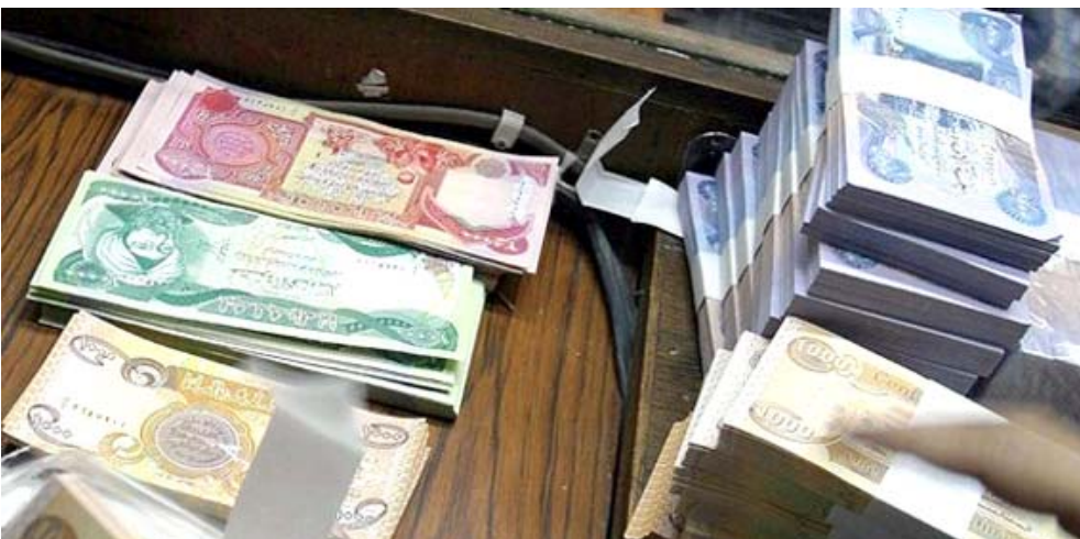
قروض : الرافدين يعلن ضوابط جديدة لمنح القروض

والزراعي والنهريين الإسلامي مضاعفة جهود عمل الجبان الفرعية، عبر الزام وحدات الاتفاق ضمن السكينة، بغائدة 5 بالملئة، وبمدة تسديد 10 سنوات وبضمانة كليل موظف مدني موطن راتبه على المصرف، فضلاً عن رهن العقار المطلوب ترميمه او بناؤه و حالات الاتفاق خارج الضوابط ، المالية، وطيف سامي، على اهمية مواضعه جهور عمل الجبان الفرعية، بيان اسس ان (سامي اوعزت بحزمة من التدابير والاجراءات التي تعمل عليها الوزارة، للسيطرة على حركة الحسابات المالية لتشمل مختلف القطاعات، والوقوف على دقة البيانات المالية، والتوجه نحو تحديث الحسابات التحويلية نحو الحساب الاستئماني والحساب التشغيلي (الجاري)، وتابع ان النظام سيسهم في تحسين جودة البيانات المالية للمصارف.