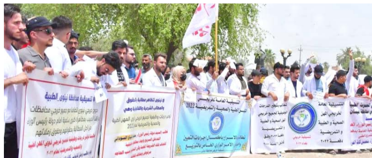
تظاهرة : خريجو المهن الطبية في تطاهرة للمطالبة بالتعيين

بوضع البنية لهذا المشكلة، ولا سيما ان الالف من الخريجين ما زالوا ينتظرون فرصة العمل في هذه المؤسسات. واطلق وزير العمل والشؤون الاجتماعية أحمد الاسدي، دفعة 35 من القروض الميسرة لخمسة آلاف من الباحثين عن العمل المسجلين ضمن قاعدة بيانات الوزارة. وقال الاسدي في بيان تلقته الزمان امس ان (الدفعة) من الالف هذه دفعة تأتي تنفيذاً لمناهج البرنامج الحكومي المتضمن دعم شريحة الشباب الباحثين عن العمل، من أجل إنشاء مشاريعهم للمرة للدخل، واكد ان (هذه القروض تمنح من دون اي فوائد مالية)، وعا