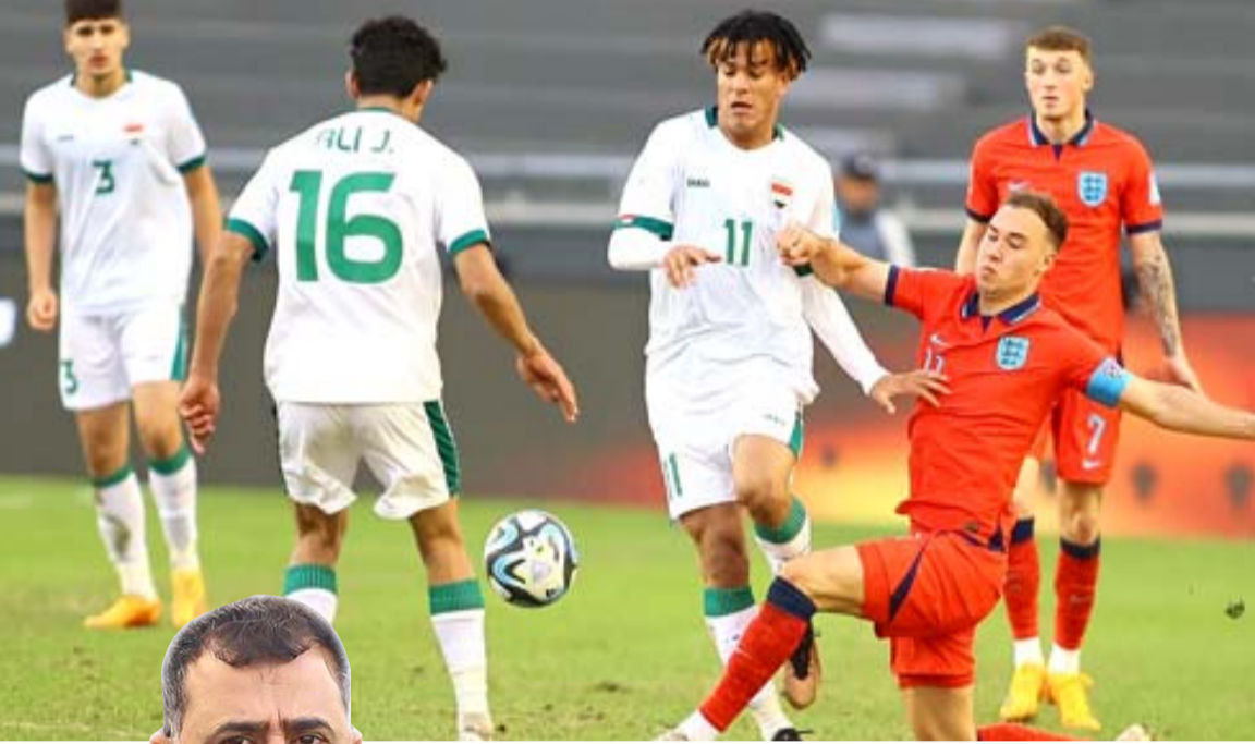
وداعاً ليوت الرافدين يودعون كأس العالم للشباب بنقطة واحدة

بفوزين وخمسة تعادلات من دون خسارة قبل رفع رصيده إلى 32 وعزز موقته ووسع الفارق مع النقط إلى خمس نقاط أمام مهمة تحقيق البقاء فيما استمر الضيف في مكانه السابع مؤقتاً أمام معاناة مباريات الشباب والتعويل على مواجهتها معسكر ت.عقر الدار.