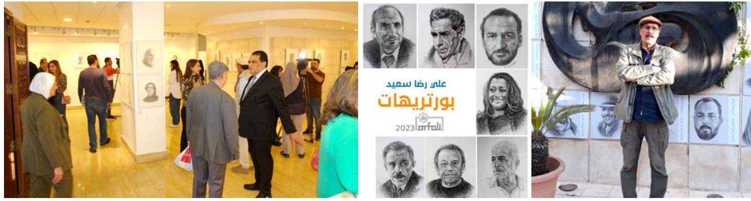
معرض: لقطات من معرض (بورتريهات) لعلي رضا سعيد

هياكل الشكل والتعامل معها كل على حدة يجمعهم الاحساس المهرف والخطوط الرئيسية التي تتسج شكل البورتريه في حوان صامت متوهج بالفن والمحبة والعطاء (المشرق). مبادرة جميلة وراقية لو فخرت وزارة الثقافة بتقديم دعوة اشيقة للفنان التشكيلي المغرب الدكتور علي رضا سعيد لإقامة معرضه في بغداد لما فيه من خصوصية نادرة وهو يجسد برسوماته الرائعة رموز الحركة الفكرية والفنية التي لها بصمات مميزة في تاريخ العراق المعاصر، وينفس الاحترام وتقدير الفنان السذي من خلاله تجسد الوزارة تقديرها للفن العراقي والفنانين الذاتيين بالخطوط والانوار والاحاسيس وكذلك أوجه النداء لجمعية الفنانين العراقيين وبعض قاعات العرض للفن التشكيلي.