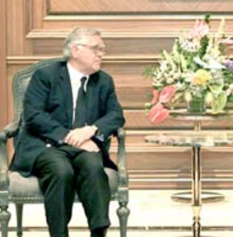
لقاء: رئيس حكومة اقليم كردستان يستقبل رئيس بلدية ناشفيل الأمريكية

وقال بيان تلقته (الزمان) امس ان البارزاني استقبل في اربيل، رئيس بلدية ناشفيل جون كوبر ووفد المرافق له الذي يضم عدداً من أعضاء مجلس المدينة، ورئيس واعضاء مجلس المدن الخواتم لناشيفل، وشهد الاجتماع التباحث