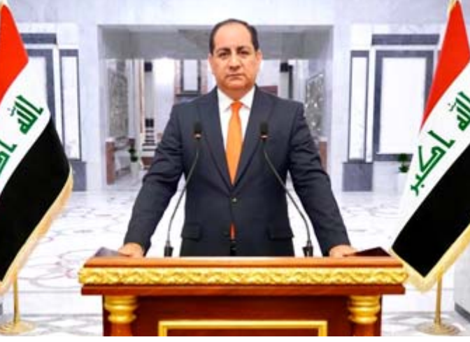
مؤتمر: المتحدث باسم مجلس الوزراء يعلن قرارات المجلس خلال مؤتمر صحفي

وقال بيان تلقته (الزمان) امس ان مجلس الوزراء عقد جلسة برئاسة محمد شياع السوداني، ناقش خلالها تطورات الأوضاع والشؤون العاصمة في البلاد، واستعراض ومتابعة تنفيذ القرارات التي تخص عدداً من الملفات والقضايا، ومتابعة تنفيذ اولويات البرنامج الحكومي، وكذلك التداول في الموضوعات المدرجة على جدول الأعمال.