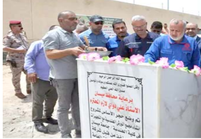
حجر: محافظ ميسان يضع حجر الاساس للاقسام العلمية لجامعة ميسان

مايتعلق بالمدارس والاسماء العلمية في جامعتي ميسان والتقنية، بما يخدم هبة سبل نجاح العمل ودعم أبناء المحافظة، والإبقاء بالمستوى العلمي عبر توفير مسلمات العلية التربوية والتعليمية، وبحث لجنة الترقية النيابية، في البرلمان، عدداً من الملفات التربوية، اهمها دورة الاسرافل التربوي وانشاءات لول المتقدمين من قبل المرشحين للاسرافل التربوي، والمشاركين في اختبار دورة التحدي والابداع.