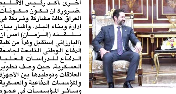
لقاء : قياد الطالباني خلال لقائه رئيس حكومة الاقليم

بمصف صلاح الدين باربريل (ضرورة ان تكون مكونات الادارة وبناء البلد. وأشار الى (البارزاني استقبل وفدا من كلية الدفاع الوطني التابعة لجامعة الدفاع للدراسات العليا العسكرية. حيث وصف تطوير العلاقات وتوطيدها بين الأجهزة والمؤسسات الدفاعية والعسكرية وسائر المؤسسات في عموم العراق. بما فيها التي في كردستان بالمهم. ورأى ان صياغة مناهج وبرامج الدراسة في الجامعة وكلياتها وأقسامها على الأسس الوطنية والعلمية ضروري وإيجابي). مشددا على أنه (بعد مرور عشرين سنة على تحرير العراق، يجب اتخاذ خطوات أفضل باتجاه المستقبل بالاستفادة من أخطاء الماضي ووقف رؤيته ومنهجا واضحا مشترك وجامعا. وأن تكون مكونات العراق كافة مشاركة وشريكة في إدارة وبناء البلد).