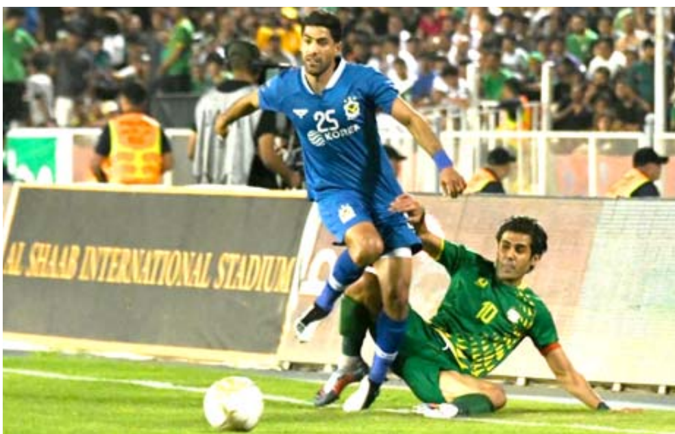
مواجهة : إحدى مواجهات الدوري الممتاز بكرة القدم بعسدة - حسن الرسومي

منها من فرض السيطرة والابتعاد بها ولو أن تجدد واستمرار وارتقاء الصراع يصب في مصلحة المسابقة كونه يحظى بشغف جماهيري متتابعة مباريات الفرق المذكورة وبرغبة في سباق محموم قد يمنح الصدارة إلى فريق آخر نهاية الأسبوع الجاري بعدما فرصت عليها تباين النتائج لتبقى حاضرة بين الفرق المذكورة التي يتوجب على أي منهما خوض مبارياتها القادمة بجميع الضمانات وأن تظهر على ما هي عليه والعب بروح خاصة وفي كل الأحوال الأمر ليس سهلاً بوجه الكل في ظل تباين وانعدام ثبات المستويات وتفاوتها من الجولة وأخرى دون أن تحتافظ على نوعية الأداء أمام مهمة البحث عن مبتغاهما لإقناع جماهيرها المكشيرة بقدراتها على مواصلة المنافسة كما يجب كما شهدت مواجهة الشرطة والجوية الصراع الحذر والتواجد الجماهيري إضافة إلى الحضور الكبير والمميز لأنصار الزوراء الذين وجهوا انتقادات للمدرب واللاعبين بسبب التأخر مرتين متتاليتين أمام النجف والوسط وندارتهم بصعوبة والأمر إهدار أربع نقاط قبل أن تحسم تعادل المتحصر والوصيف ليجافظ على فارق النقاط 52 وسبقوه بسفرة قصيرة لكنها محققة بالمخاطر إلى كربلاء لمواجهة القاسم والحال للشرطة 55 الذي سيواجه اختباراً غير سهلاً وسيكون مطالب بتقديم أفضل ما لدى اللاعبين لتعزيز الموقف عندما يحل ضيفاً على نقاط البصرة الباحث عن استعادة توازنه ويأمل أن يأتي عبر بوابة البطل فيما تبدو الفرصة متاحة للجوية لكنها غير مضمونة وقد تكون معقدة عندما يضيف المتذلل الديوانية الذي أزعج الطلاب السبت في مهمة تتطلب من لاعبي الجوية تجاوز آخر جولتين والعودة لسكة الانتصارات في مواجهة تحتاج إلى تنظيم الخطوط والعب بتركيز بحثاً عن استعادة الصدارة مرة أخرى.