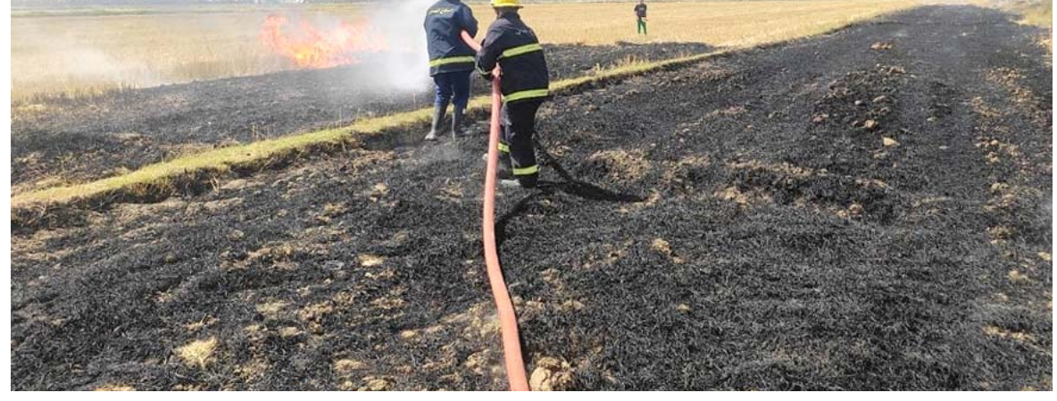
إخماد : فرق الدفاع المدني تخمد حريقا في حقل الحنطة في الديوانية

العراق) ، وأعطوا عن قلقهم من استمرار الحرائق التي تزداد بشكل معتبره ممنهج لاستهداف الأمن الغذائي للمواطن، وشدوا على ضرورة ان تتخذ الحكومة إجراءات رادعة بحق كل من يحاول تهديد رغيف الخبز، فيما جددت فرق الإطفاء استعداداتها للتصدي للحرائق وتأمين موسم الحصاد. وقال امس ان (الزّمان) امس ان (تكرار حرائق المحاصيل الزراعية تزامناً مع موسم الحصاد ، هو فعل متعمد من قبل جهات لا تريد الخير للملاد . وتحاول حرمان المواطن من رغيف الخبز). وأشاروا الى ان (هذه الحوادث تتجدد سنوياً وتسجل ضد مجاهدين ، وعلى الجهات المعنية معرفة من يحاول تهديد الأمن الغذائي للعراق). وأعربوا عن قلقهم من استمرار الحرائق دون اتخاذ إجراءات حقيقية تضمن للفلاحين والمزارعين حماية محاصيلهم التي انفقوا عليها الملايين ) . وتمكنت فرق الإطفاء في محافظة الديوانية من إخماد حريق نشب داخل حقل محصول الحنطة في منطقة الحاوي. وقال بيان تلقته (الزّمان) امس ان (الإطفاء نجح في إخماد حريق حقل حقول الحنطة في منطقة الحاوي). وأضاف ان (فرق الدفاع المدني في محافظة بابل ، أخمدت حريق مائل داخل حقل للمحاصيل في منطقة الصياحية ، دون تسجيل إصابات بشرية). وفي ديالى ، وضعت الحكومة الخطة استباقية لحماية محاصيل الحنطة والشعير من الحرائق في فصل الصيف. وقال الناطق الرسمي باسم المحافظة ياسر