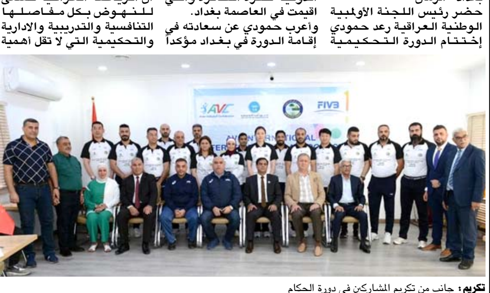
تكريم : جانب من تكريم المشاركين في دورة الحكام

بغداد- الزمان حضر رئيس اللجنة الاولمبية الوطنية العراقية رعد حمودي إختتام الدورة التحكيمية الدولية لكرة الطائرة والتي اقيمت في العاصمة بغداد. وأرعب حمودي عن سعادته في إقامة الدورة في بغداد مؤكداً