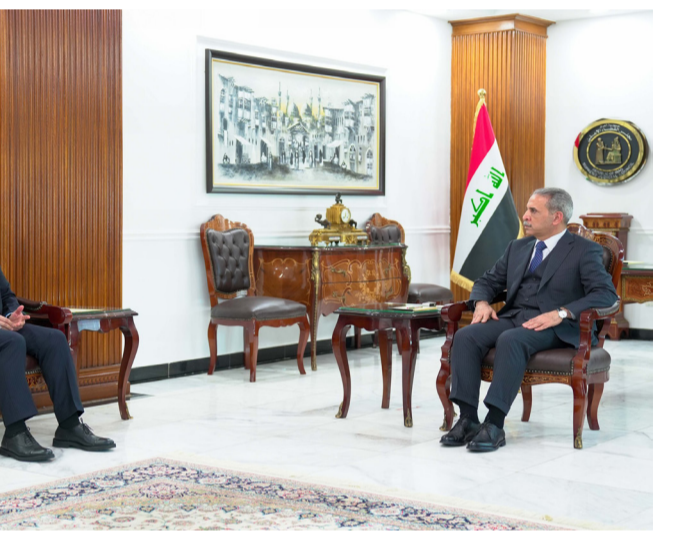
استقبال: رئيس مجلس القضاء، يستقبل مستشار الأمن القومي

بغداد - الزمان بحث رئيس مجلس القضاء الأعلى فائق زيدان، مع مستشار الأمن القومي قاسم الأعرجي، عدداً من القضايا الخاصة بالأمن الوطني والإجراءات القضائية المتخذة بشأنها. وقال بيان تلقته (الزمان) ان (زيدان استقبل في مكتبه الأعرجي، وبحثا القضايا التي تخص الأمن الوطني والإجراءات القضائية المتخذة بصدها)، واقتادت هيئة أسس النظام الديمقراطي في العراق وحماية النزاهة العامة. بحضور امر استخدام بحق المدير العام للهيئة العامة للكمارك سابقاً، لارتكابه عمداً ما يخالف واجبات وتلغيفته. وأشار بيان تلقته (الزمان) أمس ان (محكمة تحقيق الرصافة المختصة بالنظر في قضايا النزاهة وغسل الأموال والجريمة الاقتصادية قُرت استخدام المدير العام للهيئة العامة للكمارك سابقاً)، وأضاف ان (المتهم قام بمخالفة الضوابط والتعليمات وسمح بإيدخال كميات من مادة السمنت، دون فرض الرسوم والتعرفة المقررة)، مؤكداً ان (المتهم تسبب بحادث هدر في المال العام)، وتابع ان (محكمة تحقيق الرصافة، اصدرت قران