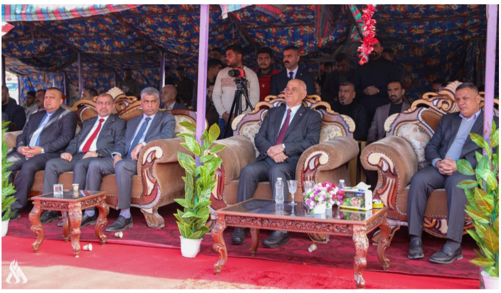
افتتاح وزير الموارد المائية يفتتح مشروع تبطين قناة مهروت

والجنوب، وتشغيلها على الطاقة الشمسية، مبيئا ان (استخدام الطاقة النظيفة يحتاج الى تمويل مستمر لرفع عدد المنظومات، وتابع ان (الخطط الجارية تدعم التكيف مع التغيرات المناخية، بالتعاون مع مديريات الزراعة لإحياء الأحزمة الخضراء، في ذي قار والديوانية والمثنى، لمواجهة العواصف الترابية).