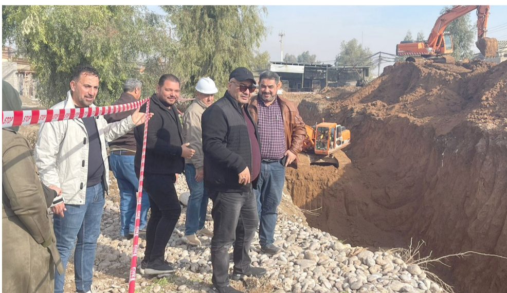
تفقد أمين بغداد يتفقد مشروع الجسرات

مشروع جسر وأوضح بيان أمس ان (المشروع بشيد على ارض تقدر مساحتها بـ 110 دونم)، مشيراً الى انه (ثاني أكبر مشروع ماء في البلاد بعد مشروع ماء البصرة، حيث بسد حاجة 800 ألف نسمة من المياه في الكوفة والنجف، التزاماً مع توقعات الزيادة السكانية في السنوات المقبلة)، واستمرت الوزارة بأعمال مشروع إنشاء جسر شمال تكريت، وقال البيان ان (الملاكات أنجزت نحو 80 بالمئة من أعمال مشروع الجسر شمال المحافظة، عملت كلي مع المقربين بلغ 1,040 متراً، بواقع 840 متراً للجسر، و100 متر لكل متر)، مضيفاً ان (عرض الجسر بلغ 22 متراً)، وبين ان (المشروع يعد مهماً، كونه يربط صالح الدين مع المحافظات الشمالية والوسطى والغربية، فضلاً عن أهميته في تنشيط حركة النقل والتجارة بين المحافظة والمحافظات الأخرى).