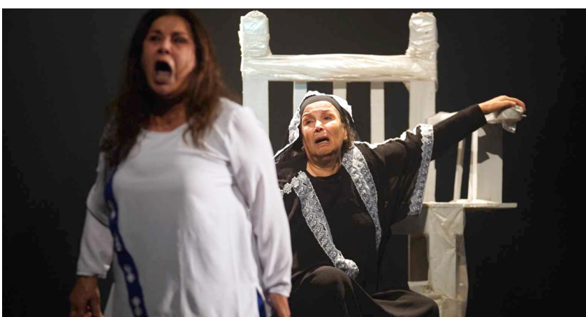
مسرحية: لقطات من مسرحية (جنون الحمام) عسفة، حيدر حبة