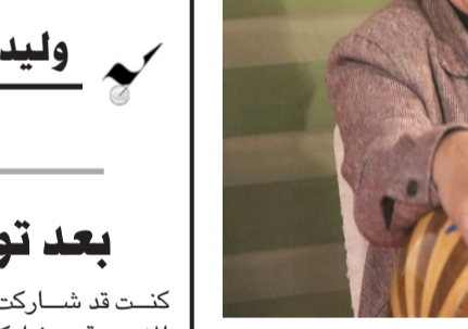
أسمية للخفاف في سامراء

وشهدت الأمسية حضور جماهيري كبير من محبي الطرب العراقي الأصلي، بالتعاون مع مؤسسة الحفري للتسمية والثقافة الجعمية الأمسية حل فيها الموسيقار جعفر الخفاف صيفاً على إسهام سامراء، قدم فيها أجمل أعمال مسيرته الفنية. وشهدت الأمسية حضور جماهيري كبير من محبي الطرب العراقي الأصلي، بالتعاون مع مؤسسة الحفري للتسمية والثقافة الجعمية الأمسية حل فيها الموسيقار جعفر الخفاف صيفاً على إسهام سامراء، قدم فيها أجمل أعمال مسيرته الفنية.