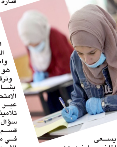
يسعى لتاخير اینه عن

الموصل - سامر الياس سعيد اعلنت العوائل العراقية استنفارا كبيرا مع قرب انطلاق امتحانات نصف السنة للعام الدراسي الحالي حيث من المؤمل ان تنطلق الامتحانات التحريرية للسفوف الخاصة بالمراسل الابتدائية والمتوسطة والاعدادية عن قريب وقال اهالي وتربويون ان الاوساط الربوية تعيى انذارا من خلال استعداداتها لاستقبال الامتحانات الصفوية التي تسهم باختتام الفصل الاول