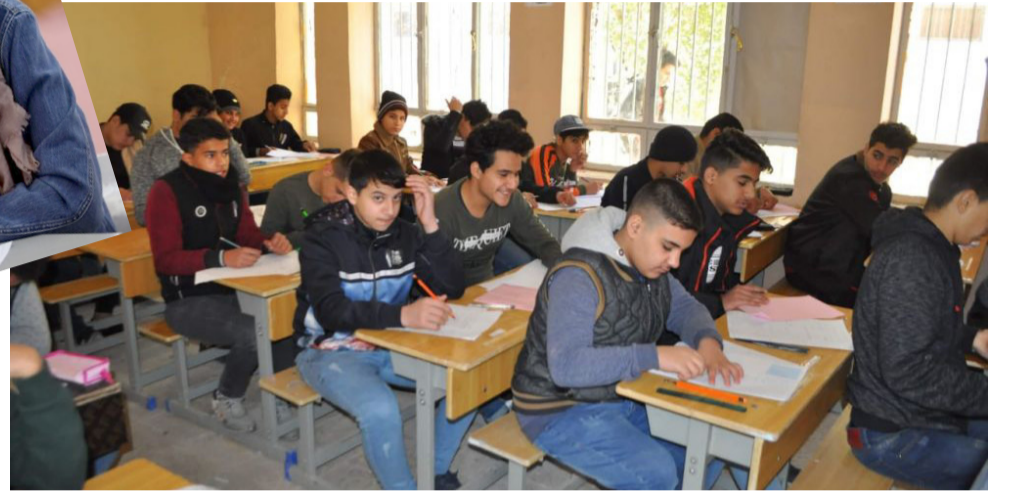
امتحانات تلاميذ يؤدون امتحانات نصف السنة

الالتحان بتوقيت الدوام وهناك من يدعون كمعلمين وادارات بان تكون واسعي الصدر والتفهم ازاء تلك الحالات التي تكشف نوعا من التحدي للعوائل