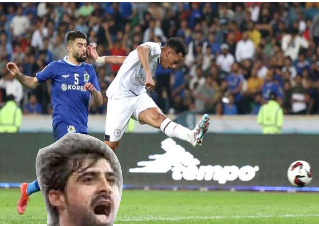
مباراة: جانب من مباراة القوة الجوية مع الشباب السعودي في مواجهة الأياب

واصل فريق الشباب السعودي مع الشباب السعودي في مواجهة الأياب... (The text continues with details of the match and the tournament, mentioning the 6 teams that qualified for the quarter-finals.)