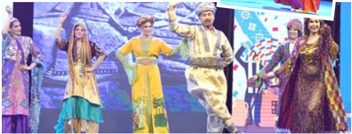
أزياء - الزمان

شاركت الدار العراقية للأزياء في جانب فرقة محلية ودولية أخرى في ختام مهرجان التراث السرياني بدعوة من المديرية العامة للثقافة والفنون والسريانية والذي أقيم بمنطقة دركا في أربيل للفترة من 13-11 نيسان الحالي. وعكست الدار بعرضها الفنون الثقافية لحضارات العراق مع توثق الأزياء بأسلوب حديث.