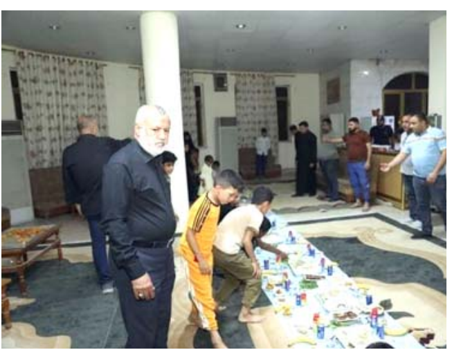
إفطار : مأدبة إفطار في ميسان