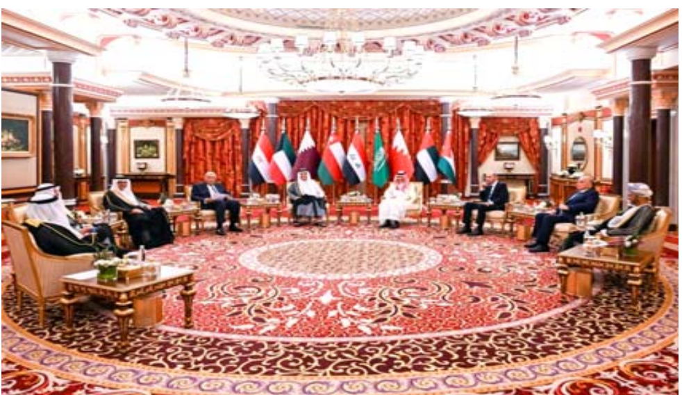
إجتماع وزراء خارجية دول الخليج في إجتماع جدة

على إبعادها، وذلك في خضمّ تحركات دبلوماسية إقليمية بتخبر معها الشهد السياسي في المنطقة منذ اتفاق الرياض وطهران على استئناف علاقاتهما الشهر الماضي. وكانت دول عربية عدة على رأسها السعودية اقتصدت سفاراتها وسحبت سفراها من سوريا، احتجاجاً على قمع النظام السوري في العام 2011 الانتفاضة الشعبية التي تطورت إلى نزاع دام دعمت خلاله السعودية وغيرها من الدول العربية فصائل المعارضة السورية وعملت جامعة الدول العربية عضوية سوريا لديها في تشرين الثاني 2011. لكن خلال السننتين الماضيتين تقاتل مؤثرات التقارب بين دمشق وعواصم عدة، بينها أبوظبي التي أعادت علاقاتها الدبلوماسية، والرياض التي اجرت محادثات مع دمشق حول استئناف الخدمات القنصلية بين البلدين. وانعقد اجتماع دول مجلس التعاون الخليجي في جدة وشارك فيه أيضاً مصر والعراق والأردن للبحث في مسألة عودة سوريا إلى الجامعة العربية، قبل نحو شهر من انعقاد قمة عربية في السعودية ولم يفضح المسؤولون السعوديون عن أي معلومات تتعلق بالإجماع باستثناء وصول وزراء خارجية وممثلي الدول المشاركة الواحد تلو الآخر إلى جدة على البحر الأحمر. ونشرت قناة الإخبارية الحكومية لقطات مصورة من الاجتماع واستقبلت السعودية الزعماء ووزير الخارجية السوري فيصل المقداد للمرة الأولى منذ بداية النزاع في بلده. في الوقت ذاته، كان وفد إيراني موجوداً أيضاً في المملكة للتحضير لإعادة فتح البعثات