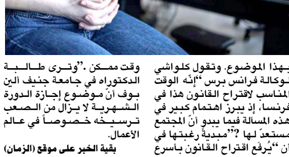
بقية الخبر على موقع (الزمن)

المتنافس على سعفته الذهبية من 16 ايار/مايو المقبل إلى السابع والعشرين منه. ويتولى مدير المهرجان تيبيري فريمو صباح الخميس الإعلان في إحدى دور