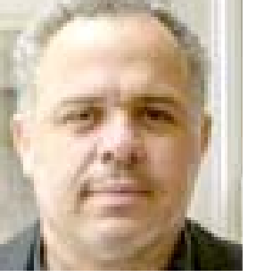
بقية الخبر على موقع (الزمن)

عالق في عاصفة تسبب بها بنفسه، وليس هذا الرسم أكثر عمل له ينطوي على طابع كبرى من بينها (تايم) و(دير شبيغل). ونُشر رسم رودريغيز المخصص لغلاف مجلة "تايم" قبل صدورها الجمعة المقبل في الولايات المتحدة، وهو عبارة عن بصفة اصعب كبيرة على خلفية سواد، تبدو وكأنها تنور كعصا حول فم الممارير الجمهوري، ومن الاستوديو الخاص به في الطبقة العلوية من منزله الواقع في إحدى مناطق نيو جيرسي الريفية، يصف رودريغيز دونالد ترامب، بأنه