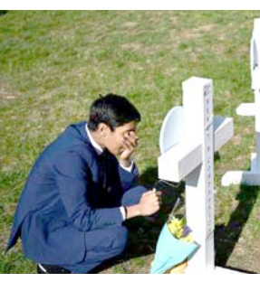
بقية الخبر على موقع (الزمن)

في حديث إلى شبكة (إن بي سي) في التحمين لم يكن يهدف إلى إثارة الخوف في نفوس التلاميذ أو جعلهم يفكرون بانهم