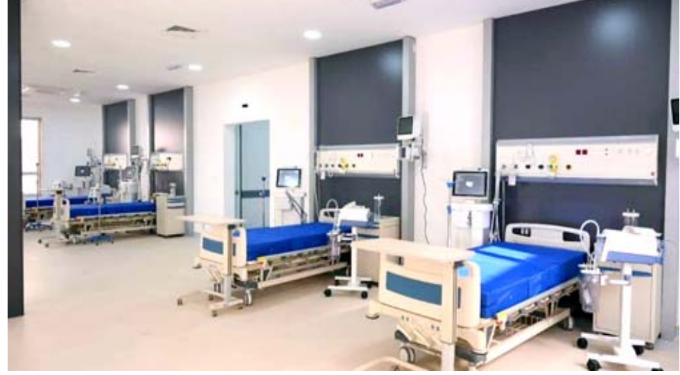
مستشفى: أعمال تاهيل وصيانة مستشفيات في بغداد الرصافة تصل مراحلها النهائية