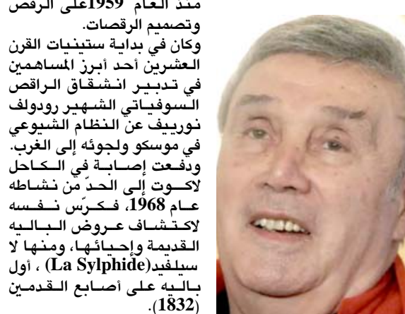
باريس (ا ف ب) -توفي مصمم الرقصات الفرنسي بيار لوكوت عن 91 عاماً، وفق تأكيدات لوكالة فرانس برس من الراقصة النجمة غيلان تيسمار، زوجة الراحل الذي اشتهر بإعادة تصميم عروض باليه من القرن التاسع عشر لأكثر الفرق في العالم.

باريس (ا ف ب) -توفي مصمم الرقصات الفرنسي بيار لوكوت عن 91 عاماً، وفق تأكيدات لوكالة فرانس برس من الراقصة النجمة غيلان تيسمار، زوجة الراحل الذي اشتهر بإعادة تصميم عروض باليه من القرن التاسع عشر لأكثر الفرق في العالم. واوضحت تيسمار أن لوكوت فارق الحياة في الرابعة فجراً في عيادة في (لا سين سور مير) بمقاطعة فار (جنوب فرنسا) جراء تعفن الدم الناتج عن التهاب جرح كان مصاباً به. وأضافت تيسمار المتزوجة من لوكوت منذ العام 1968 أن رحيله محزن جداً، مشيرة إلى أنه كان لا يزال يخطط لمشروع عدة وكان يؤلف كتاباً. وتابعت كان مفعماً بالحيوية وكانت لديه مشاريع وتصميم الرقصات.