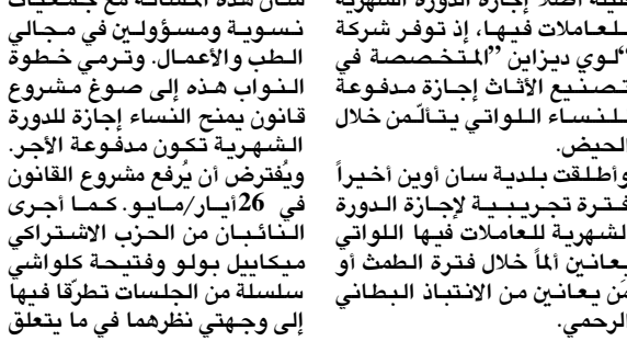
بقية الخبر على موقع (الزمن)

المتنافس على سعفته الذهبية من 16 ايار/مايو المقبل إلى السابع والعشرين منه. ويتولى مدير المهرجان تيبيري فريمو صباح الخميس الإعلان في إحدى دور