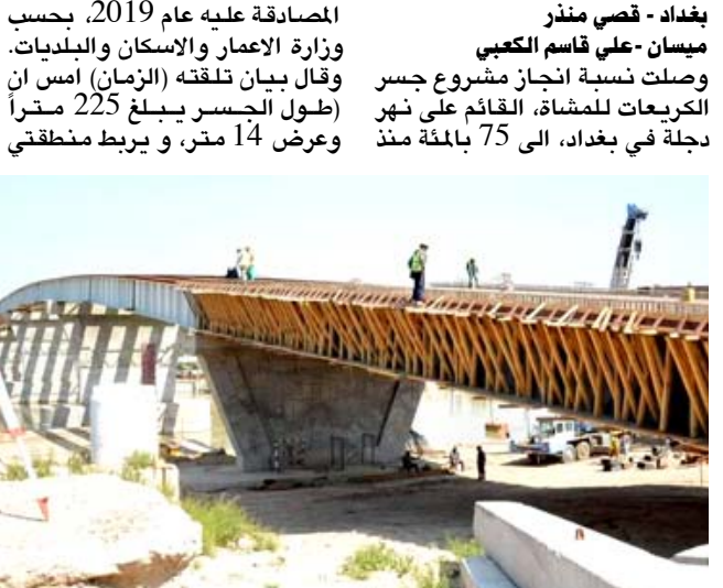
جسر: ملاكات وزارة الاسكان تواصل العمل في مشروع جسر الكريعات

الكريعات بالكاملية)، موضحاً انه (يتكون) من خمسة فضاءات بطول 45 متر للفضاء الواحد، ودامات رئيسية وأربع مخصصات استراحة تبعد عن مسار الجسر بمقدار 20 متر).