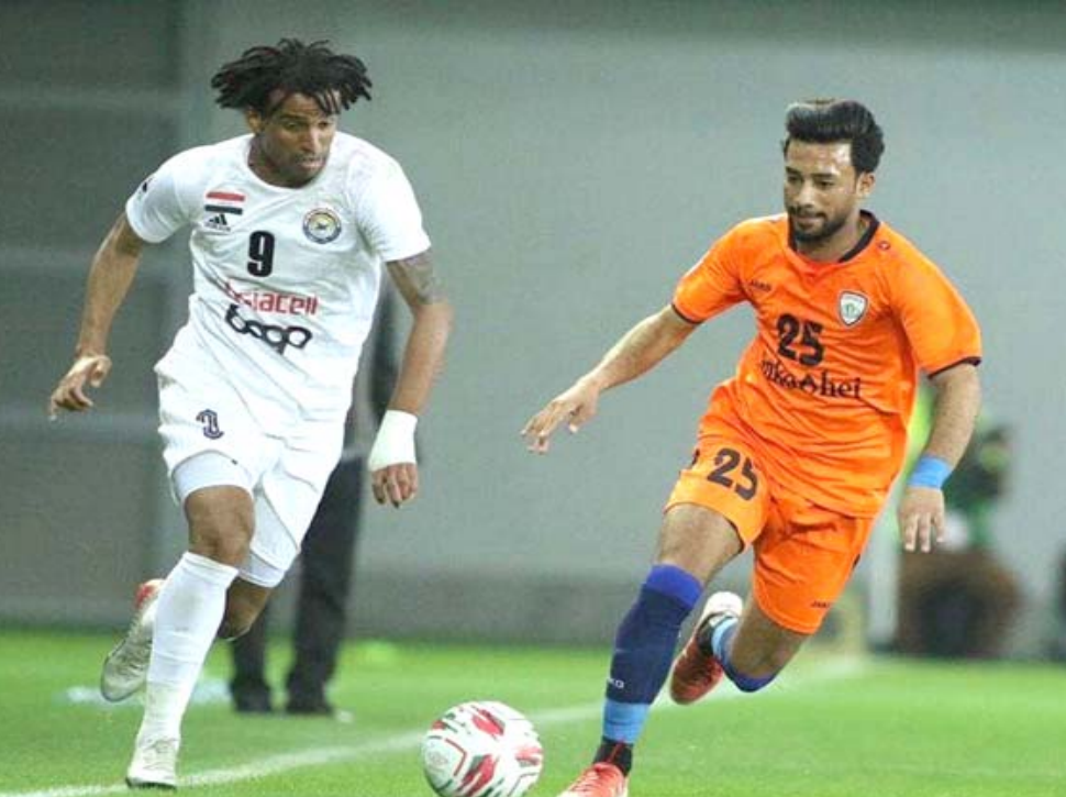
تعويض: الزراء يستعد للتعويض في جولة الممتاز القادمة

المتوقع على المتذلل السماوة بهدفين لوحيد وسط حضور كبير مستفيداً من تعادل الجولان وفريق الحرس وعفك وديالى بدون الأهداف ويامل جمهوره ان يتشارك تحديات اخر خمس مباريات لضمان التاهل والعودة للمنتاز بقيادة هاتف شمراي الذي اعاد التوازن للفريق وتنشيط صفوفه في اهم اوقات المنافسة والمتابعة الجادة من اهل البصرة بانتظار انهاء المهمة على اكمل وجه ورفسح الفاخر اطلاقاً.