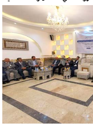
نقوة : كربلاء تشهد ندوة حوارية

شرط او مرتكز لاقامتها)، ولغت الى (غياب التنسيق بين المنظمة والمحافظات الاخرى بسبب تضارب مصالح الجهات الداعمة، ما يجعلها منظمات خاصة وتفتقد اهداف الجهات المستهدفة، اما مراكز الأبحاث فأغلب نشاطاتها تفتقد الى التحوصل مع صنّاع القرار، ولتعمل بالتوصيات مع المسؤولين متعلما معمولا به في اغلب دول العالم)، ودعا العطار الى (إنشاء تحالف من منظمات المجتمع المدني في كل محافظة، لتعزيز عملها ومشاركة رؤاها في العمل والتحشيد