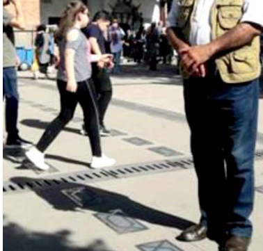
مسجد حاج بيرم