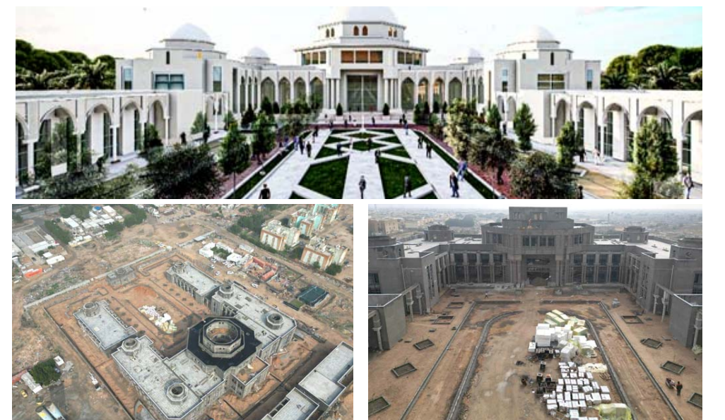
قصر : جانب من مخطط مشروع قصر العدالة

ابنية صممة ببناء حديث، فضلاً عن غرف للقضا والمحامين والموظفين، ولفت الى ان (فرق المتابعة في التخطيط، تابعت مراحل تنفيذ المشروع واطلعت على مراحل سير العمل فيه)، مؤكداً ان (الابنية الرئيسية في