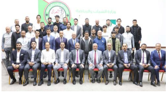
وزير الشباب يتوسط لاعبي خليجي 25

بمركز الوصافة الاسوي، ولا يقل مكانة عن اية بطولة أخرى، ممتننا ان يحقق منتخبنا الأولبي إنجازاً جديداً خلال الأيام المقبلة في دولة قطر الشقيقة. وعبر المبرقع عن امتنانه لتشريفه من قبل دولة رئيس مجلس الوزراء، ليكون مفعلاً عنه في توزيع سندات الأراضي للاعبين، والحكام، والفنيين في المنتخب، وهو امر في غاية الأهمية يعكس مدى تفاعل الحكومة مع الرياضة عموماً، وكرة القدم على وجه الخصوص، كونها مصدراً لإسعاد جماهيرنا الكبيرة. وقدم وفد اتحاد الكرة شكره وتقديره لسيد المبرقع، لحفاوة الاستقبال، والدعم الذي تلقاه منتخبنا الوطنية، بما يعزز نجاحاتها في جميع الاستحقاقات الخارجية.