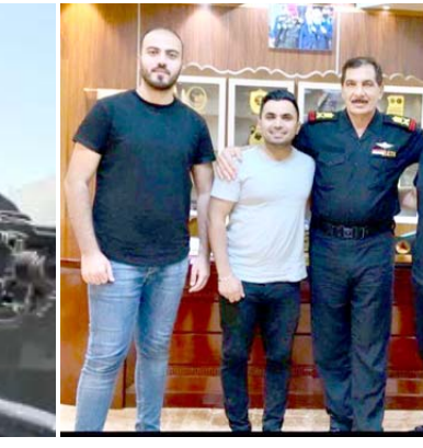
برنامج : لقاء من مرافقة برنامج (كلام الناس) لجهاز مكافحة الإرهاب