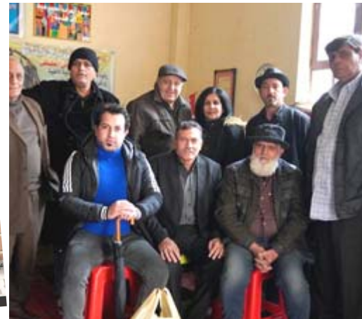
مسرحية: فريق مسرحية (حمامات الشفا) ولقطة منها