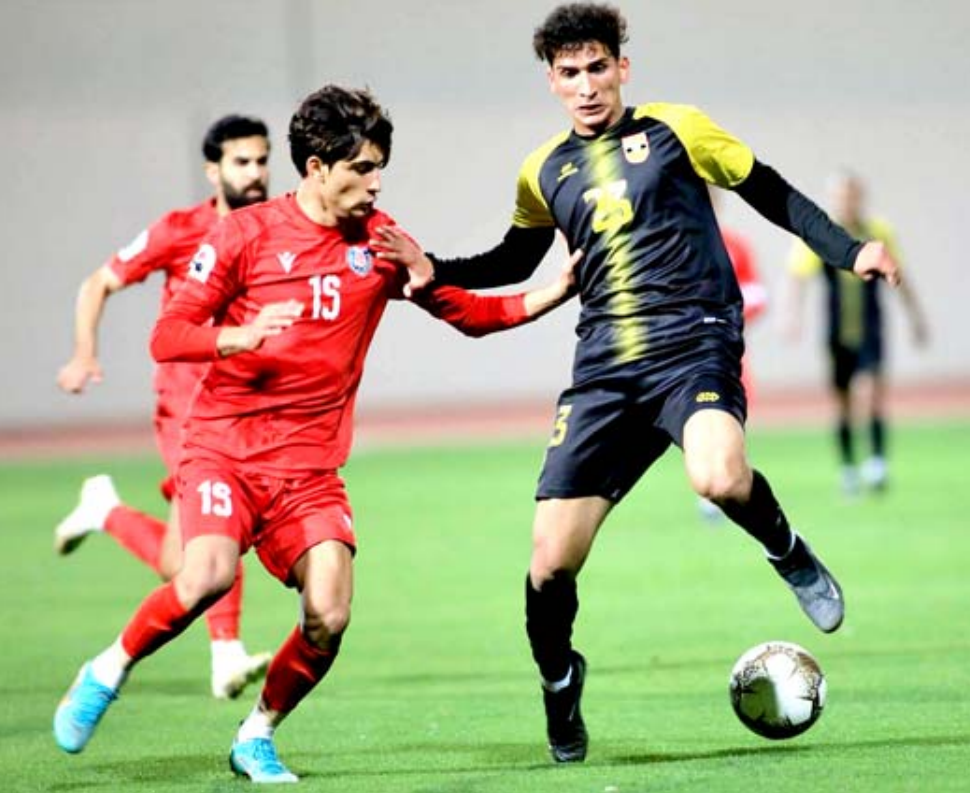
موري، جانب من مواجهة الكرخ ونظ البصرة في الدوري الممتاز

مستوى ضعيف ولعب بخطوط متباعدة وإخطاء دفاعية و تخطيط هجومي وتعقد الأمر مع مرور الوقت محاولة لإدراك التعادل قبل الأمل في المتشاور بعد تقديم مستوى واضح و مباراة جيدة في غاية الأهمية رغم ظروف الفريق الصعبة وهو العائد بخسارة من نقطة ميسان وتوقف في سنة محطات غير أنه لعب مباراة قوية على بعد دقيقة من تحطف كامل المكان قبل الخروج سوية بخيبة أخرى وكان الفريق يقترب من تكرار سيناريو الموسم الماضي بإهدار النقاط بربع تعادلات وفوز وخسارة من ست جولات قبل أن يستقر في النقاط ليتقدم رابعاً 32 بنقطة وصيد الكهرياء على بعد ثلاث نقاط من الجوية والشرطة ونقطة من الطلاب مع مرور الوقت.