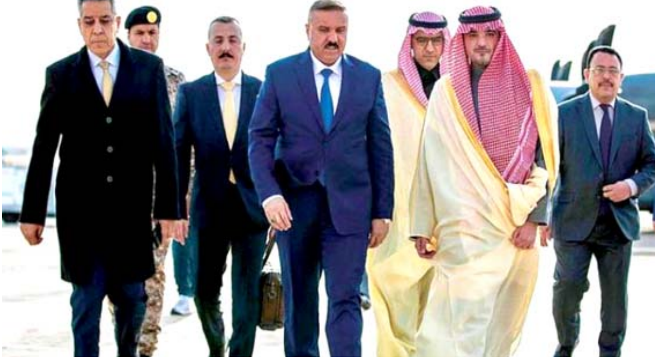
زيارة وزير الداخلية خلال زيارته الرياض

يحرص العراق على إستمرار الشراكة والتعاون الإستراتيجي طويل الأمد مع ألمانيا)مغربيا عن (شكره للبرلمان الألماني على الاعتراف بالإبادة الجماعية التي ارتكبها داعش ضد المكون الإيزيدي).