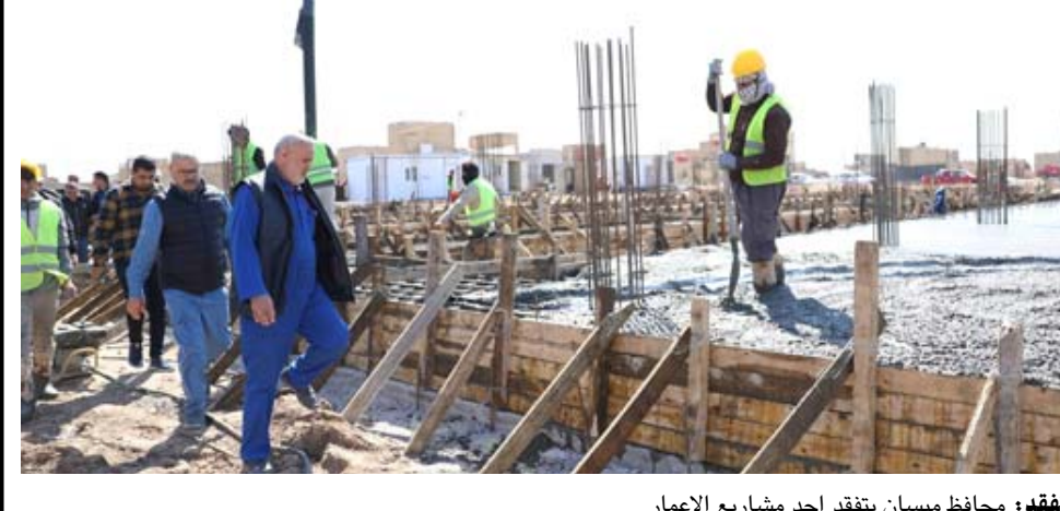
تفقد: محافظ ميسان يتفقد احد مشاريع الاعمار

بدايباً وقضائياً واجراء كشف الدلالة المطابق لإعترافه). اسلحة خفيفة وكشفت قيادة شرطة ميسان، عن مياشرتها قريبا بحملة لحصر السلاح بيد الدولة عبر تسجيل الاسلحة الخفيفة في مراكز الشرطة. وقال البيان ان (ذلك يأتي تنفيذاً لأوامر وزارة الداخلية بحصر السلاح بيد الدولة فقط)، مشيراً الى (تشكيل لجان مختصة بهدف