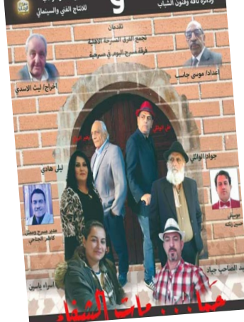
مسرحية: فريق مسرحية (حمامات الشفا) ولقطة منها