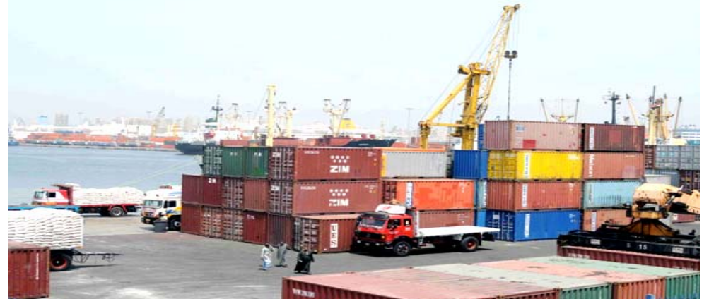
ميناء : حاويات تجارية في ميناء، ام قصر

مركز الكمرك)، وبين ان (الهيئة نظمت محضر ضبط قانوني، واحالت المواد الى مركز شرطة ام قصر الاوسط). وضبطت الهيئة سبع حاويات اخرى مخالفة، في ميناء ام قصر الشمالي. وذكر البيان ان (فريق الهيئة بالتنوع، بالتنسيق مع مركز الكمرك، مشيراً الى ان (المواد متجاوزة