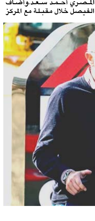
بطولة، ستيفانو دومينيكالي رئيس بطولة العالم لسباقات سيارات

بغداد-الزمان كثف مركزاً جداً، واتقاً بطريقة لعبي، أنا اعمل منذ أشهر، ولم يكن من السهل أبداً أن اعمود، وهذا ما يجعل هذه اللحظة متميزة. وأكد الكاراز، الأحد في نهائي هذه الدورة التي خاضها كحصف اول ويات فيها اول إسباني يحزن اللقب منذ نادال عام 2015 تفوقه على نوري المصنف ثانياً بالفوز عليه للمرة الرابعة من أصل 5 مواجهات بينهما ليحقق لقبه الخامس على الملاعب الترابية والأول منذ فوزه بطولة فلاشينغ ميدوز في نيويورك العام الماضي. صدارة التصنيف وتسبب هذا الخيبان، لإسيما عن بطولة أستراليا المفتوحة، بخسارة الإسباني الشاب لصدارة التصنيف العالمي لصالح الصربي نوفاك ديوكوفيتش الذي حقق اللقب، وقال الكاراز بعد المباراة