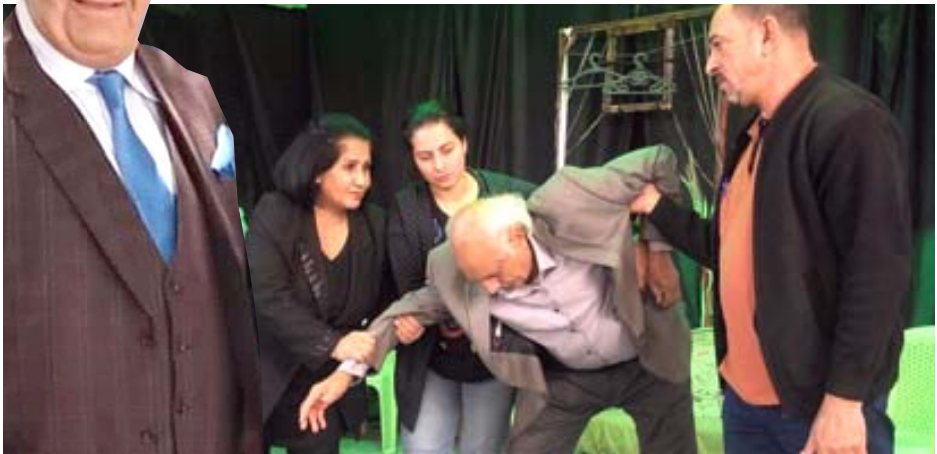
مسرحية: فريق مسرحية (حمامات الشفا) ولقطة منها