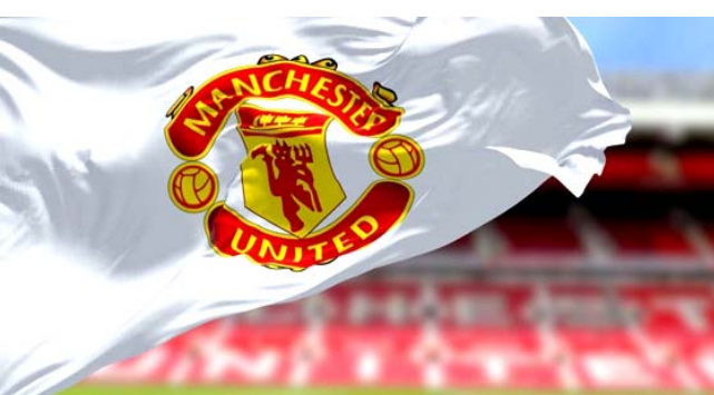
شعار نادي مانشستر يونايتد