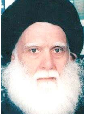
محمد صادق الصدر