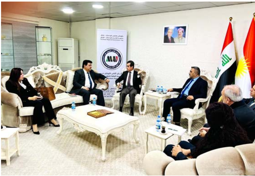
مباحثات؛ وكيل وزارة البيئة يبحث مع وفد حكومة إقليم كردستان التعاون الثاني

(تقديره لجهود الوزارة والتعاون مع الإقليم لمعالجة التلوث، فضلاً عن توجيهه دائرة شؤون الألغام ودائرة التوعية والإعلام البيئي في الوزارة، بدعم مناطق كردستان والتعاون لحسن ادارة هذا الملف المهم).