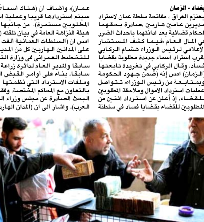
كشك: صاحب صيرفة يجلس خلف كشك في الكفاح