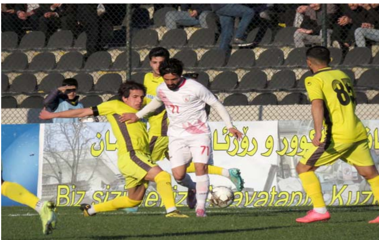
مباراة: جانب من مباراة اربيل ونوروز في الدوري الممتاز

بفارق الاهداف عن الكرخ الحدود ومتوقع الاستمرار به لصعوبة مهمتي الاثنين اللذين يكونا قذليبا امس الاول في البصرة والاخر امام الزوراء. يعود متصدر المجموعة الثانية لدوري الدرجة الاولى بكرة القدم الميناء البصري 24 أمام جمهوره الكبير لواجه الوصيف دبالي 22 في افتتاح مباريات المرحلة الثانية للدفاع عن موقعه وتوسيع الفارق عبر جهود عناصره وعاملي الأرض والجمهور في وقت يعول الضيف على أداء مرتقب من لاعبيه لاستعادة الصدارة والعودة بها.