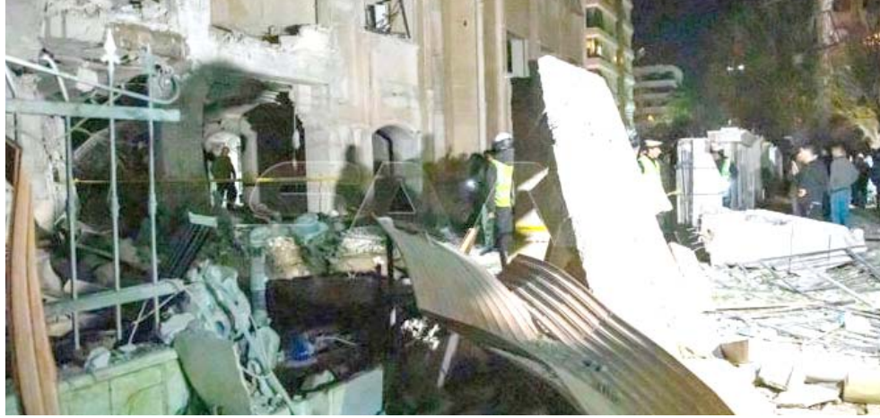
قصف: اثار القصف الجوي الذي طال حيا سكنيا في دمشق

في دمشق عن سماع دوي انفجارات عنيفة، تلتها صفارات سيارات مغنية بتفجير سيارة مفخخة في دمشق العام 2008. أفاد المدير العام للآثار والمتاحف في سوريا بظهير عوض فرانس برس عن أضرار طالت أبنية تابعة للقعة دمشق الأثرية بعد سقوط صاروخ نجيحة الإسرائيلية في حي العديان بدمشق، وأضرار كبيرة في أجهزة مسح حديثة ودمار واسع في المباني التي تعد أيضاً أثرية. وبم تطل الأضرار ببناء القلعة نفسه، وفق مراسل فرانس برس في المكان، الذي أفاد عن دمار كبير في المباني التابعة للقعة والقريبة من سوريا. وقال عوض إن هذا أكبر ضرر يطال باسم الجيش الإسرائيلي التعليق على معلومات في الإعلام الأجنبي. وخلال اجتماع لحكومته الأحد، قال رئيس الحكومة الإسرائيلي بنيامين نتانياهو في تصريح بكره دائماً أن تسمح لإيران الحصول على سلاح نووي ولن نسمح لها بتخصيب تواجدها عند حدودنا الشمالية. وأدان المتحدث باسم وزارة الخارجية الإيرانية ناصر كنعاني في بيان الضربات الإسرائيلية على دمشق الأولية إلى ارتقاء خمسة شهراء بينهم عسكري وأصابة 15 أمدنيا بجروح بينهم حالات حرجة. كما أدى إلى تدمير عدد من منازل المدنيين وأضرار مادية في عدد من الأحياء في دمشق ومحيطها. وقال المحرر في تمام الساعة 00:22 من فجر اليوم (22.2)، فذ العود الإسرائيلي عنواناً جويًا برشقات من الصواريخ من اتجاه الجولان السوري المحتل مستهدفاً بعض النقاط في مدينة دمشق ومحيطها من ضمنها أحياء سكنية مأهولة بالمدنيين. وأفاد مراسلون لوكالة فرانس برس بشكل عاجل: وتزامن ذلك مع وصول