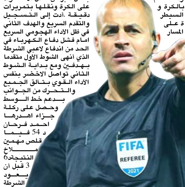
حكم مباراة الشرطة والكهرياء.