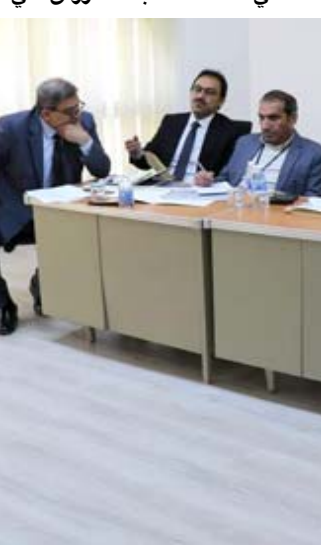
مقابلة؛ لجنة المقابلات في سلطة الطيران المدني تختبر الموظفين