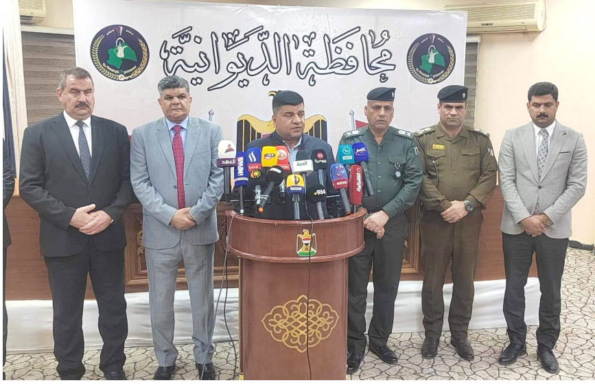
الديوانية - الزمان

كشفت محافظة الديوانية عن نتائج التحقيق الخاصة بحريق مستشفى الأطفال والولادة، التي أسفرت عن مصرع 5 أطفال وقسم من مسؤولي المستشفى، وذلك في مؤتمر صحفي مشترك مع مسؤولي المحافظة. وأضاف أن الحريق وقع في الساعة 11 صباحاً، ولم يبلغ عن وقوع إصابات أو أضرار، وهذا أول هجوم يستهدف مدرسة أمريكية منذ أن شنت الولايات المتحدة وبريطانيا ضربات مكثفة ضد مواقع الحوئين الذين يشنون هجمات في البحر الأحمر ضد سفن تجارية بحرية. ويقول الحوئين إنهم (يستهدفون الملاحة في البحر الأحمر تضامناً مع الفلسطينيين في غزة).