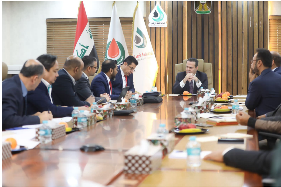
اجتماع: وكيل وزارة النفط يعقد اجتماعاً في ذي قار

اهمسية تعزيز التعاون معها، لتأمين للمواقع النفطية والعاملين في الشركات الاستثمارية المطورة لحقول المحافظة وميسان)، من جانبه، لفت قائم مقام المحافظة للشركات النفطية العاملة في المحافظة، وحسب البيان فإن (جميع) اشاد بدور القوات الأمنية في الحفاظ على الأمن والاستقرار،