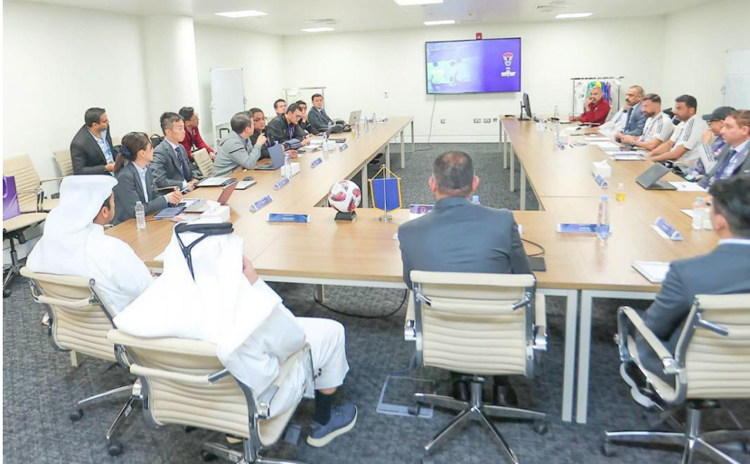
بطولة: اجتماع تحضيرى لبطولة غرب اسيا لكرة الصالات

استراتيجية الاتحاد للعام 2024. حدث يسعى الاتحاد لتنظيم بطولات عالية المستوى ونشاطات تطويرية لارتقاء بمستوى كرة القدم في المنطقة. واطلعت اللجنة التنفيذية إلى جانب اسيا لكرة القدم واتفاقية التعاون مع اتحاد كاس الخليج التي تهدف لتنظيم البطولات بين الاتحادين وتطوير كرة القدم، وعلى اتفاقية التعاون مع مركز الملك سلمان للاغاثة والأعمال الإنسانية واتفاقية التعاون مع شركة كبتان. استراتيجية الاتحاد للعام 2024. حدث يسعى الاتحاد لتنظيم بطولات عالية المستوى ونشاطات تطويرية لارتقاء بمستوى كرة القدم في المنطقة. واطلعت اللجنة التنفيذية إلى جانب اسيا لكرة القدم واتفاقية التعاون مع اتحاد كاس الخليج التي تهدف لتنظيم البطولات بين الاتحادين وتطوير كرة القدم، وعلى اتفاقية التعاون مع مركز الملك سلمان للاغاثة والأعمال الإنسانية واتفاقية التعاون مع شركة كبتان.