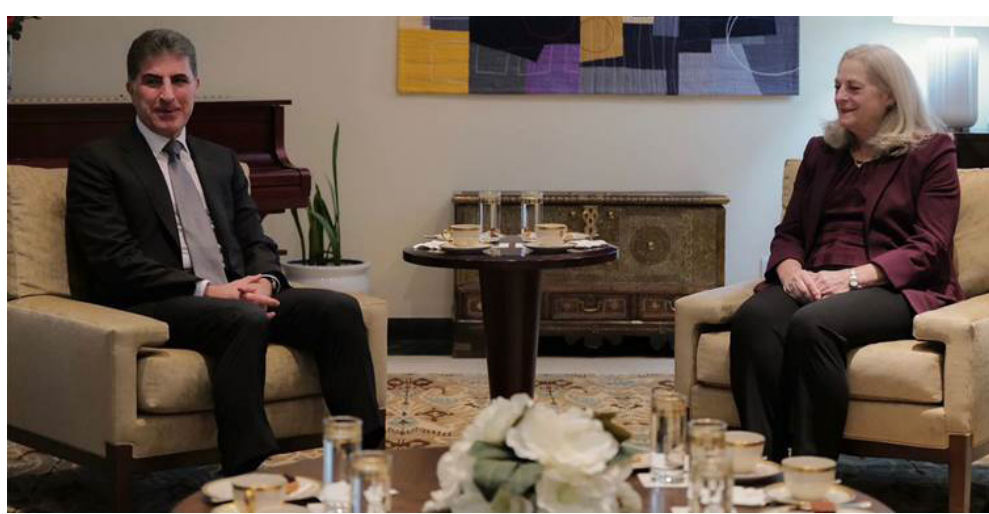
لقاء: رئيس اقليم كردستان يلتقي السفير الأمريكية لدى بغداد

وإيجاد الحلول للتحديات التي تفرزها العملية السياسية. ويتبادل البارزاني مع أمين عام عصائب أهل الحق قيس الخزعلي، الآراء بشأن الأوضاع السياسية والأمنية في العراق واكد في بيان امس (دعم حل المشكلات بين اربيل وبغداد عبر الحوار والتفاهم). وناقش البارزاني مع رئيس تحالف نبني هادي العاصري ورئيس الوزراء الأسبق عادل عبد المهدي ،كلا على حدا (الأوضاع الامنية والسياسية الراهنة في العراق ،وتحديات المنطقة). في غضون ذلك ، استقبل رئيس ائتلاف الوطنية ايساد علاوي ، رئيس الاتحاد الوطني الكردستاني باقل طالباني والوفد المرافق له . وجرى خلال اللقاء (بحث مستجدات الوضع السياسي على الساحة المحلية ،وتطورات الاوضاع في المنطقة مع تأكيد احترام سيادة العراق والحفاظ على امنه واستقراره ووحدة اراضيهِ) . واضاف ان (الجانبين تطرقا الى اوضاع كركوك ،بضرورة ان يسهم الجميع في ادارة المدينة والحفاظ عليها حتى تستمر في رفد العراق من خيراتها).