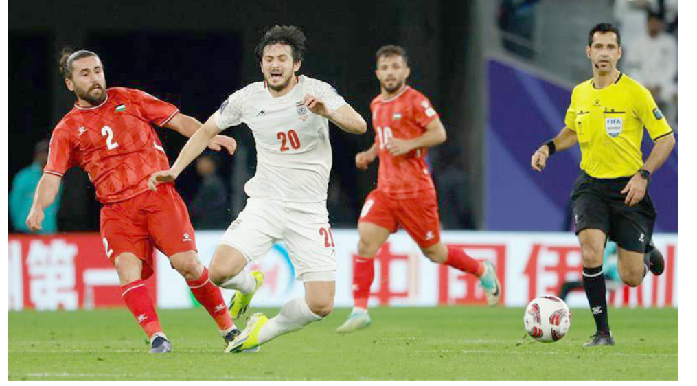
فوز المنتخب الإيراني يحقق الفوز على نظيره الفلسطيني بثلاثة

حاسما من الهولة الاولى والتطلع إلى الخروج بكامل العلامات على فيرغيزستان ويعلم ان محاولة تحقيق الفوز الأول يعني الكثير ويريد من حظوظه في ترتيب المجموعة كما سيكون له انعكاسات على مشاركة الفريق الذي استمر يتألق بوجود اكثر من لاعب مهاري ومؤثر فيما يرغب الطرف الآخر الظهور بشكل افضل من المستوى الذي قدمه في المشاركة الاول عندما وصل للدور 16وأخسر من الامارات بهدفين ثلاثة كما يعول كثيرا على تصفيات كاس العالم وتعاقدت مع سوريا وديا يهدف وفازت على فينتام بهدفين لواحد وتامل ان يكون لها دور في تحقيق الفوز باللقب وهو ما يسعى لافتحه في مباريانه بضمان الفوز لأهمية ذلك على موقف الفريق ومسيرته في التصفيات وبماثل ان يكون