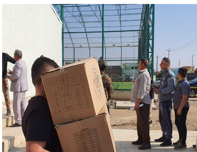
إغاثة: ملاكات الهجرة تقيم العائدين إلى سنجار

وقال رئيس الصندوق محمد هاشم العنكي، في تصريح امس أن (الصندوق ينفذ أعمالاً شملت جانب من مشروع جسر قطاع القدس، وإفتتاح بناية مركز التدريب والتطوير في حي التحرير بمدينة بعقوبة)، مؤكداً أن (الصندوق خصص 255 مشروعاً لإعمار المناطق المحررة في المحافظة، أنجز منها 207 مشاريع، والمتبقى في طريق الإنجاز، حسب خطة العام الجاري، إعادة أكبر عدد من النازحين). وفي النجف، أكد مسؤول شعبة القروض في دائرة