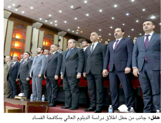
حفل : جانب من حفل اطلاق دراسة الدبلوم العالي بمكافحة الفساد