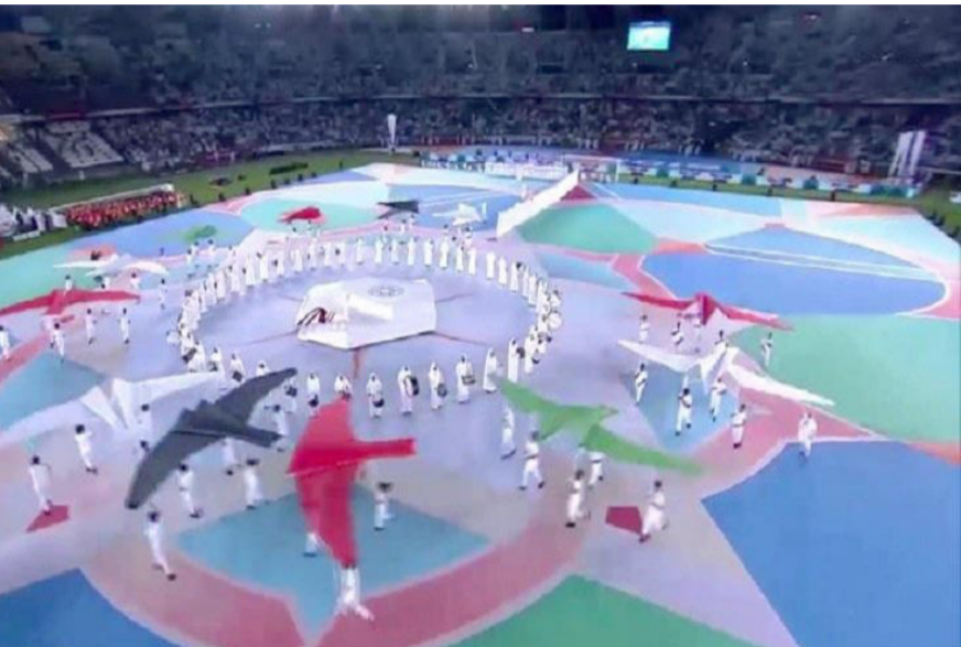
إفتتاح: جانب من افتتاح بطولة امم آسيا في الدوحة

قوي م للفوز باللقب ومتوقع أن يمر ببارجة من المجموعة من دون صعوبات ولأنه أفضلها جميعاً لما يمتلك الكثير من الحوافز في وقت يامل منتخب فلسطين تقديم مساهمة عالية ويعلم المدرب والألعابيين سيكون الفريق امام مهمة صعبة لكنه يريد قطع خطوطهم عبر الظهور بالمزيد من الأداء بعد سبع مشاركات خاوية لكثرة سحطى متابعتها جماهيرية في ظل الصمود البطولي للشعب الفلسطيني.