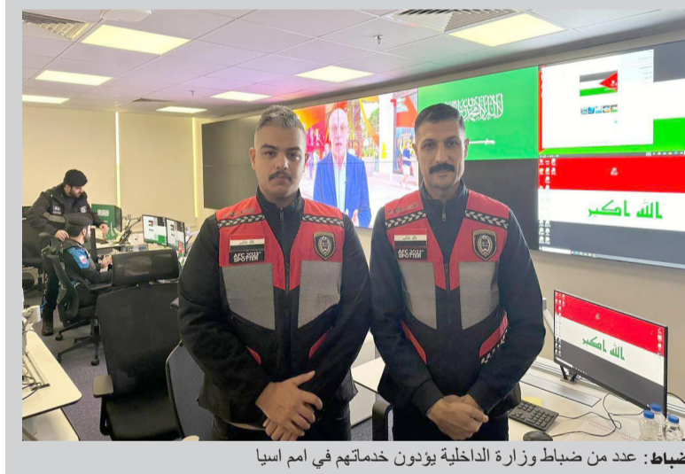
ضباط: عدد من ضباط وزارة الداخلية يؤدون خدماتهم في امم آسيا

شارك عدد من ضباط امن الملاعب التابعين لوزارة الداخلية العراقية في المركز المشترك لإدارة أمن كاس امم آسيا التي ستقام في قطر. وجاءت هذه المشاركة عبر قيام الدولة المنظمة لبطولة امم آسيا في تشكيل لجان مشتركة من اجل انجاح البطولة بالشكل الامثل. ومن جهة اخرى غادر المنتخب الأولبي لكرة القدم، إلى دولة الإمارات العربية المتحدة للدخول في معسكر تدريبي يتخلله خوض ثلاث مباريات تجريبية أمام منتخبات مصر وغانا والإمارات، تسبقها مباراة ودية أمام أحد الأندية الإماراتية. وذكر الاتحاد العراقي لكرة القدم في بيان ان المنتخب الاولبي سيلاقي المنتخبات الثلاثة تحضيرياً لبطولة آسيا تحت 23 عاماً إذ ان المباريات مع فرق قوية ستكون مهمة في هذا التوقيت، ولاسيما ان جميع اللاعبين يتجمعون بهذا التوقيت بعد التوقف الدولي. ووضعت قرعة كاس آسيا تحت 23 سنة منتخب العراق الأولبي، في المجموعة الثالثة إلى جانب السعودية وتايلاند وطاجيكستان.