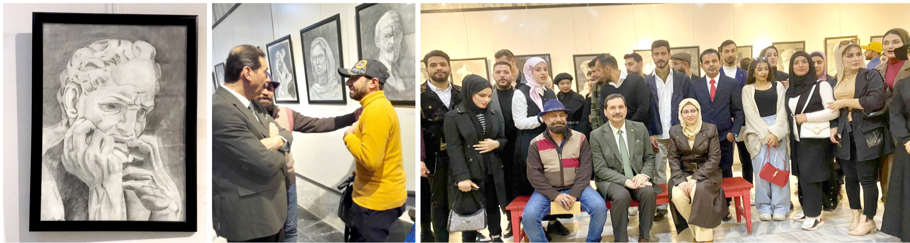
معرض لوحات من المعرض السنوي لقسم الفنون التشكيلية في كلية الفنون