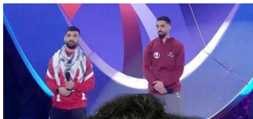
قسم: قائد منتخب قطر يتناول نظيره الفلسطيني لترديد قسم البطولة

بغداد- الزمان استضاف استاد لوسيل، الذي استضاف نهائي كاس العالم لكرة القدم 2022، بين الأرجنتين وفرنسا، حفل افتتاح كاس آسيا 2023 الذي شهد إلقاء قائد منتخب فلسطين لقسم البطولة.