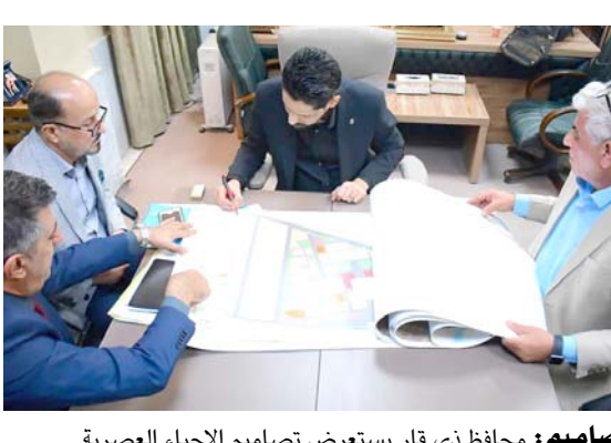
تصاميم : محافظ ذي قار يستعرض تصاميم احياء العصرية

بغداد - اقبال العربي اتفقت اطراف ائتلاف إدارة الدولة، على المضي بالحوارات لإنشاج مشروع قانون النفط والغاز مع تأكيد دعم جهود الحكومة في ملاحقة كبار المضاربين بالعملة. وقال بيان تلقته (الزمان) امس ان (رئيس الوزراء محمد شياع السوداني، ضيف الاجتماع الدوري للاستئلاف ، جرى خلاله استعراض مستجدات الأوضاع العامة في البلاد، ومناقشة الملفات السياسية والاقتصادية، ومراحل تنفيذ البرنامج الحكومي، وأولوياته التي تصدرت الخطط والبرامج (المعدة)، و اضاف، ان (المجتمع تطرقوا إلى الحوارات الجارية بشأن مشروع قانون النفط والغاز، وما أفضى إليه الاجتماع الفني، الذي عقد الاسبوع الماضي بحضور