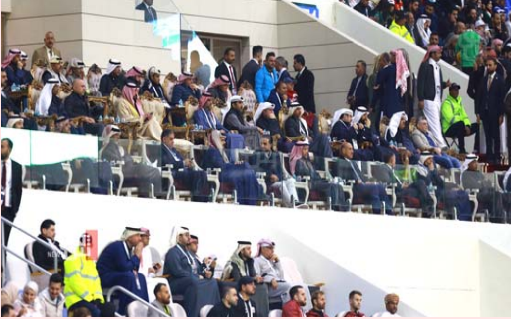
ملعب، جانب من حضور الشخصيات المهمة في ملعب جذع النخلة

وتحولت البطولة التاريخية التي انطلقت للمرة الأولى عام 1970 من البحرين، إلى مقللة كيان جديد باسم اتحاد كأس الخليج العربي الذي تأسس في عام 2016 خصيصا لرعاية هذا العرس الكروي الخليجي المقام كل عامين. وتقرر إقامة النسخة الثالثة والعشرين في قطر بسبب الحظر الدولي المفروض على الكويت التي تعتبر هي صاحبة حق التنظيم بناء على مبدأ المداورة بين الدول، لكن رفع الحظر قبل أسابيع أدى ردود افعال غاضبة فيما لم يستطع من اشترى بطاقات حضور المباراة بين العراق وعمان ومن جانبه أكد مستشار رئيس الوزراء لشؤون الشباب والرياضة آباذ بنبان أن تواجد رئيس الاتحاد الدولي لكرة القدم جيانى إنفانتينو في افتتاح خليجي 25 يعد مكسبا كبيرا وخطوة مهمة على طريق رفع