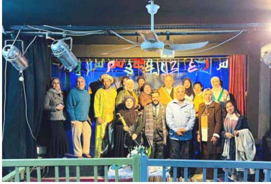
قراءات شعرية: لقطات من أوبريت (قراءات شعرية) وأوبريت (ما بين النهرين)