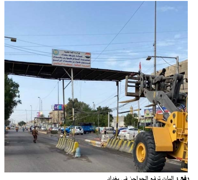
رفع اليات ترغ الحواجز في بغداد