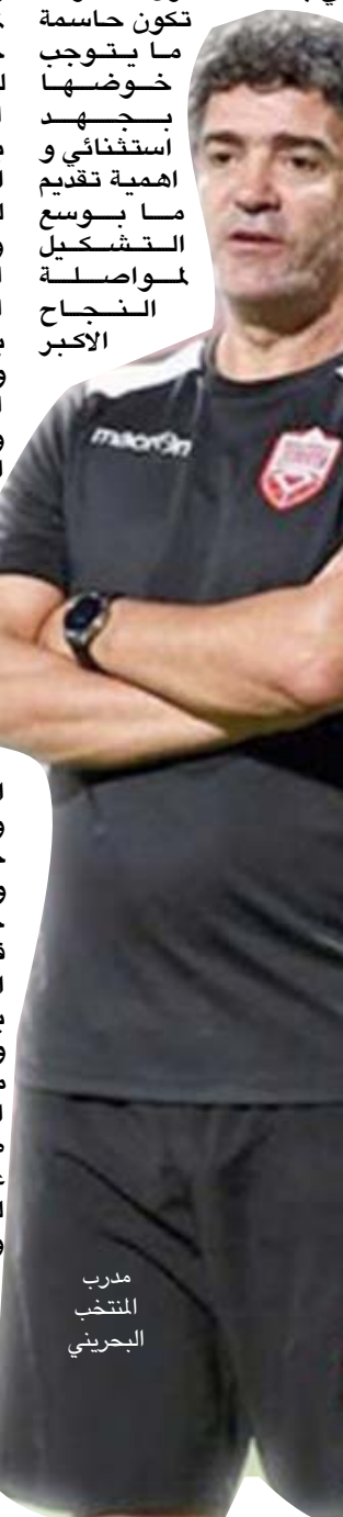
مدرب المنتخب البحريني

الناصرة - باسم الركابي تلاعب جميع فرق المجموعة الثانية اليوم الثلاثاء ضمن تصفيات المجموعة للجدولة الثانية في خليجي 25 الجارية في البصرة بشعار لايدل عن الفوز لايل يجب الفوز عندما يتطلع كل من منتخبي قطر والبحرين الاقتراب أو حسم التأهل للدور التالي والإمارات والكويت لابقاء على امالهما في المنافسة. قطر والبحرين يتطلع كل من قطر والبحرين لتجاوز عقبة الآخر في المواجهة التي تجمعها عند الساعة السابعة والربع في ملعب الميناء من اجل الاقتراب كثيرا او حسم التأهل مباشرة والانتقال للدور التالي فمنتخب قطر قدم الأداء المؤثر وحقق الفوز على الكويت بهدفين دون رد السبت في افتتاح مباريات المجموعة وسيكون على موعد خاص بمقابلة صاحب اللقب البحرين في لقاء لم يكن سهلا انطلاقا على الطرفين بعدما ظهر كل منهما منافسا واضحا وقدم مستويات متقنة في مسقط مبارياتهما ومعها ارتفعت معنوياتهما بعد فوز البحرين على الإمارات بهدفين لواحد والسعي لخوض لقاء اليوم بأفضل طريقة عندما قدمت قطر الأداء المطلوب رغم النقص يتخلف عدد من عناصره الذين مطلوبها في كأس العالم عن الحضور ما سهل من الأمور والخروج بكل الفوائد وتقف عند