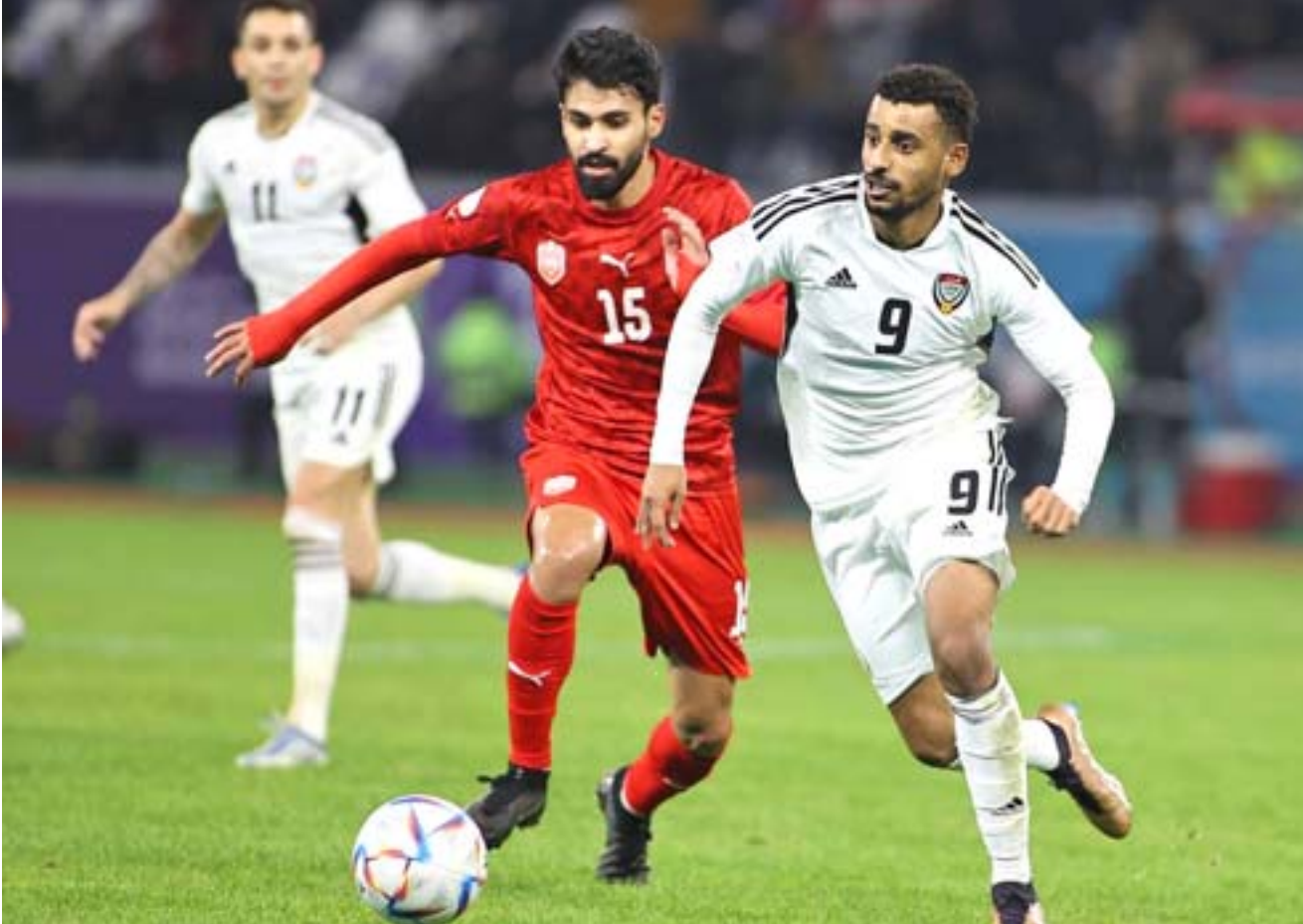
مواجهة، إحدى مواجهات المنتخب الإماراتي في بطولة كأس الخليج من البصرة

الأيض والأزرق وما يقال عن الأبيض ينطبق على الأزرق الآخر الذي جاء بدون عدد من عناصره ممن دافعوا كثيراً عن مشاركاته وفي المقدمة النجم المطوع وذلك لرغبة المدرب روي بينينو في الاعتماد على أعمار جديدة من سن 25 إلى 30 سنة بعد قطع المدرب وعدا لاتحاد الكرة الكويتي في الناهل لكأس العالم 2026 ويكون قد بدء مرحلة بناء منتخب جديد وكل ما ينتظره جمهور الكويت الذي، سيأتي مساندة ودعم الفريق اليوم هو تجنب الهزيمة الثانية وسط تحديات النتيجة التي تزيد من هواجس البقاء أو الخروج من الدور الأول ويعول المدرب والجمهور على من موجود في البصرة وفي تحمل مسؤولية الدفاع عن سمعة الكرة الكويتية والمنتخب الذي صال وحال في البطولة محققا العدد الأكبر بعشرة القاب وحمنا ان اللاعبين لا يريدون من لقاء اليوم الفرصة الأخيرة وقبلها أهمية التوقف عند الإخلاء التي قادت للهزيمة الأولى ووضع نتيجة الفوز في أذهان اللاعبين ومواجهة الآور بثقة مختلفة في المقدمة عمر عبد الرحمن عمرو قناص الفريق مصري حاسم.