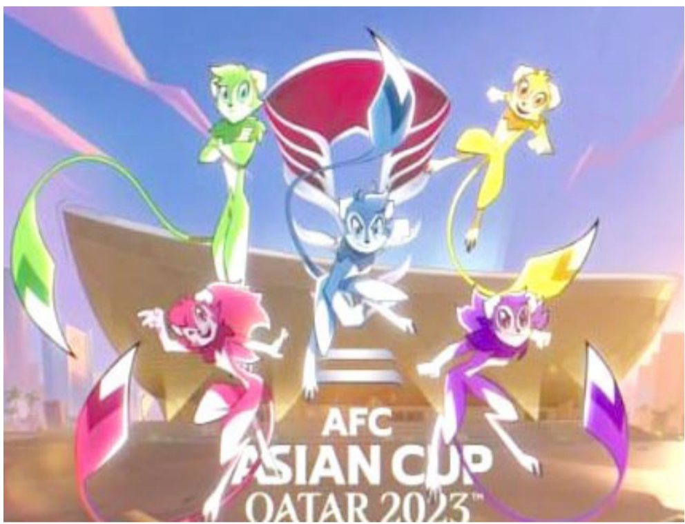
شعار دولة قطر تكشف عن شعار بطولة أمم آسيا بكرة القدم

بخمسة أهداف وتعالاد مع فيتنام بهدف في تصفيات كأس العالم ولم يشفع له تاريخه العبيد عندما شارك في بطولة كأس العالم 1938 وثالث نهائيات كرة القدم الأولمبية و1956 وتعود مشاركة فيتنام في بطولة آسيا الى النسخة الأولى 1956 و1960 عندما حل رابعاً في البطولتين وواصل الى دور الثمانية 2007 وتأهل أفضل ثالث 2019 لكنه خسر من اليابان بصعوبة بهدف وتراجع في الفقرة الأخيرة ويعد عن المناسبات الحقيقية لكنه يجد نفسه أمام فرصة ومحاولة اغتنامها قد لا يواجه منتخب كوريا صعوبات في تصدر مجموعة الخامسة من دون مشاكل في ظل التمتع بفريق متكامل بكل معنى الكلمة ومتمكن وقادر على تحمل المسؤولية والصراع على لقب البطولة التي حققه في أول بطولتين 1956 و1960 من عشر مرات وبين أفضل 50 فريقاً في العالم ويتمتع بقدرات فنية عالية مدجج بعدد من لاعبي أندية أوروبية معروفة وقادر على تحقيق الفارق ولا يمتلك منتخب ماليزيا حضوراً أو إنجازاً وتأهل ثلاث مرات للبطولة وفشل عبور المجموعات وظل منتخب مخمور بتصنيف 130 وستكون المشاركة الحالية الخامسة لمنتخب الأردن أفضلها 2004 عندما وصل للربع النهائي وودع البطولة بخسارة بصعوبة من اليابان بفارق ضربات الجزاء بعد انتهاء المباراة بالتعادل بهدف.