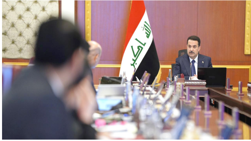
جلسة مجلس الوزراء برئاسة محمد شياع السوداني

مجلس الوزراء يدعم صندوق إعمار ذي قار بمشاريع جديدة