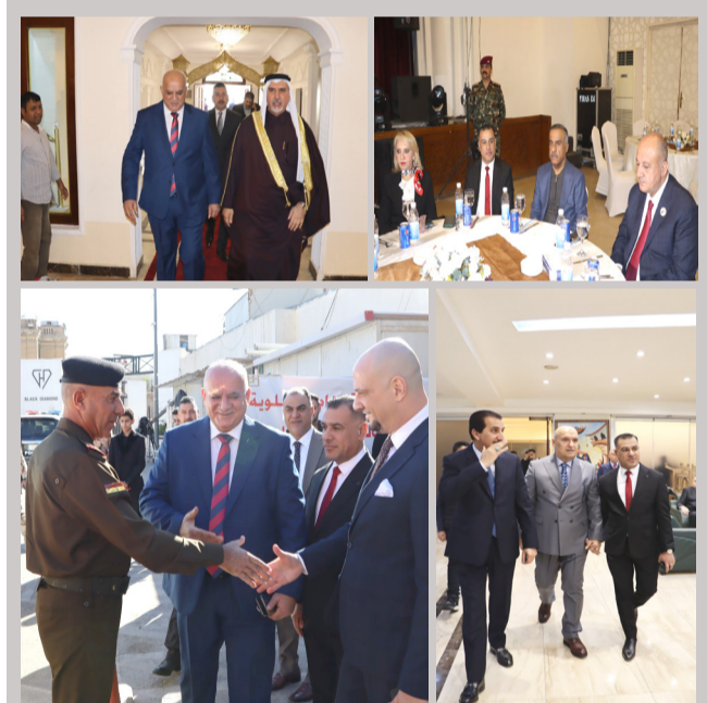
بغداد - الزمان أقام نادي العلوية في بغداد إحتفالية بمناسبة عيد الجيش العراقي وذلك على القاعة الرئيسية، بحضور وزير الدفاع ثابت محمد العباسي ونخبة من القادة الامرين وضباط الجيش والأجهزة الأمنية ، والتي ترأس البنية الإدارية شامل غاي العاني للنادي كلمة هنا فيها اطال الجيش والوقار السلسلة كافة تشكيلاتها وصنوفها وبمضامين قوات الشرطة والحشد الشعبي وتمنى لهم مزيداً من الانتصارات والتقدم والبهاء.

خطوط منها لنقل المسافرين واخرى للبضائع، لافتاً إلى (انجاز أكثر من 600 كيلومتر من التصاميم الأولية للمشروع، والف كيلومتر من تحريات التربة من الفاو إلى فينشاخور، وتابع ان (العمل تأخر في المناطق كمحافظة البصرة بسبب وجود حقول للاملاح، ومناطق اخرى لإجراء بعض الحددات الفنية التي سيتم الانتهاء منها قريباً)، مشيراً إلى (تعاون المحافظين بعدم