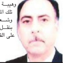
غزاي درع الطائي

إن هذه المشاريع وغيرها، مفروزة بامتلاك العراق ناصية التخطيط التي يعبر عن الحاجات الحقيقية للواقع العراقي، والقادر على تحديد المشاريع التي لها مساس مباشر بحياة الناس، والذي يأخذ بالحسبان مصلحة الوطن وهوية الدولة ومكانتها داخلياً وخارجياً، مع العمل على تنفيذ تلك المشاريع بصيغ متقدمة ومتطورة، ووضع مصلحة العراق وشعبه فوق كل اعتبار، وكبح الفساد بتبوعاته المختلفة، لتكفل بنقل العراق إلى الموقع الذي يستحقه وهو جدير به، وقادر على القفز به إلى الأمم بخطوات براها حتى الأسمى.