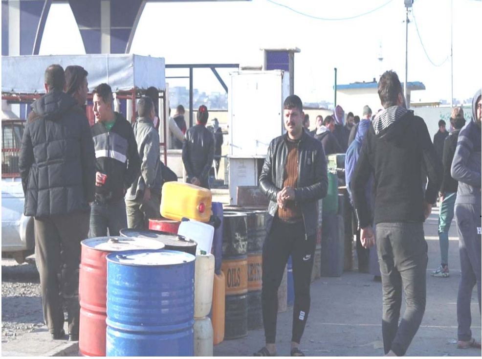
توزيع : مواطنون ينتظرون توزيع الحصة النفطية