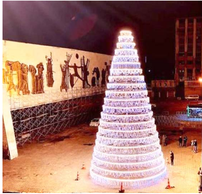
ساحة: شجرة الميلاد منصوبة في ساحة التحرير ببغداد

مستمرة لمدة يومين، دون تسجيل تصاعد في منسوب المياه بالمناطق الشمالية في المحافظة، لثقله تساقط الأمطار هناك، مشيراً إلى ان (هناك تنسيقاً مع إدارة سد دوكان بشأن الإطلاقات المائية). على صعيد متصل، اوضحت محافظة ذي قار، نسب كميات الأمطار المتساقطة في ثلاث مناطق. وقال مدير الأنواء الجوية في المحافظة، علي طارق، كمية الأمطار التي هطلت في مدينة الناصرية بلغت 20 ملمتراً، وفي قضاء الشنطرة 18.2 ملمتراً، وقضاء الرقاعي 26.4 ملمتراً،