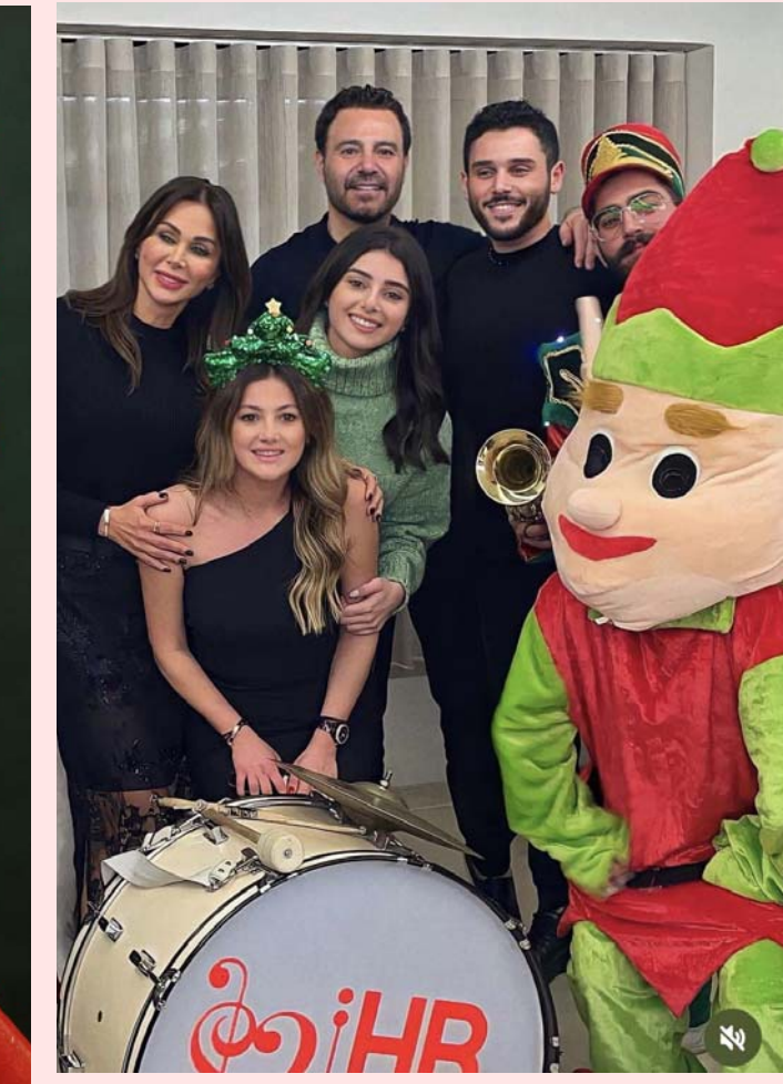
عاصي الحلاني يحتفي بالعيد مع عائلته