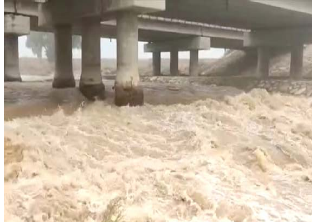
سيول: مياه السيول تخترق مهرب شمال ميسان