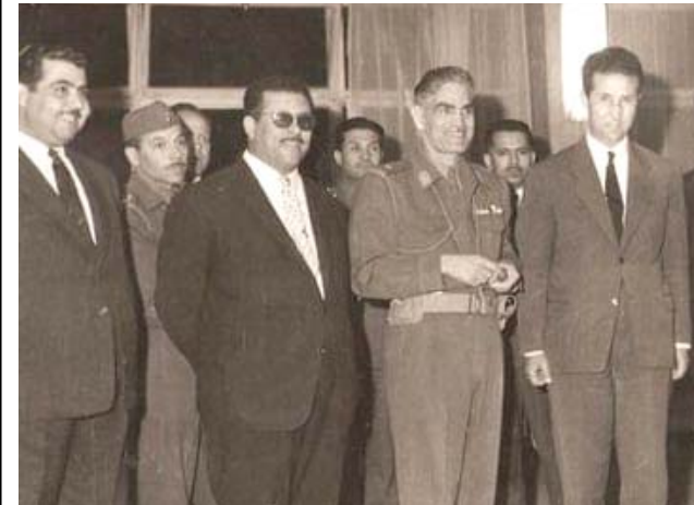
وفد: حسين آيت أحمد ضمن وفد جزائري ببغداد عام 1961

الاختياري بسويسرا ولم يعد إلا مع الانفتاح الذي أعقب أحداث تشرين الأول 1988. وخلال وجوده في الخارج درس