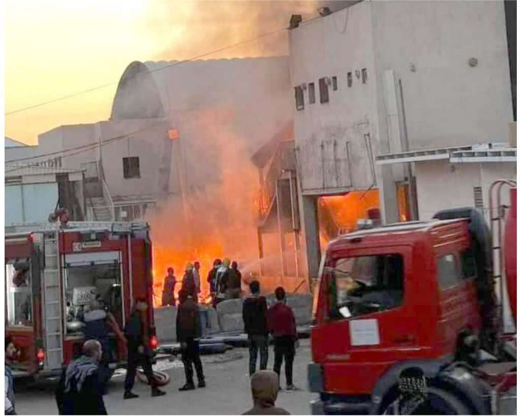
حريق : تندل من حريق نشب في مستشفى النسائية في الديوانية