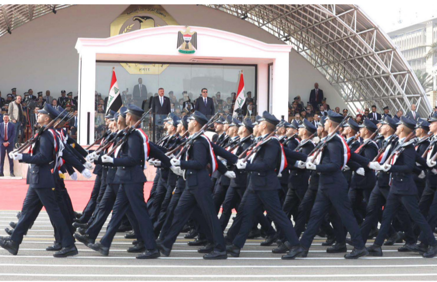
بغداد - قصي منذر

بغداد - قصي منذر استعرضت قوى الأمن الداخلي وتشكيلاتها امس امام رئيس الوزراء محمد شياع السوداني وزير الداخلية عبد الامير الشمري مبنى كلية الشرطة، احتفالاً بذكرى التأسيس 102، وسط إشادات بدورها في تعزيز الامن والاستقرار. وقال بيان تلقته (الزمان) امس ان (السوداني) حضر استعراض وحدات وكرايس الشرطة الذين يمثلون مختلف تشكيلات الوزارة وأجهزتها والياتها، في مشهد عبر عن القدرات والإمكانات الكبيرة التي يتمتع بها أبطال الشرطة وقوى الأمن الداخلي، وأضاف ان (الاستعراض) تضمن إقامة عدد من الفعاليات التي جسدت قدرات وعمل تشكيلات الوزارة، وجدد السوداني، بالذكري 102 لتأسيس الشرطة، الدعم والإسناد لأجهزة الوزارة وهي تحمي الاستقرار والسلم الأهلي، وتحت تدبئة على منصة اكس جاء فيها (بصنوفهم كافة بمناسبة الذكرى 102 لتأسيس الشرطة العراقية، مُستذكرين) امس (الدور البطولي لأجهزة الوزارة في مواجهة الإرهاب وماقات المخدرات ومحاربة الجريمة بكافة أشكالها)، وأشار الى (دعم مجلس النواب الكامل لجميع مفاصل وعناوين الداخلية)، داعياً الحكومة الى (تركيز جهودها) على تدريب أبطال الداخلية