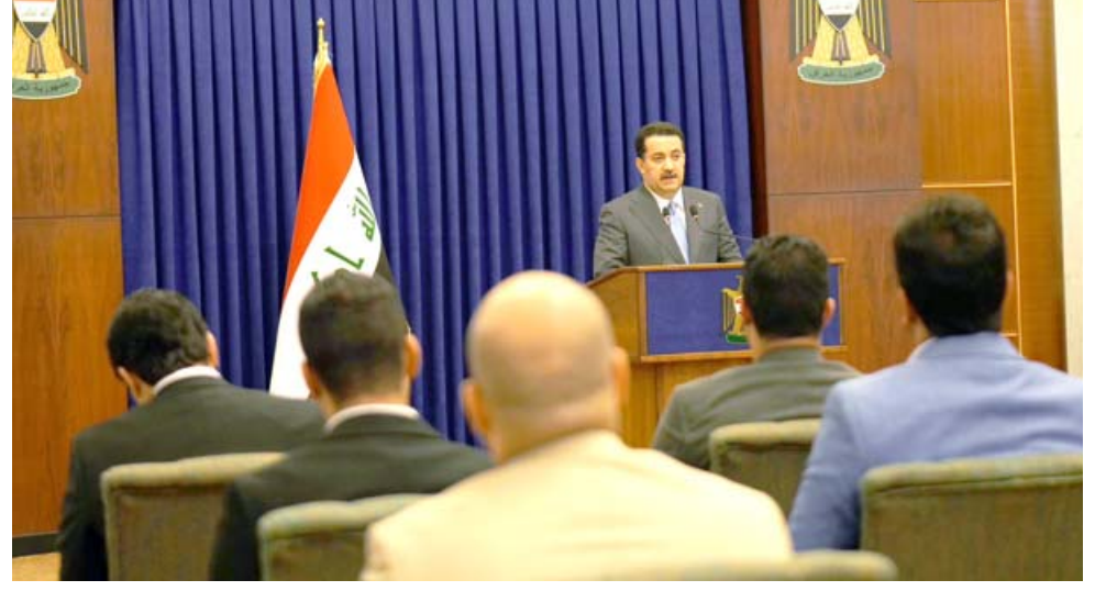
قرارات: رئيس الوزراء محمد شياع السوداني خلال مؤتمره الصحفي الاسبوعي

بغداد - الزمان كشف رئيس الوزراء محمد شياع السوداني، عن زيادة واضحة بأسعار صرف الدولار مقابل الدينار، نتيجة رفض محاولات لشركات وهمية تسعى الى اخراج العملة من البلاد. وقال السوداني خلال مؤتمره الاسبوعي لاجتماعه (الزمان) امس انه (جرى رفض محاولات لشركات وهمية وهناك أسعار مبالغ بها في نافذة بيع العملة، وان عمليات التضخيم بالأسعار هدفها اخراج العمل من العراق). مبينا ان (الحكومة تراقب سياسة البنك المركزي بما يخص استقرار السوق). وكشف السوداني عن (وصول احتياطات البنك المركزي من العملة إلى 96 مليار دولار). واستطرد بالقول ان (الوضع المالي في العراق بأفضل حاله).