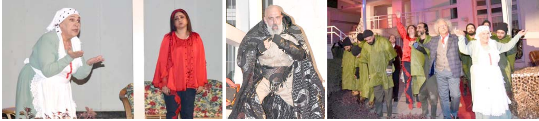
مسرحية : لقطات من مسرحية (في قول لا) لعزير خيون