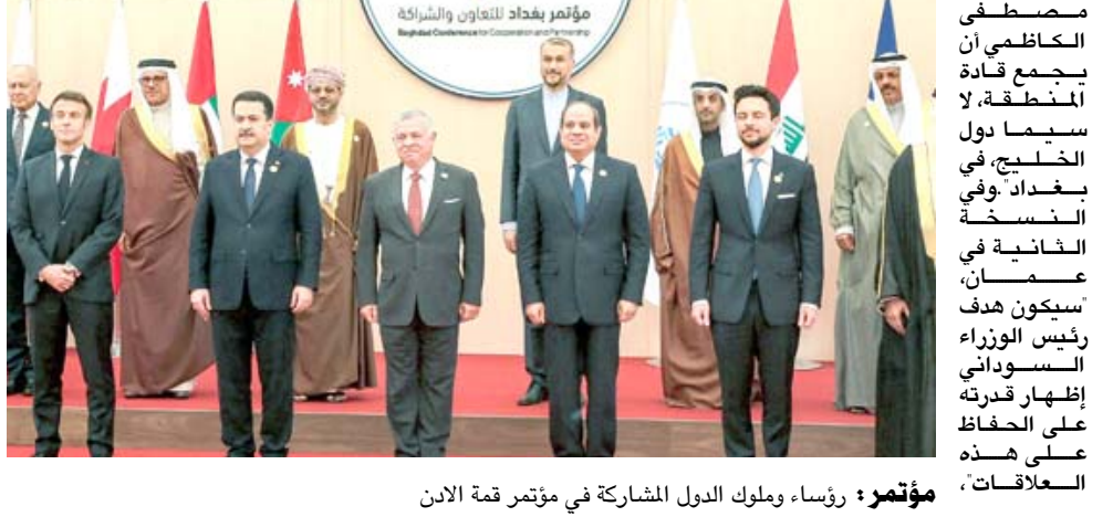
مؤتمراً: رؤساء وملوك الدول المشاركة في مؤتمر قمة الأذن

وفق حداد، ويضيف مع ذلك، اعتقد أن العراقيين وغير العراقيين يودون هذه المرة أن يروا الاجتماع يقضي إلى اجندة أكثر جدية، ومن المتوقع ان يتناول الاجتماع كذا قضايا مشتركة على غرار الاحترار المناخي والأمن الغذائي فضلا عن التعاون الإقليمي في مجال الطاقة وعلى جدول أعمال ماكرون الذي زار الإثنين حامله الطائرات الفرنسية شارل ديغول قبالة سواحل مصر لاحتفال بعيد الميلاد من القوات الفرنسية، لقاء مع ملك الأردن عبد الله الثاني الخليف