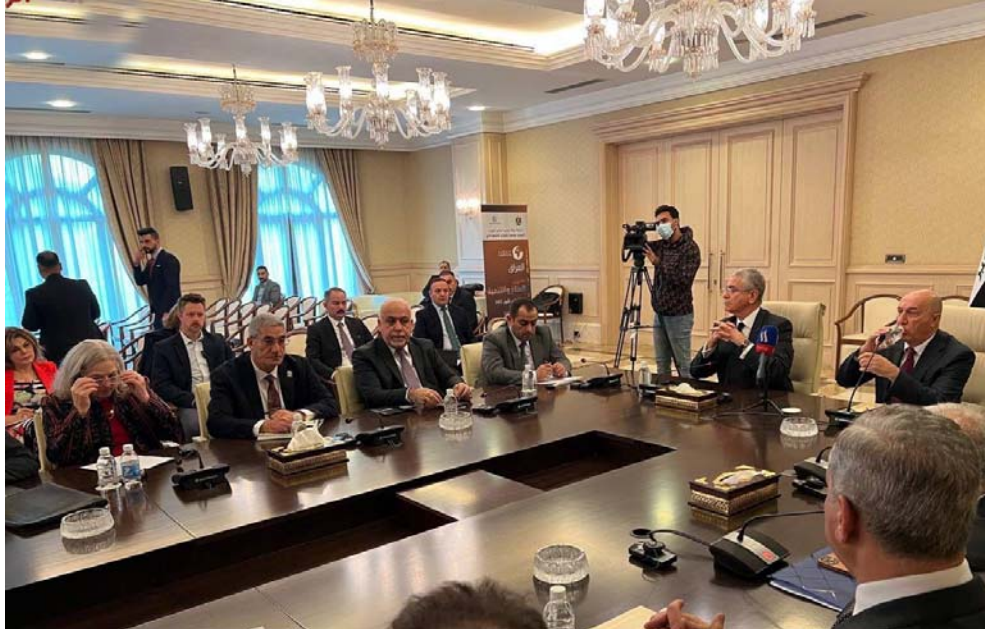
اجتماع : الجانبان العراقي والاممي في اجتماع بغداد

مفعولاً إلا ما بعد العام 2030. ومن بين الإجراءات "الطارئة" التي ينبغي على العراق القيام بها، وضع حد للنقص في الكهرباء لا سيما عبر انهاء "حرق الغاز" المصاحب لإنتاج النفط واستخدامه في إنتاج الكهرباء، وكذلك عبر تحديث نظام الري وإعادة تأهيل السدود، وفق التقرير.