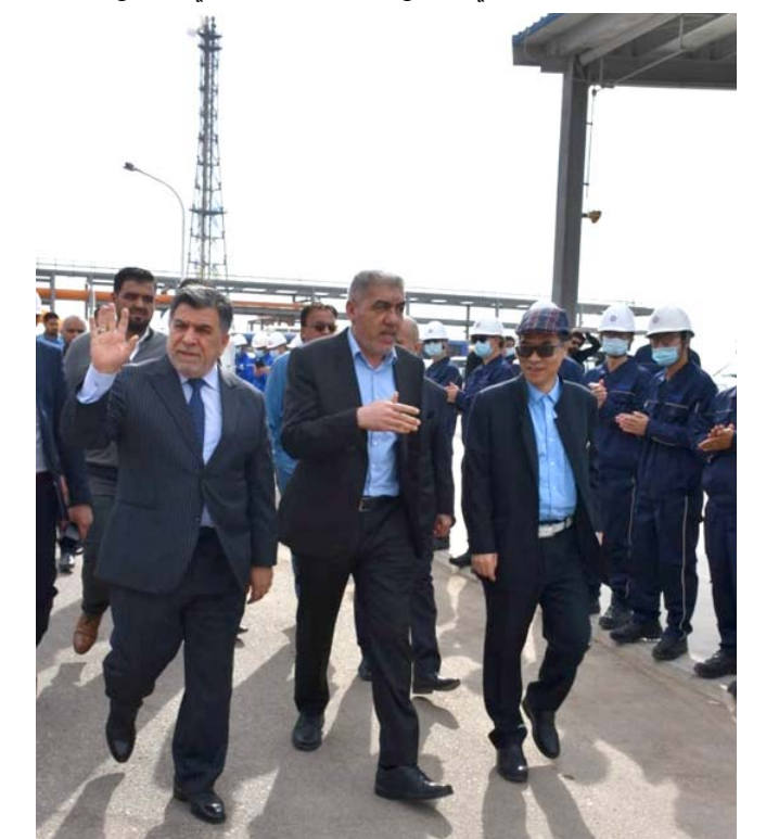
زيارة: وكيل وزارة النفط يزور شركة ميسان

ميسان - علي قاسم الكعبي وصفت وزارة النفط ، وصول طاقة إنتاج حقول ميسان إلى 300 ألف برميل يومياً عقب تشغيل معالجة المياه في حقل بزركان، بالنقلة النوعية في قطاع