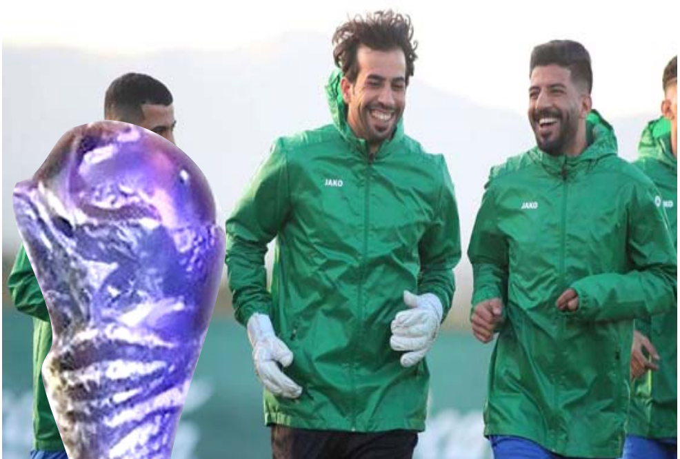
منتخب لاعبي المنتخب الوطني في وحدة تدريبية