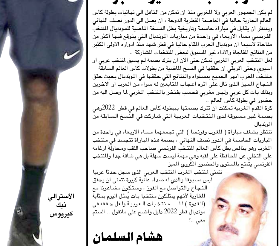
الاسترالي نيك كيريوس

مغربيه- وكالات يعتزم نجم التنس الأسترالي نيك كيريوس، الاشتراك في بطولة فرنسا المفتوحة (رولان جاروس)، لأول مرة منذ عام 2017. ويخطط كيريوس للمشاركة في النسخة المقبلة من البطولة، في ظل رغبة شركته في زيارة باريس، رغم تفضيله البقاء في أستراليا ولم يتجاوز كيريوس، الدور الثالث خلال مشاركاته السابقة في رولان جاروس، حيث سجل ظهوره الأخير في البطولة عام 2017. عندما خسر أمام كيفن أندرسون في الدور الثاني. وكان اللاعب الأسترالي قد وصف بطولة فرنسا المفتوحة بأنها أسوأ المسابقات الأربع الكبرى، ودعا إلى إلغائها نهائيًا. ورغم ذلك، يقول كيريوس إنه سيذهب غيابه الآن عن دفعه لإحسان هذا القرار، لا يتعلق بالنفس. وقال كيريوس للمخضين في السعودية "صديقي تريد زيارة باريس لذا سألعب في رولان جاروس 2023 سيكون من الجيد بالنسبة لي كسب المزيد من المال، رغم أنني كنت أفضل البقاء في المنزل". وأضاف "أعلم أنه يمكنني تحقيق نتائج رائعة على الملعب الريمانية. لقد تغلغت على فينر وفارينكا، ولعبت مباراة نهائية في بطولة أستراليا، ترغبت في التفرغ على المدينة لذا سأضطر للذهاب هذا العام. وخلال عام 2022 حقق كيريوس، اثنتين من أفضل نتائجها طوال مسيرته في الجراوند سلام، حيث خسرت نهائي ويمبلدون أمام ديوكوفيتش، قبل ان يخرج من نور الثمانية في بطولة أمريكا المفتوحة على يد كارين خاشانوف.