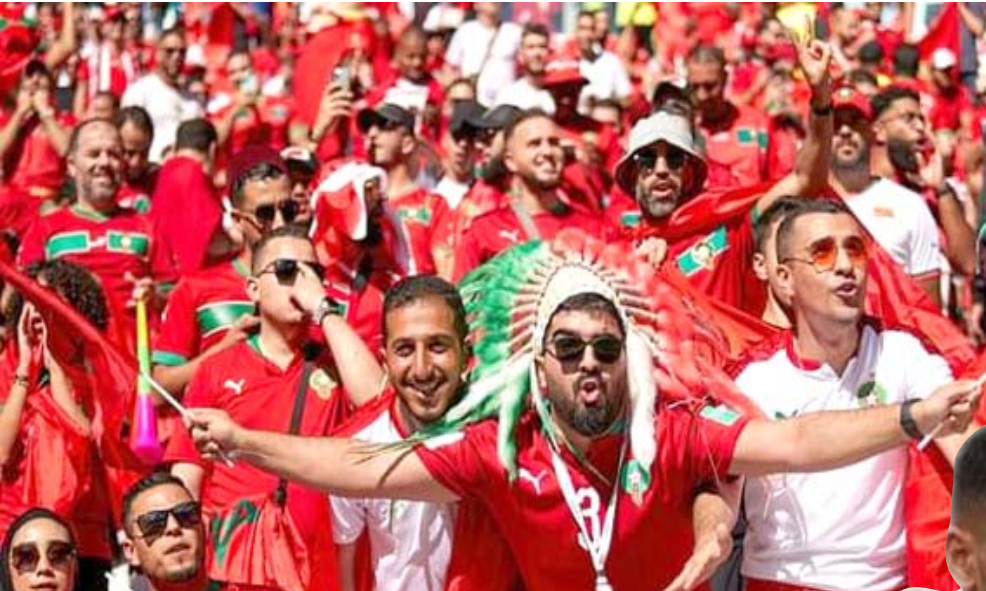
مؤازرة الجماهير المغربية تستعد لمؤازرة منتخبها لمواجهة نظيره الفرنسي