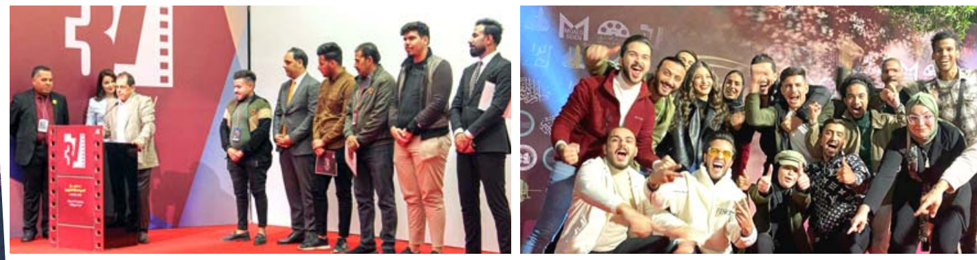
مهرجان : لقطات من مهرجان السينما والتلفزيون بكلية الفنون الجميلة