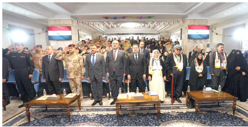
جميع دول المنطقة والعالم)، داعياً إلى (رعاية عمائل الشهداء والجرحى الذين قدموا

ضرب الخلايا النائمة، سائلاً العراقي عز وجل ان يحفظ العراق وشعبه ويمن على الشهداء البرحمة والخلود. بدوره، أشاد وزير الداخلية عبد الأمير الشمري، ببطولات القطعات العسكرية في ذكرى النصر على الإرهاب، وقال بيان تلقته (الزمان) امس انه (في الذكرى الخامسة للتحرير، نستذكر أيام البطولة والصمود ولحظات التصدي والتحدى وكيف بدأ الرجال يحيطون العراق بالحبوب والأرواح قبل حمايته وإحاطته بالإسلحة والخطط العسكرية)، وأضاف (نستعيد معاني الشرف والتضحية والبسالة التي أظهرتها كتائب المتطوعين التي