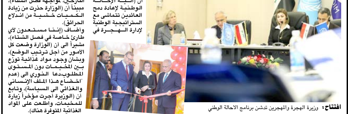
افتتاح: وزيرة الهجرة والمهجرين تدرن برنامج الاحالة الوطني