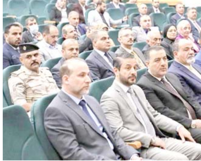
اطلاق: وزير التعليم العالي نعيم العبودي خلال حضوره اطلاق برنامج تعقب الاصول الكيميائية

وقال الوزير تعيم العبودي خلال فعالية الإطلاق ان (التعليم العالي ومؤسساتها الأكاديمية وفرت بيئة علمية لتطوير برامج ومشاريع السلامة والأمن بالتعاون مع المنظمات الدولية)، وأشار الى ان (الجامعات ومراكزها العلمية المختصة من السيطرة على تعقب المواد الخطرة وسيد من مكانة الوصول إليها أو استخدامها لتهديد البشرية والبيئة).