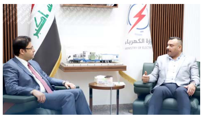
لقاء: مدير عام كهرباء الوسط خلال لقائه نائب عن الأنبار

بغداد - الزمان (الزمان) امس ان (الوزيرة إيفان فائق جابرو افتتحت في مقر الوزارة برنامج الإحالة الوطني، بحضور نائب الممثل الخاص للأمم المتحدة لدى العراق وممثل الاتحاد الأوروبي في الشرق الأوسط وعدد من وكالات الأمم المتحدة والمخيمات الولية والمحلية وسفراء دول كل من أمريكا وأستراليا ويضم الدول الأوربية. وأضاف ان (هذا البرنامج جاء بدعم من المنظمة الدولية للهجرة وبتمويل من الحكومة الهولندية)، من جانبها اكدت جابرو ان (الهيئة الإحالة الوطنية لإعادة دمج العائدين لتتماشى مع الاستراتيجية الوطنية لإدارة الهجرة في