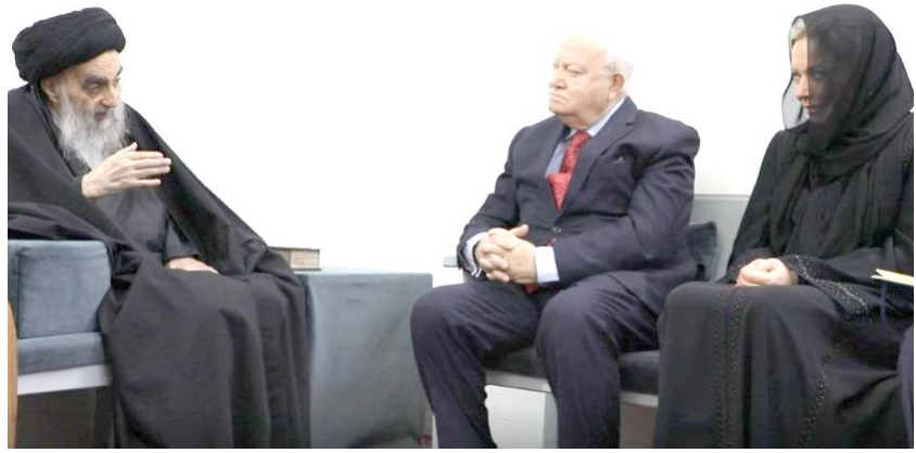
زيارة : وفد من الأمم المتحدة يزور المرجع الديني الاعلى علي السيستاني في منزله بالنجف

النجف - سعدون الجابري أوصى المرجع الديني علي السيستاني العراقيين بتعزيز ثقافة التعايش السلمي بين الأديان وتضافر الجهود في نبذ العنف والكراهية، وقال مكتب المرجع في بيان تلحقته (الزَّمان) أمس ان (السيستاني، الحثي في منزله وكيل الأمين العام للأمم المتحدة ميغيل أنخيل موراتينوس، المكلف بوضع خطة عمل المنظمة الدولية لحماية المواقع الدينية بعد الهجمات التي تعرضت لها في أماكن مختلفة في العالم