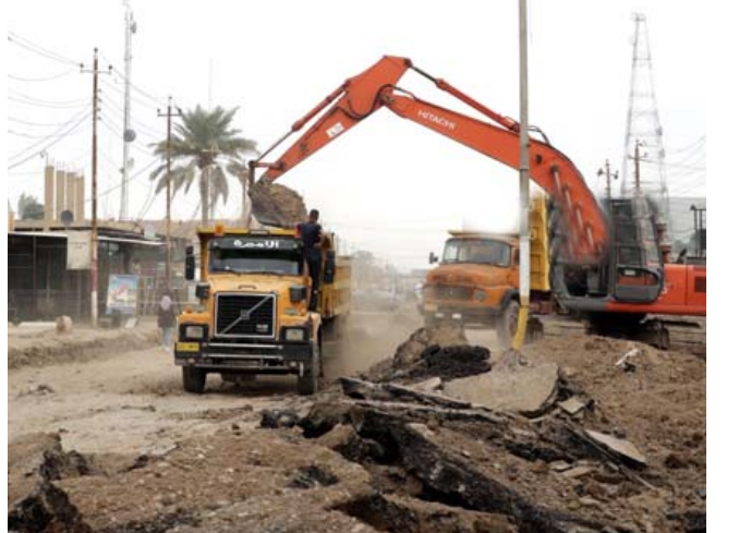
تاهيل : اليات تنفذ عمليات تاهيل شارع خدمي