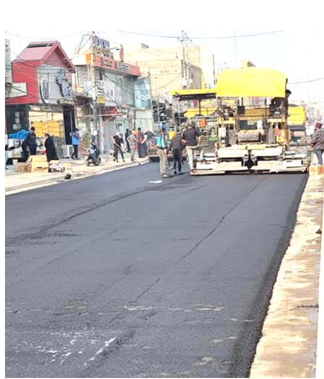
اكساء : امانة بغداد تنفذ اعمال اكساء شارع الطعمة في بلدية الدورة

(الحكومة المحلية في المحافظة، تولى اهتماما كبيرا للقطاع التربوي والتعليمي). ووضعت حجر الأساس لكليات جديدة في المجمع الجامعي ضمن خطة المحافظة، فضلاً عن كلية التربية الرياضية، ضمن جامعة كركوك.