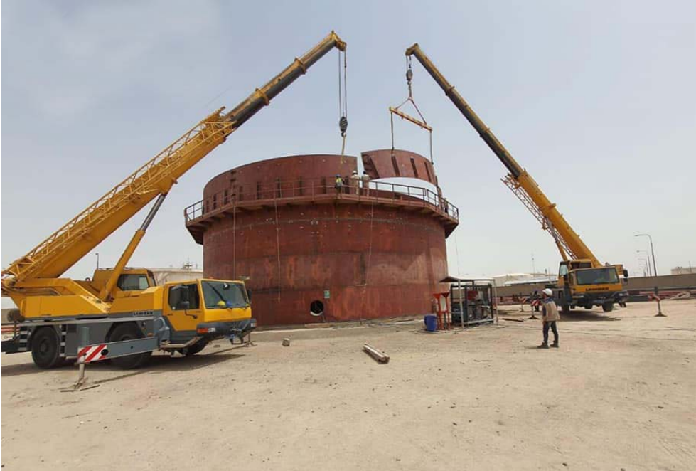
تصميم : البات النفط تشرع بتصبيب خزانات وقود عملاقة في البصرة

زئمة متفاخمة وشد كامبانيا على أن (ذلك قد يؤدي إلى تفاقم أزمة الطاقة في العالم ويثير غضب واشنطن بعد فشل جهودها الدبلوماسية لدى الرياض من أجل خفض الأسعار) إلى ذلك، أكدت شركة المشاريع النفطية اهتمامها بتطوير جودة المنتج النفطي وزيادة الطاقات التخزينية والإنتاجية للمشتقات. وقال بيان تلقته (الزمان) أمس أن الشركة تضي في أجاز مشروع إنشاء خزانات للمشتقات النفطية في مستودع الشعبية في محافظة البصرة، وأضاف أن (هذا المشروع يأتي كتكليف من الوزارة لرفع الطاقات الاستيعابية للمشتقات النفطية، ويشتمل على ثلاثة خزانات، مكملة على أساس توسعة المصفاة من الناحية التخزينية، وهي خزان لمادة البنزين بسعة 3٣٠٠٠، وآخر لمادة زيت الغاز بسعة 3٣٠٠٠، وخزان ثالث للماء بسعة 3٣٠٠٠، وتابع أن (الملاكات الوطنية أوشتت على إنجازها بالمواصفات الفنية المعتمدة وبالتوقيتات المحددة)، لافتا إلى أن (المشروع تغذيه الشركة بتسليمها هيئة مشاريع الجنوب لصالح شركة خطوط الأنابيب، وقد اقتربت من إنجاز جميع الفعاليات المرتبطة بالمشروع ومنها الأعمال المدنية والسادات والترايبية والحماية الكاثودية، فضلا عن تنفيذها شبكة الأنابيب الرابطة للخزانات وموقع العمل وشبكة ماء الحريق والرغوة، والقابليات الكهربائية من الخزانات والتي عرفت الكهرباء مع نصب لوحة توزيع والسيطرة الكهربائية).