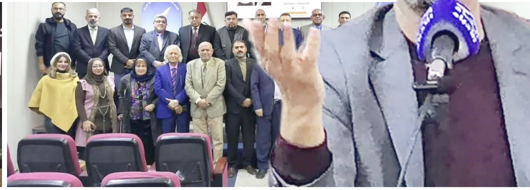
فعاليات: لقطات من جلسة الملتقى الإذاعي والمؤتمر الصحفي لمهرجان المسرح