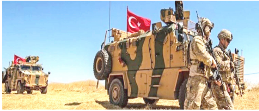
شمال : قوات تركية في شمال العراق