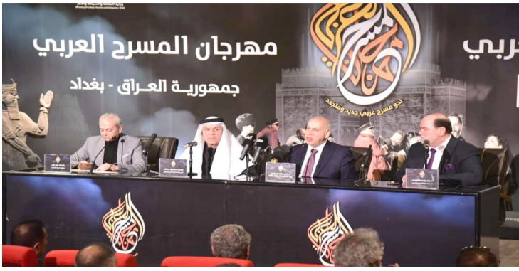
مهرجان المسرح العربي جمهورية العراق - بغداد