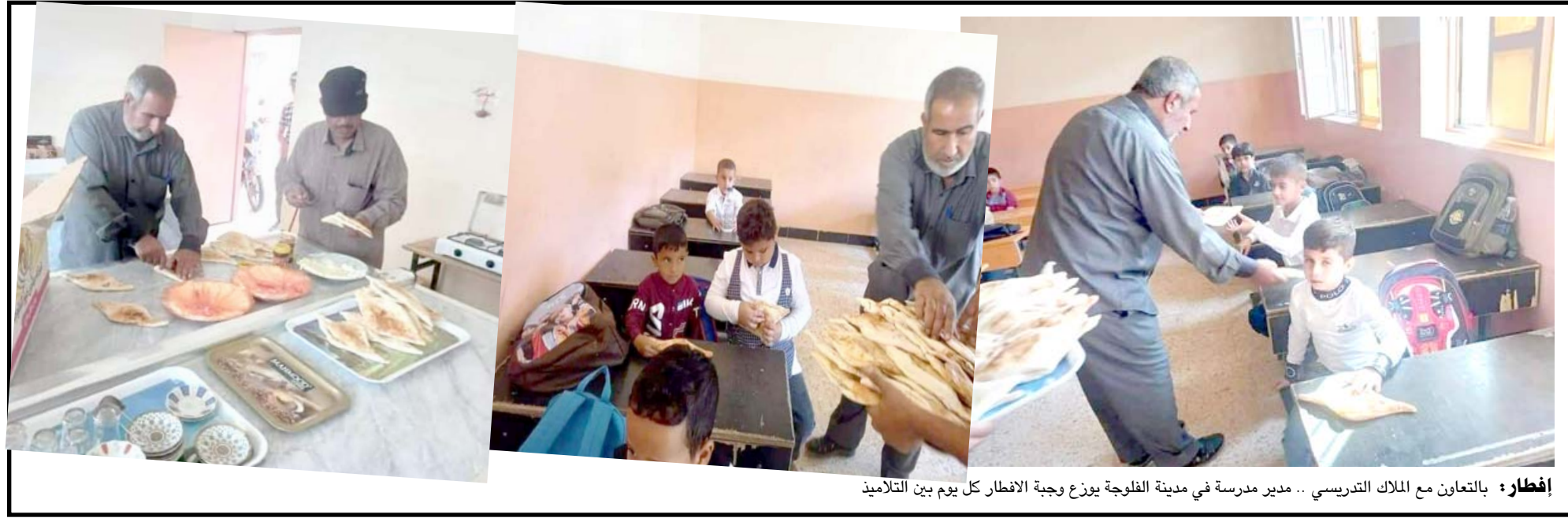
إفطاره بالتعاون مع الملاك التدريسي .. مدير مدرسة في مدينة الفلوجة يوزع وجبة الإفطار كل يوم بين التلاميذ