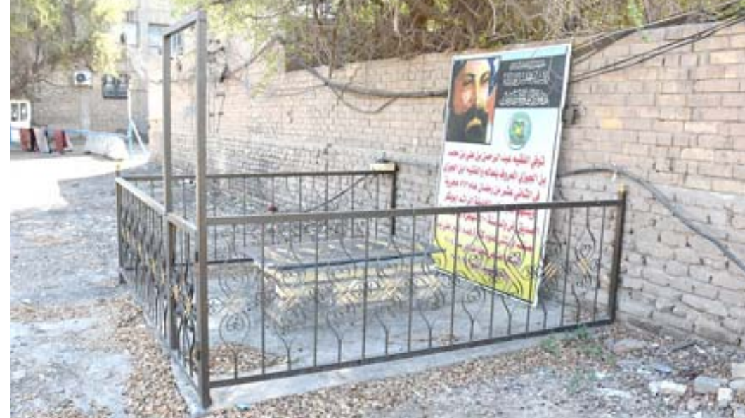
علامة : قبر العلامة ابن الجوزي في بغداد

والاصلاح. وذكر الغزي في تصريح تابعته (الزمان) امس ان (المحافظ افتتح محطة بسبعة الف متر مكعب بالساعة، وخمس مدارس جديدة في القضاء التابعين لذي قار)، مبيناً ان (مشروع محطة الماء انشا ضمن خطة تنمية الاقاليم للمحافظة، الى جانب انجاز نصب الفلاح في الدوابية، رمزاً لسور الفلاح المهم في القطاع الزراعي.