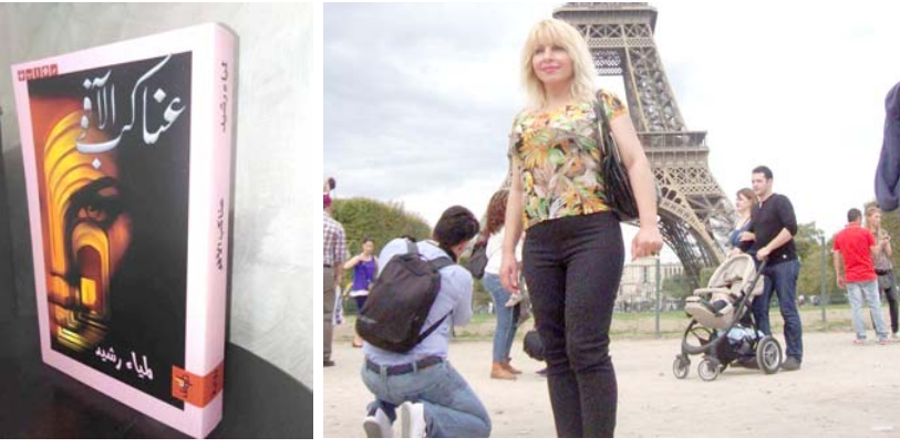
موهبة : فنادج من موهاب ليا، رشيد الفنية والادبية

□ كل انت مع التحرر من المفاهيم التشكيلية وقيمتها التقليدية ؟ وكيف تقراين ذلك من خلال الريح؟ □ اكثر الشخصوس حرية هو الفنان التشكيلي ..لايمكن للفنان التشكيلي ان يكون بارعا مالم يؤمن بالحرية والتحرير ..الفنان انسان خالق بإمكانه ان يخلق مايشاء على الكانفس.. مثله مثل الكاتب لكن الاختلاف الوحيد بينهما ، ان الكاتب تحكمه احيانا توجهات المجتمع او تقاليده او سياسات بلده فلايكون على سجيته ،بينما التشكيلي بإمكانه ان يقول مايشاء وقتما يشاء من خلال التمرد على المفاهيم التقليدية، فهو بالتجريد والتعبير والتوحش والانطباع والتعبير وكل الاساليب الفنية، يعكس القيدود ويجسد حريته دون ان تحكمه القيدود الاجتماعية والسياسية وحتى الاسرية والدينية ... □ انه العالم الذي يخرج فيه الفنان عاريا من كل شيء وتكون فريساته هي ورقة التوت التي تستر عورة التقيدود، انما مع التحرير من كل المفاهيم التشكيلية التي قيدت الفن عقودا وجعلت من يؤمن به صداه لاحقا في اغراق ...هكذا الفنان ايضا ،انا اؤمن بان اروع لحظات الفنان هي تلك التي يعلا بها الفراغ دون تخطيط مسبق لغاية فثاني النهائية غير ما يتوقعه ودوما ماتكون فوق التصور.