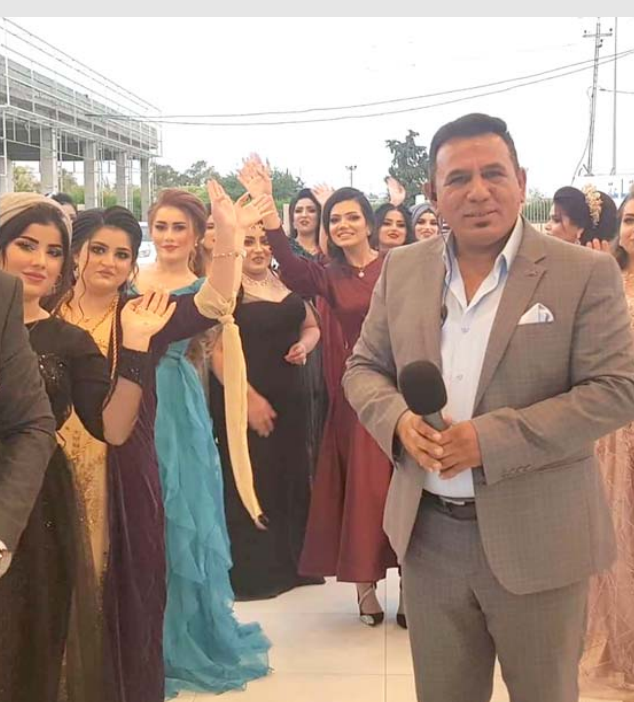
تخرج : الاعلامي في حفل التخرج

كركوك - شيماء عاشور الغي اعلامي عراقي معروف فقرة متعارف عليها منذ زمن طويل في حفلات التخرج تسمى برمى القبعات معللا ذلك بان القبعة هي رمز وتاج التخرج ورمز النجاح ولا يصح ان ترمى على الارض . وقال الاعلامي فراس الحمداني ل(الزمان) امس ان (فقرة رمي القبعات المتخرج عليها منذ زمن طويل في حفلات التخرج الجامعية في ظاهرة غير حضارية وغير صحيحة لأن القبعة تعتبر رمزاً للتخرج وتاجاً يعتمده المتخرج يعبر فيه عن نجاحه في مملكته الجامعية ولا يوجد ملك او امير برمى تاجه ولذا فانا وفي كل حفلات التخرج التي تم تكليفها بعراقها وادارتها اعلاميا في مختلف الجامعات العراقية قد الغيت فقرة رمي القبعات وهو ما نال استحسان الطلبة والأساتذة والجمهور). واضاف الحمداني ان (الإلغاء الذي عمدت اليه لم يولد فراغ لانني استحدثت فقرة اجمل وهي رمي السورود فسوق رؤوس المتخرجين بدلا من القبعات