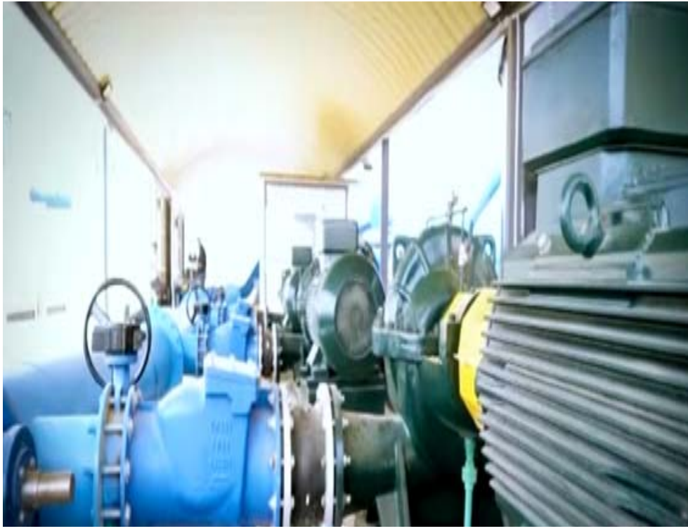
مشروع: معدات مشروع الماء في الدواية

خطة تنمية الاقاليم في المحافظة . كذا ازاح الغزّي الستار عن نصب ( الفلاح ) في الدواية والذي يرمز للدور الكبير للفلاح خصوصا والقطاع الزراعي بشكل عام في دفع حركة الاقتصاد والنهوض في البلاد . افتتاح مدارس وقال بيان تلقته (الزمان) امس ان (الغزّي) افتتح كذلك خمس مدارس جديدة في قضاء الاصلاح ضمن خطط انعاش الاهوار. من جهة اخرى وقال مدير زراعة ذي قار صالح هادي ان (مشاريع) انتاج بيض المائدة وحقول تربية الدجاج انتجت اكثر من 9 ملايين من بيض المائدة للاسواق و 800 طن من لحوم الفروج. وذكر انتاجها من 18 حقل خلال شهر واح للفطرة الممتدة من الرابع والعشرين من ايلول الماضي وحتى الرابع والعشرين من تشرين الاول الحالي. واضاف، ان (118) حقلًا لانتاج