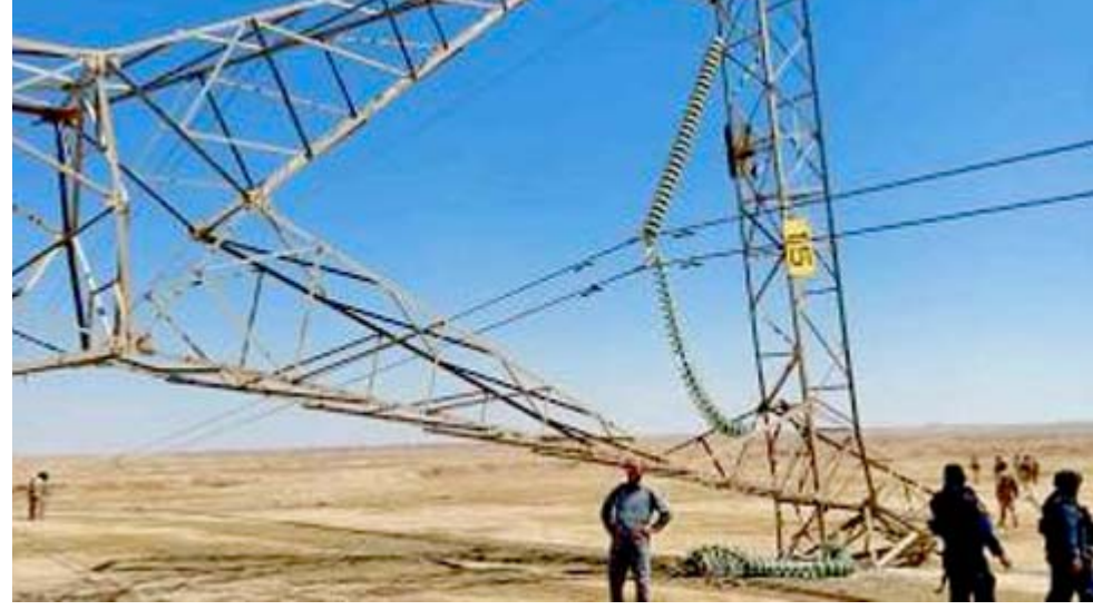
تخريب: أبراج نقل الطاقة قرب المسيب تعرض لعملية تخريب

في المنشآت وحقول المنطقة الشمالية، مؤكداً ان (الزيارة تاتي ضمن المتابعة الميدانية لتفقد عدداً من المواقع والمشاريع والمنشآت النفطية واللقاء بالمسؤولين في الشركات النفطية الوطنية والمسؤولين في المحافظة).