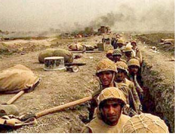
حرب: صور أرشيفية من المارك التي جرت خلال الحرب العراقية الإيرانية