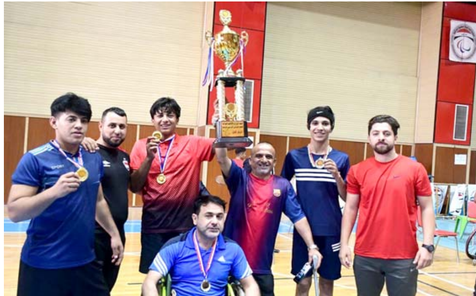
طائرة: المكرميين في بطولة الريشة الطائرة