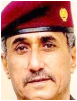
عبد الوهاب الساعدي

منح رئيس جهاز مكافحة الإرهاب الفريق الأول الركن عبد الوهاب الساعدي، مراتب الجهاز رتبة واحدة أعلى. وقال بيان تلقته (الزمان) أمس أن (الساعدي) قرر منح المراتب المنتسبين رتبة واحدة أعلى، شتمنياً لجهودهم في مكافحة العصابات التكفيرية). وأشار إلى أن (ذلك جاء، استناداً إلى المادة 36 ثالثاً من قانون الخدمة والتقاعد العسكري لسنة 2010) وصادق رئيس أركان الجيش الفريق أول ركن عبد الأمير يارالله، في وقت سابق، على منح القدم لضباط والموظفين ورتبة أعلى للمراتب.