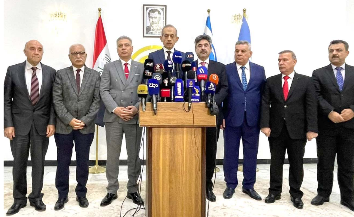
مؤتمر قادة الكتل التركيبية في مؤتمر صحفي أمس للمطالبة باستحقاقهم في الحكومة المرتقبة

الوزراء في جلسة البرلمان غدا الثلاثاء وقال شيرزاد صمد في تصريح أمس ان (اتفاقاً سياسياً على تمرير كابينته الحكومية على يوم غد الثلاثاء، بعد ان تم إكمال الكابينة الوزارية). مؤكداً ان (الاتحاد الوطني طالب بوزارتي العدل والهجرة والمهجرين، وهناك انسجام وتوافق وتفاهم مع السوداني وقبادات الاتحاد). وتابع ان (هناك توجه لمنح الهجرة والمهجرين اما لمحتلي قضاء سنجار او الموصل تخميناً لموافقهم). في غضون ذلك رجح عضو الاطار التشريعي، تمرير الكابينة، في اقرب جلسة لمجلس النواب. وقال عائد الهلالي في تصريح أمس ان (الكابينة الوزارية لم تجهز ولكن يمكن ان تمر بنفس زائد وفي اقرب جلسة