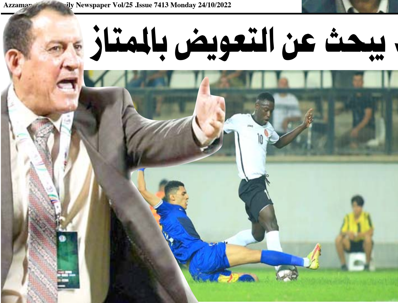
دوري: إحدى مواجهات الدوري الممتاز بكرة القدم

في الصف الأول عندما يلتقون المحترف نطف ميسان السادس بسبع نقاط ويبحث الخنف مدعوما بارضه وجهوره عن الفوز الأول على حساب المنتخب الصناعي ويسعى اربيل وضع حد لمسلسل تراجع النتائج عندما