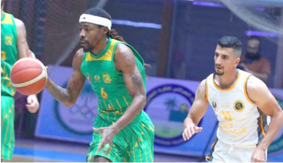
سلة: منافسات دوري كرة السلة الممتاز