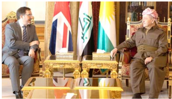
اريل - فريد حسن

بحث رئيس الحزب الديمقراطي الكردستاني مسعود البارزاني، مع السفير البريطاني لدى العراق مايك برايسون وريتشاردسون، التطورات التي تشهدها الساحة السياسية بعد انتخاب رئيس الجمهورية. وذكر بيان تلقته (الزمان) أمس أن (البارزاني استقبل في مصيف صلاح الدين بباريل، السفير البريطاني بحضور القنصل العام بديفيد هنت والوفد المرافق لهما، وجرى التباحث في آخر التطورات التي تشهدها الساحة السياسية بعد انتخاب رئيس الجمهورية). كما التقى رئيس حكومة اقليم كردستان مسرور البارزاني، وريتشاردسون.