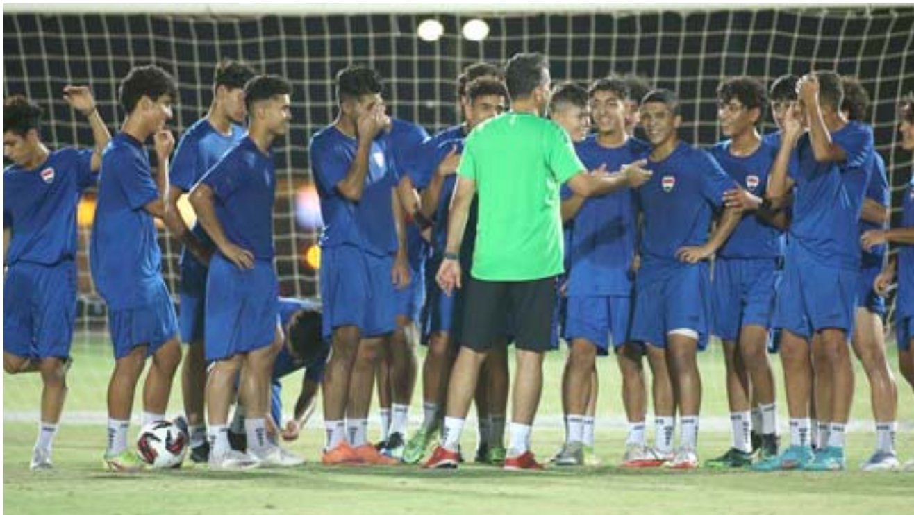
تدريبات: منتخب الناشئين يجري تدريباته لمواجهة نظيره اللبناني

قائمة امام ثلاث مباريات متبقي ويأمل ان تمكنه من البقاء في المنافسة على إحدى تذكري التاهل للدور التالي وسيكون الجهاز التدريبي مطالب في الاختيار الدقيق لتشكيل لقاء اليوم الذي سيكون غاية الأهمية وخوضه يشعر لا بد من الفوز للابقاء على حظوظ الفريق في المنافسات وهذا يتوقف على نوع الأداء وجهود من سيمثل الفريق في مهمة لم تكن سهلة لابل ان جميع المواجهات المتبقية غاية في الصعوبة ومهم ان يتسلح اللاعبون بالعامين النفسي والفني وتجديد الثقة بجميع اللاعبين امام الطموحات المشتركة لجميع فرق المجموعة والأهم الظهور المطلوب امام لبنان هو الخروج بالفوز و بكامل النقاط التي ستضعه في وضع افضل وان ذلك سيمخخ الفريق مركز افضل في الترتيب تبقى في المجموعة والعودة لمسار المنافسة وهذا مرهون بنوع الأداء الذي سيقدون الى النتيجة المنتظرة والتأكيد على دور المجموع في تحمل المسؤولية والدفاع عن الفريق الذي من يفتره اعداد مناسبة من خلال المشاركة بطولية العرب في الجزائر وإقامة معسكر اعداد البطولة الحالية في وهران ويأمل ان يحقق الفريق مامطلوب منه والتعبا بعدها لمواجهة البحرين ولكل مباراة ظروفها لكن الإهم ان يكون اللاعبين في الوضع الصحيح والتصميم على الخروج بفوائد المباراة التي تشكل تحد للفريق واللاعبين والمدير وان بغير الفوز فيها سيزيد الامور تعقيدا لكن يامل