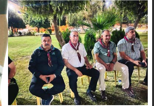
مخيم: ورشة تدريبية للمخيم الكشفية في الموصل