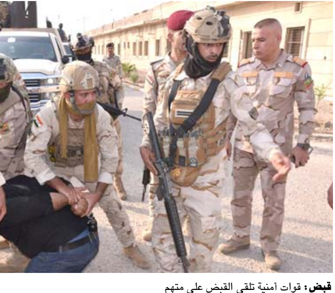
قبض: قوات أمنية تلقي القبض على متهم

وأفادت الدائرة في بيان تلقتّه (الزمان) ، بـ ( قيام مَلاكات مكتب تحقيق ديالى بكشف مخالفات في عملية صرف رواتب الخبراء العاملين في مديرية بلدية المقدادية، استناداً لقرار مجلس الوزراء رقم 315لسنة