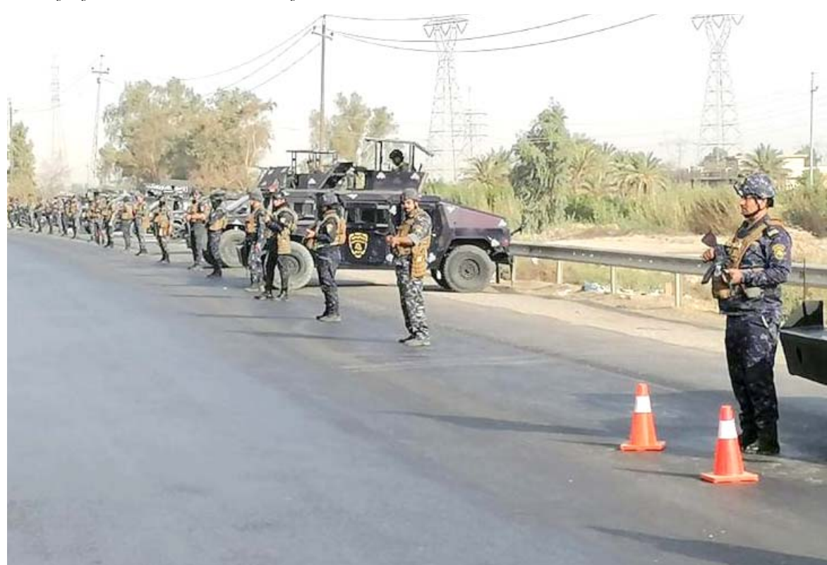
ممارسة : قوات من الشرطة الاتحادية في ممارسة أمنية داخل بغداد

المحافظات - مراسلو (الزمان) نفذت القوات الامنية فجر امس، ممارسة جديدة ضمن اجنبي الكرخ والرصافة ببغداد، شهدت خلالها اغلاق بعض الطرق والجسور، وفاد شهود عيان ان (قطعات الجيش لا تزال منتشرة بشكل غير مسبوق على طريق القناة ومن جهة السريعة باتجاه طريق محمد القاسم، برغم ان الايام الماضية قد شهدت نفس الممارسات الأمنية)، مؤكدا ان (هذا الانتشار يثير قلق المواطنين من دون معرفة الاسباب التي دفعت الجهات العليا إلى استنفار القطعات