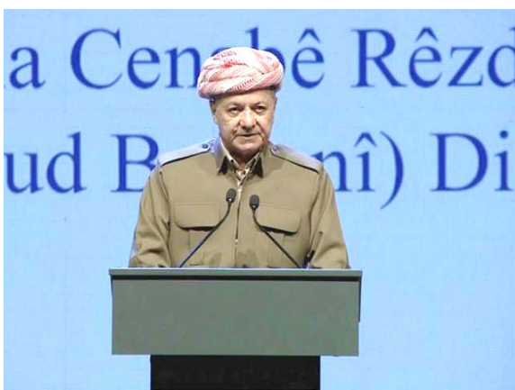
كلمة : مسعود البارزاني يلقي كلمة في مهرجان دھوك الثقافي

الإطلاق، وإن الانخفاض القياسي في نسبة المشاركة البالغة 43.5% حسب المصادر الرسمية قوض إلى حد واضح الشريعة البرلمانية، كما يمكن النظر إلى الإنسداد السياسي القائم على انه علامة سبئية لتقدم الديمقراطية في البلاد، لاسيما انه أفضى إلى أعمال عنف و صدام موضعي في اعتصام البرلمان، فضلا عن انه ليس لدى أي من الجماعات أي حافز للتخلي عن أي شيء أو لزيادة الضغط، ذلك أن احتمالات العنف تظل مرتفعة إذا تغير الوضع مرة أخرى، فالمعرك السياسي الآن هي داخل الطائفة ويتنافس كل طرف مع خصومه الداخليين، وهذا يجعله صراعا من أجل البقاء، وبالتالي يصبح الأمر أكثر حدة وخطورة ويجعل السياسة أكثر صعوبة، وتضمن المؤشر الذي يستند إلى نتائج المسح الميداني الذي أجراه المركز وشمل استطلاع 1200 مواطن في عموم المحافظات (خمس) محاور لقياس مستوى الديمقراطية النظام السياسي وهي الأداء الحكومي وحكم القانون والاستقرار الاقتصادي والسلوك الانتخابي والحقوق والحرية).