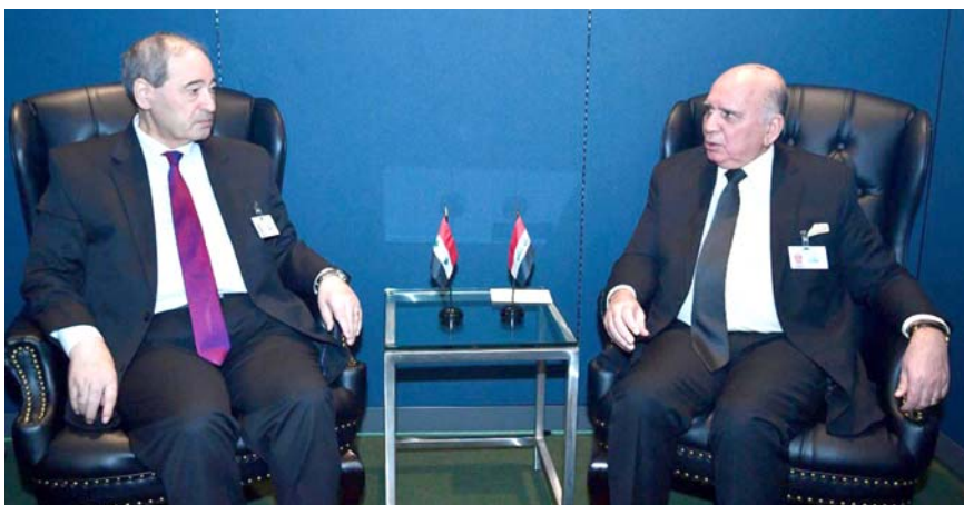
لقاء : وزيراً خارجية العراق وسوريا خلال لقائهما في نيويورك امس

(أهمية التعاون العلمي والثقافي بين بغداد وهافانا، وتوقيع مذكرات التفاهم في مختلف المجالات)، وتابع البيان ان (اللقاء ناقش مضامين التعاون أيضاً في المواضيع المطروحة على اجندة الأمم المتحدة، في دورتها الحالية، والدعم المتبادل بين البلدين في المنظمات والمؤتمرات الدولية والقضايا التي تتعلق بالعضوية والترشح، بالإضافة إلى مناقشات تطرقت إلى الوضع الاقتصادي والسياسي، والاستعدادات الجارية لتولي كونا رئاسة مجموعة 77+ الصين، وكذلك رئاسة العراق للمجموعة