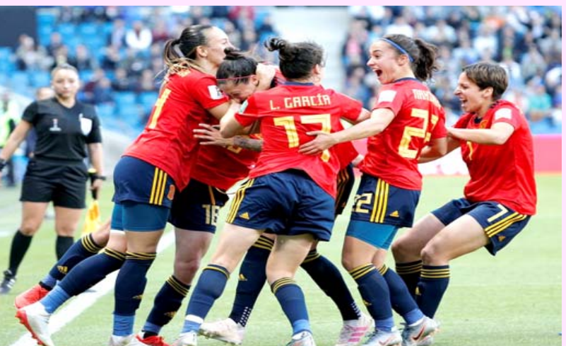
منتخب إسبانيا للسيدات

الرياضية. هذا النوع من المناورات بعيد بشكل كبير عن قيم كرة القدم والرياضة كما أنه يسبب الضرر. وتابع الاتحاد: وفقاً للوائح الحالية، فإن عدم تلبية الاستدعاء للمنتخب الوطني يصنف بأنه انتهاك خطير وقد يسفر عن عقوبات الإقصاء لفترة تتراوح بين عامين وخمسة أعوام.