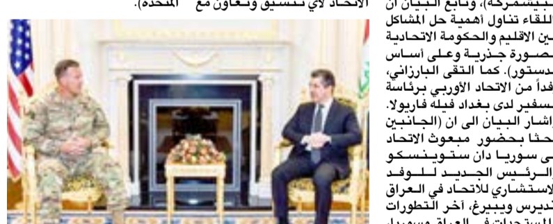
استقبال، رئيس حكومة إقليم كردستان يستقبل مسؤولاً عسكرياً أمريكياً

وسوريا ماثيو ماكفرلين، (بحث آخر مستجدات الوضع العام في العراق، وسبل تعزيز العلاقات الثنائية)، وأشاد كوريل بر (تضحيات قوات البشمركة في نجر داعش، وأكد التزام بلاده في الدعم المستمر للبشمركة). من جانبه، وجه البارزاني (شكره للقوات المسلحة وقوات التحالف الدولي على ما يقدمانه من دعم ومساندة، كذلك عرض نيّدة عن العملية الإصلاحية التي شرعت بها التشكيكية الوزارية التاسعة، ولا سيما الإصلاحات في وزارة الأمن الإقليمي، وفتح المجال ان (اللقاء تناول أهمية حل المشاكل بين الإقليم والحكومة الاتحادية بصورة جذرية وعلى أساس الدستور). كما الأوربي بارزاني، وفداً من الاتحاد الأوربي برئاسة السفير لدى بغداد فيله فاربول. وأشار البيان ان (الجانين بحثا بحضور مبعوث الاتحاد إلى سوريا دان ستونينسكو والرئيس الجديد لسوقد الإستثماري لاتحاد في العراق اندريس وبيبرغ، أقر التطورات والمستجدات في العراق وسوريا، فضلاً عن مناقشة سبل تعزيز العلاقات بين الإقليم وأوروبا،