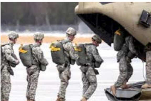
جنود امريكيين يستقلون طائرة حربية

ويعد الانتسحاب الأمريكي الدراماتيكي من أفغانستان في أغسطس/ آب 2021 وصلت عائلة زعيم تنظيم القاعدة أيمن الظواهري إلى أفغانستان بعد 3 أشهر من الانسحاب الأمريكي من البلاد، وجرى تسكينهم بمنزل عاش فيه اثان من كبار مساعدي الرئيس الأفغاني السابق أشرف غني، ولحق بهم زعيم القاعدة أيمن الظواهري بعد ذلك، حيث أقاموا في المنزل قبل فيه "الظواهري"، بتسنيق ومعرفة مساعدي وزير الداخلية الأفغاني سراج الدين حقاني، القيادي البارز بشبكة علاقاتها بتنظيم القاعدة حتى الآن.