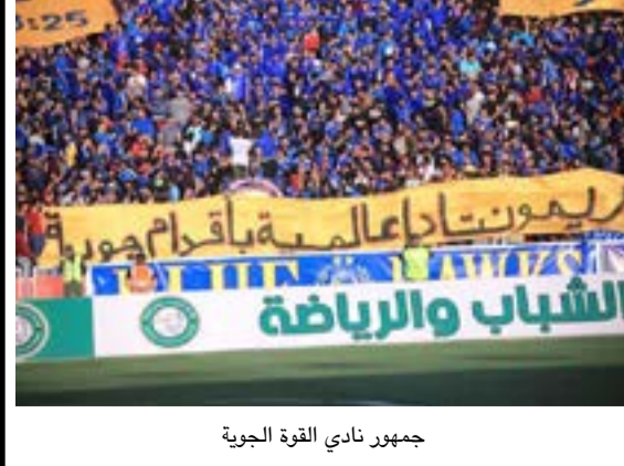
جمهور نادي القوة الجوية