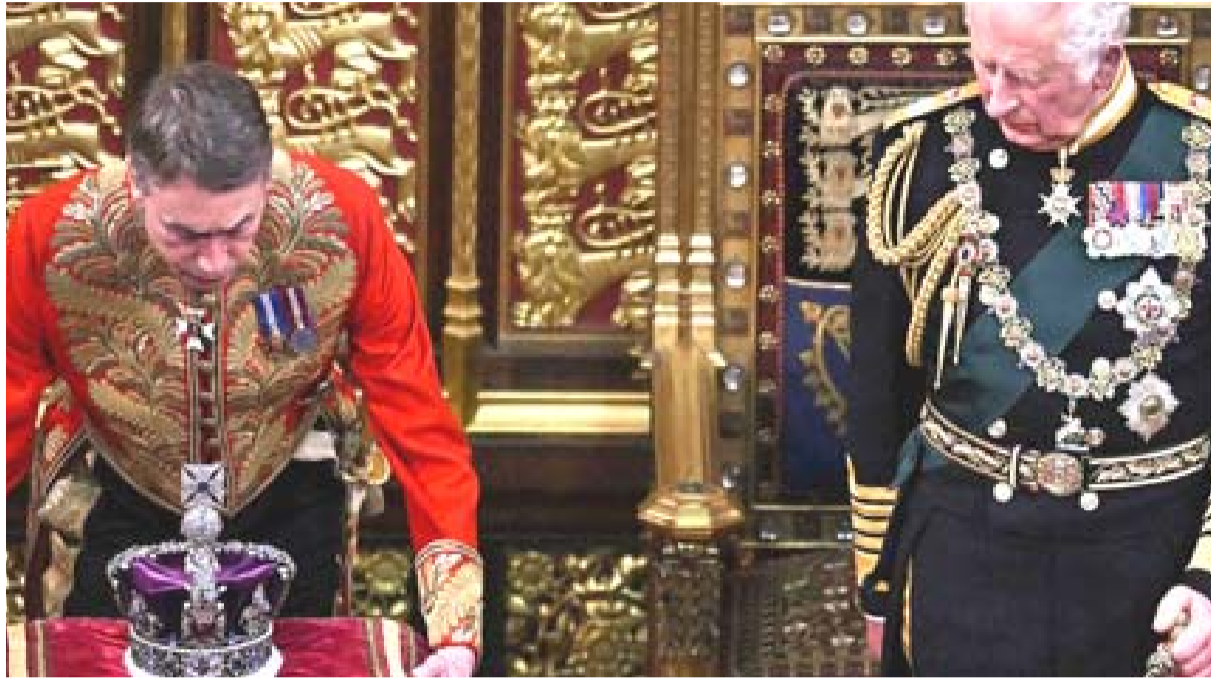
ورث: الملك البريطاني الجديد تشارلز الثالث وريث العرش

□ لندن- (ا ف ب) - بعد وفاة الملكة إليزابيث الثانية، يرث تشارلز العرش وأيضاً ثروة والدته الكبيرة التي سيحصل عليها من دون الحاجة إلى دفع ضريبة نقل الميراث، في امتياز مخصص للخلافة الملكية ماذا تملك الملكة؟ رغم عدم وجود أي شرط يلزم ملوك بريطانيا بالكشف عن مواردهم المالية الخاصة، فقد تم تسليم معلومات نشرتها صحيفة "سنداى تايمز" بأن ثروة إليزابيث الثانية الشخصية بلغت 370 مليون جنيه أسترليني عام 2022 بزيادة قدرها خمسة ملايين جنيه أسترليني عن العام السابق.