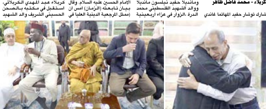
أربعينية، وفود اجنبية وعربية تصل الى كربلاء للمشاركة بزيارة الأربعينية

ومانديلا حفيد نلسون مانديلا ووالد الشهيد الفلسطيني محمد الدرّة، الزوّار في عزاء أربعينية شارك توشار حفيد الماهاتما غاندي