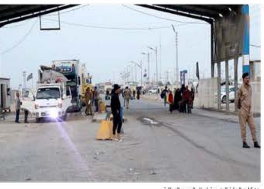
معمل، الدواب الرئيسية لشحن البضائع العراقية