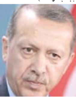
رجب طيب اردوغان

القبط على مطلوين وضبط طائرة مسيرة. ونكر بيان تلقته (الزّمان) اسم أنه (ضمن الخطة الأمنية الخاصة بتأمين الحماية للزيارة الأربعينية، الفت المفقان المشتركة في القيادة، القبض على 25 متهماً وفق مواد قانونية مختلفة بينهم متهمون بحيازة الأسلحة والاعتدة غير المرخصة ومتاجرون بحيازة المواد المخدرة والسموم، بالإضافة الى ضبط طائرة درون وكعبة من مادة الكريستال المخدرة واجهزة تعاطها وحبوب مخدرة مختلفة الأنواع ومصادرة 7 أسلحة وبنادق ومخازن فارغة)، وتابع ان (مفارز مديرية شؤون السيطرات، تمكنت من إلقاء القبض على متهمين، احدهما متهم وفق المادة أربعة ارضاب خلال التفتيش الدقيق للاشخاص والمركبات وتفعيل حسابات