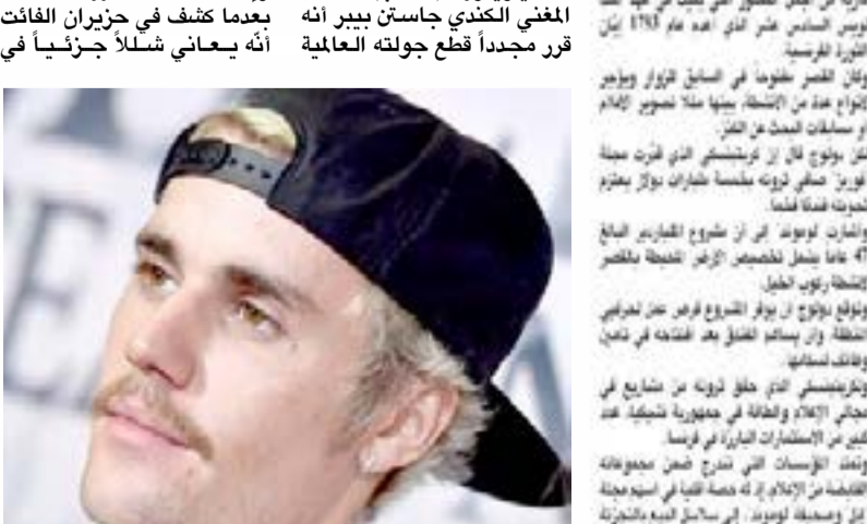
جاستن بيبير يلغي جولته العالمية وحفلاته مجدداً

لبرازيليين (كفن) عندما غادرت المسرح ككت منهاك وانركت أن صحتي يجب أن تكون أولوية. وأضاف لدا ساخن استراحة من جولتي في الوقت الراهن. ستسير الأمور على ما يرام ولكنني بحاجة إلى الراحة التي كان من المقرر أن تستمر لأشهر بتحسن. ولم يشعر صاحب أغنية بيتشنز إلى موعد محدد لمعاودة حفلاته التي كان من المقرر أن تستمر إلى آذار المقبل وكما كانت لتستمر وتوقفت جاستن بيبير (كفن) عندما غادرت المسرح ككت منهاك وانركت أن صحتي يجب أن تكون أولوية. وأضاف لدا ساخن استراحة من جولتي في الوقت الراهن. ستسير الأمور على ما يرام ولكنني بحاجة إلى الراحة التي كان من المقرر أن تستمر لأشهر بتحسن. ولم يشعر صاحب أغنية بيتشنز إلى موعد محدد لمعاودة حفلاته التي كان من المقرر أن تستمر إلى آذار المقبل وكما كانت لتستمر وتوقفت