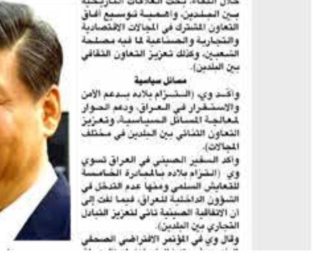
السفير خليل إبراهيم النوازي، والرئيس