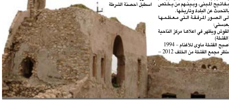
سوق القشلة في القوش

فيها الظلم والاعتداء على حقوق الاهالي فيها وفي القرى المحيطة من كل الملل والنحل. ابتداء من عام 1980 ترك المبنى بعد بناء مركز بديل فوق تل يسمى محليا ( رومته دمشلماني ) شرق البلدة في بداية طريق دير السيدة حافظة الزروع، والتل اغلب الظن فيه من الآثار المطمورة التي لم يخرجها، لذلك بات ضروريا اشاء مكان منظم ومصمم هندسيا لابقاف السيارات، اضافة الى حل مشكلة النوازع الضيقة والخربة التي توصل اليه، وبناء نقطة حراسة في المنطقة، وتنظيم وعمل ادارة ومشرفين يديهم مفتاح المبنى، وبيئتهم من تخصص بالتحدث عن البلدة وتاريخها. الى الصور المرفقة التي معظمها بعديتي: