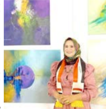
رئيس دائرة الثقافة في المشاركة حضر فعاليات ختام ملتقى الشارقة للسرد بدورته الثامنة عشرة التي استضافتها مصر على مدى يومين، تحت عنوان (التخيل السرد في الرواية العربية المعاصرة).

اختتمت في رومانيا فعاليات المهرجان الدولي للرسم في دورته 18 أثورة الفنان التشكيلي الراحل (لوسيان غريغوريسكو) والتي أقيمت في مدينة الميديجيدا، مسقط رأس الفنان الراحل تخليداً لذكراه اختتمت في رومانيا فعاليات المهرجان الدولي للرسم في دورته 18 أثورة الفنان التشكيلي الراحل (لوسيان غريغوريسكو) والتي أقيمت في مدينة الميديجيدا، مسقط رأس الفنان الراحل تخليداً لذكراه اختتمت في رومانيا فعاليات المهرجان الدولي للرسم في دورته 18 أثورة الفنان التشكيلي الراحل (لوسيان غريغوريسكو) والتي أقيمت في مدينة الميديجيدا، مسقط رأس الفنان الراحل تخليداً لذكراه