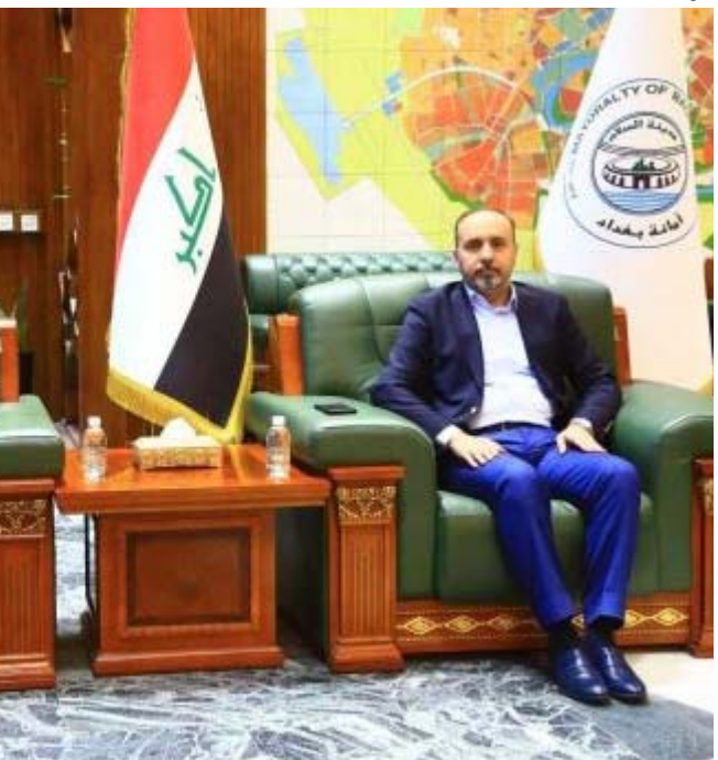
لقاء امين بغداد ومحافظ بغداد يبحثان التعاون المشترك

التعاون المشترك لتنفيذ مشاريع البنى التحتية في مناطق اطراف العاصمة. وذكر بيان لقتته (الزمان)