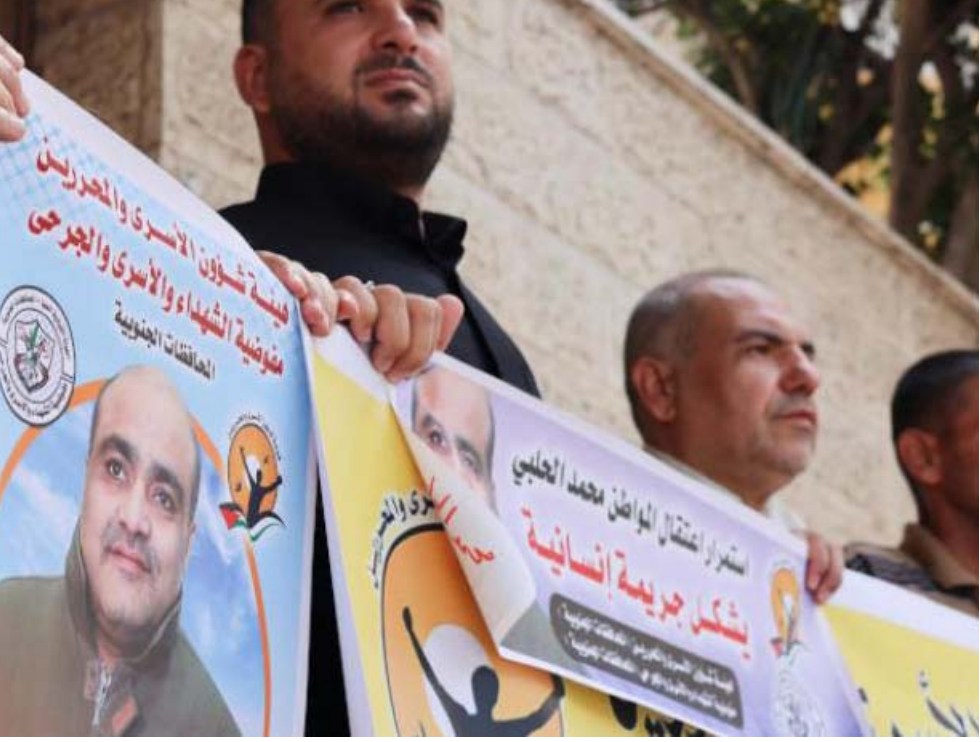
مطالبة فلسطينيين يطالبون بالإفراج عن الحلبي في غزة

مطلوبون مؤكدا اعتقال شخصين (ب) - اصيب إسرائيليان بالرصاص للاشتباه بإطلاقهما النار كما صانر أسلحة ويحسب مراسل فرانس برس فإن نيراناً كثيفة غطت المنطقة في قرية روجيب هذا وأكدت جمعية إرسعاف الهلال الأحمر الفلسطيني في بيان مقتضب تعامل طواقمها مع أربع إصابات بالرصاص الحي في مواقع قريبة أصيب خلالها أربعة فلسطينيين. أضرار فار وأوضح الجيش الإسرائيلي أن إسرائيليين دخل صباح الثلاثاء من دون تنسيق إلى مدينة نابلس .. وأصيبا برصاص اطلق باتجاههما. ونُقل السرجان إلى مستشفى في وسط إسرائيل على ما أفاد مسؤولون في الأجهزة الاستشفائية الإسرائيلية وكالة فرانس برس وأوضح مصدر لوكالة فرانس برس في المكان أن فلسطينيين أضرموا النار في سيارة الإسرائيلييين في نابلس ولا يزال الوضع متوتراً في المنطقة الواقعة في شمال الضفة الغربية المحتلة منذ 1967. وقبر يوسف رفعت بقية اليهود لاعتقادهم أنه يوزي رفعت النبي يوسف ابن يعقوب. ويعتقد الفلسطينيون أن هناك نسيج حكم عناش حياته وتوفي أثناء الحكم العثماني. ويقع الموقع على مقربة من مخيم يافا وعسكر لاجئين الفلسطينيين في شرق مدينة نابلس في الضفة الغربية المحتلة وتجري في أكثر الأحيان مواجهات حوله بين الجيش وشبان فلسطينيين ويواكب الجيش الإسرائيلي مجموعات من المحتلين الإسرائيلييين لزيارة الموقع ومنعهم من التوجه إليه بفردهم وفي حادث ثان غير مرتبط بعملية إطلاق النار على القبر، أكد الجيش اندلاع اشتباكات شرقي مدينة نابلس صباح الثلاثاء بعدما اهمت القوات الإسرائيلية منزلًا لوال الجيش في بيان استخدم الجيش وسائل من بينها صواريخ تطلق من على الكنت على مبنى تحصن فيه