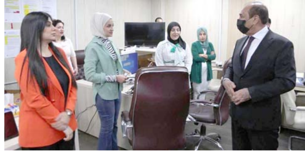
زيارة: وزير النقل خلال جولة ميدانية لقر شركة الخطوط الجوية العراقية

خطوة مهمة لتوسيع حركة النقل الجوي بين العراق وإيران، وتنشيط الحركة التجارية والسياحية بين