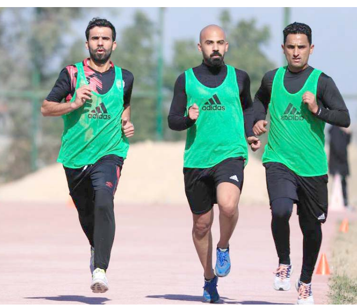
تدريب : حكام عراقيون في وحدة تدريبية