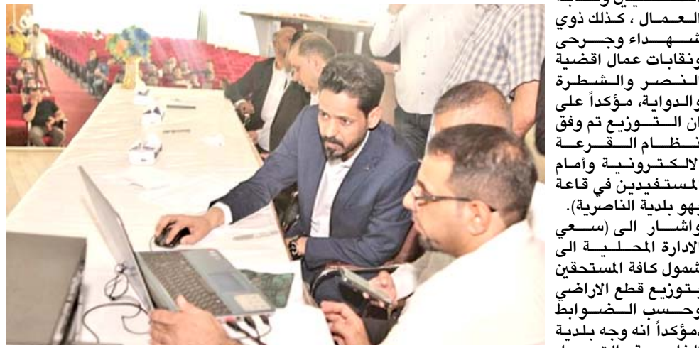
اشراف: محافظ ذي قار خلال اشرافه على توزيع قطع الاراضي

مقاطعة لعدد من الشرائح المستحقة لتوزيعها ضمن الوجبات القادمة، وزار الغزي، مركز الحياة للتعافي وعلاج الإدمان والتعاطي، والذي يعد المركز الأول من نوعه لتأهيل المرضى، والتقى الراقيين هناك وتشارك معهم بتناول وجبة العشاء. وقال خلال لقاء جمعه مع عدد من الراقيين ان (محافظة ذي قار تقف معهم وتساندهم على اتخاذ قراراتهم الشجاع بترك