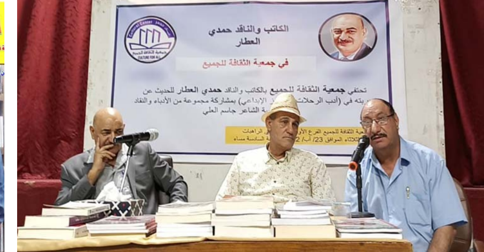
حفل جانب من الاحتفاء بجمدي العطار