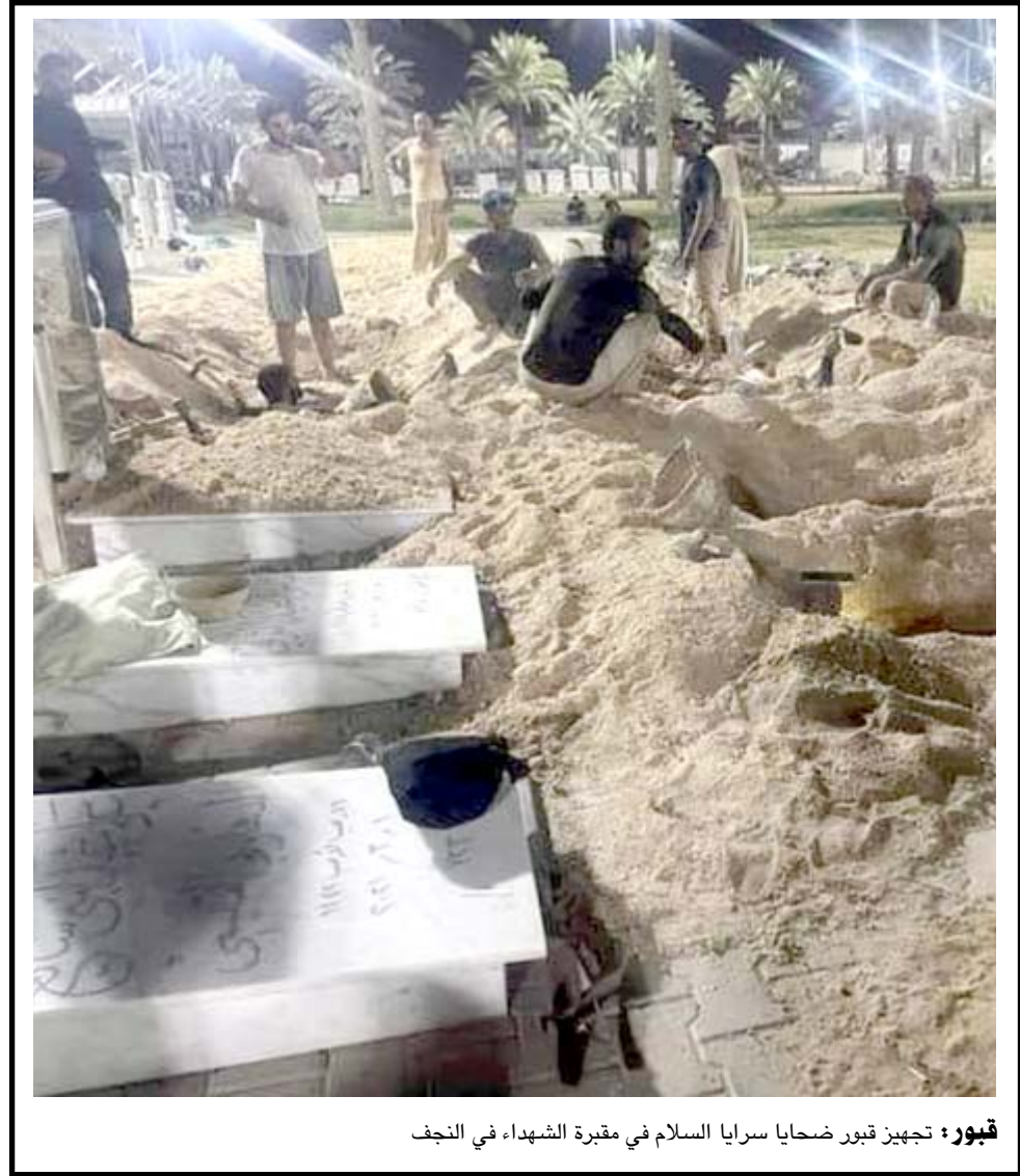
قبور: تجهيز قبور ضحايا سرايا السلام في مقبرة الشهداء في النجف

وفق أعلى معايير الجودة والسلامة المهنية المعتمدة عالمياً في صيانة وإدامة طائرات أسطول الناقال الوطني فضلاً عن تأكيد معاليه على الإهتمام بجميع الجوانب وتقديم أفضل الخدمات للمسافرين الكرام. وقال بيان تلقته (الزمان) امس ان هذه الزيارة تندرج ضمن سلسلة زيارات ميدانية متواصلة يجريها معالي وزير النقل الى الخطوط الجوية العراقية للوقوف على واقع الحال ميدانياً والتي تهدف الى تطوير مستويات العمل ومواكبة التطور الحاصل عالمياً في مجالات النقل بأشكالها المختلفة. وقد حدد معاليه مدداً زمنية لإنجاز أقسام وشعب الشركة وبالأخص ما يتعلق بصيانة الطائرات المتوقفة والخارجة عن العمل ومسابقة الزمن من اجل صيانتها ودخولها للخدمة من جديد لتعزيز أسطول الطائر الأخضر على ان يتم ذلك