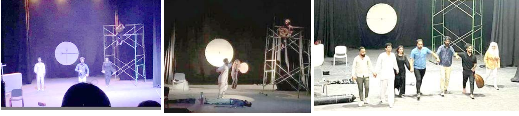
مسرحية: لقطات من مسرحية (أوكسجين)

الإفك معرفياً وشمل الجانب الفلسفي وعلم الاجتماع وعلم النفس وتناول أيضاً الإفك في النص المسرحي العالمي والعربي) مضيئة (كانت حدود البحث النصوص المسرحية المؤلفة للعدة من ٢٠١٠ إلى ٢٠٢١ وشملت العراق، فلسطين-السودان مصر- السعودية في ما شمل مجتمع البحث ٢٧ عملاً مسرحياً اختير منها ٥ أعمال لتكون عينة البحث وقد توصلت البحث إلى جملة من النتائج من أهمها أن كتاب المسرح العربي استطاعوا أن يجعلوا الإفك مضمناً شكلاً ومضموناً عبر الأساليب المتبعة لتوظيف مقاربات الإفك وجعلها ذات مضامين فعالة عن طريق التمتع والإقناع وخلق الصراعات بين الشخصيات وأن الإفك قد تمثل برسم طريقاً للشخصيات المسرحية للانطلاق من الدائرة الصغيرة بالصراع إلى الدائرة الكبيرة وصولاً إلى الزروة مستغربين أسلوب الإفك القسولي اللساني لأحداث النتائج الفعلية