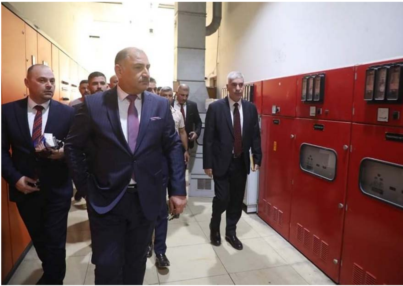
تفقد وزير الصناعة خلال جولته التفقدية

بغداد - ابتهاج العربي زار وزير الصناعة والمعادن، منبهل عزيزي الخباز، مصنع المنصور التابع الى الشركة العامة للمنتوجات الغذائية، وذكر بيان أن (الزيارة جاءت للوقوف على المحوقات التي وحل المشكلات التي تتعلق بالجوانب المالية والإدارية والفنية).