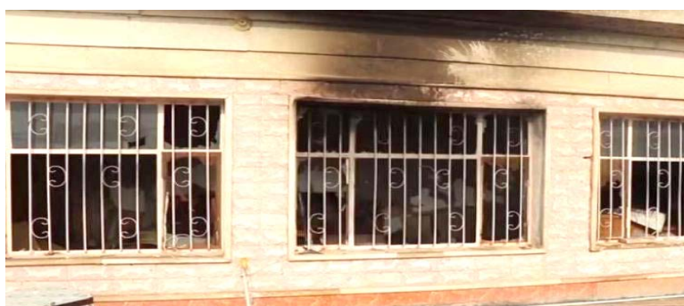
نادي اثار حرق نادي النفط في ميسان

بغداد، لنقر مغادرة المكان، وأشار إلى انه بجهد طبيعية الطريق ومخاطره وانسداده ورغم ذلك قررا مغادرة بغداد الآن وفي وقت متأخر من تحسباً لحدوث أي مكروه للاعبين، اننا نحرص على سلامة اللاعبين وان سلامتهم هم من اي مباراة. وكان نادي دهوك لكرة القدم يستعد ملاقاته نادي الناصرية يوم السبت في العاصمه بغداد لتحدد المقابلة في العاصمه بغداد لتحدد المقابلة في الدوري الممتاز الآن.