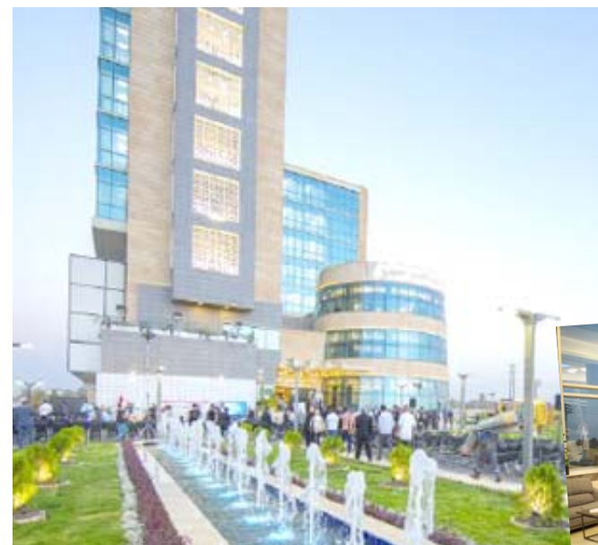
مركز: افتتاح اكبر مركز للتوحّد في كربلاء