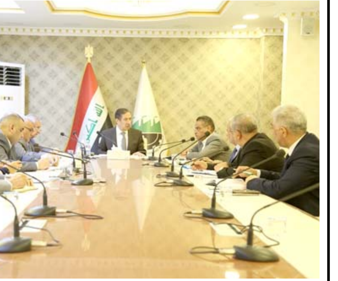
اجتماع: وكيل وزارة الصناعة يترأس اجتماعاً ضم مديري دوائر الوزارة

متعمدة، لتشويه وتعطيل عجلة الصناعة). واضاف ان (هذه اللحظة تعتمد تضليل الرأي العام عن طريق بعض الأشخاص لغرض الإساءة، لصالح جهات معينة). مشيراً الى ان (الوزارة تمتلك شركات ومعامل في محافظة نينوى، بعضها تعمل بإنسيابية والبعض الآخر يجري العمل لإعادة تأهيله). مؤكداً ان (الوزارة ستستخذ الإجراءات القانونية اللازمة بحق القنائة، ومن اساء وزير الحقائق في الفديوي وفق معلومات