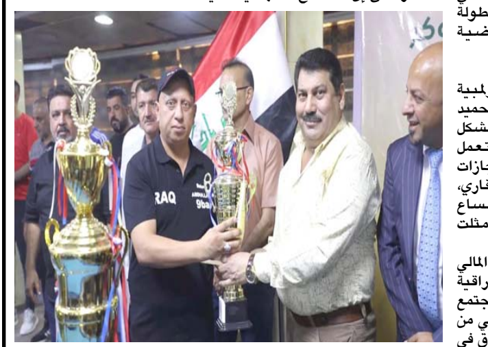
تكريم، جانب من تكريم الفائز بطولة البيليارد من قبل اللجنة الأولمبية