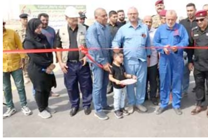
افتتاح: محافظ ميسان علي دواي يفتتح مشروع طريق منفذ الشيب الحدودي