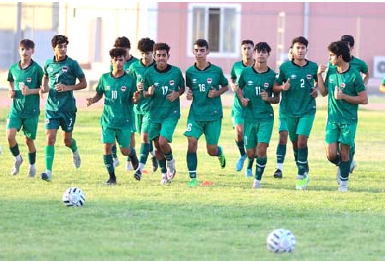
تدريبات: منتخب الناشئين يجري تدريباته الاخيرة قبل مواجهة المغرب